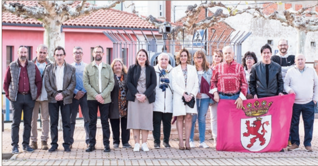
Foto de la candidatura leonesista de Santa María del Páramo para las Municipales del 28M integrada por 16 vecinos 'comprometidos'.

La candidatura leonesista está integrada por un total de 16 personas, vecinos de la Villa de Santa María del Páramo, formada por distintas personas que forman parte de colectivos y grupos que participan en la vida del municipio en distintas actividades culturales, sociales, económicas, lo que permite mantener un grupo con los concejales que formaban el equipo de gobierno y que eran siete en el grupo de Unión del Pueblo Leonés en el mandato 2019-2023,