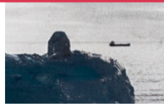
VIAJES DE IDA Y VUELTA José Ferrero & Miguel Galano Fotografía y pintura

Hasta el 27 de agosto • Lugar: Centro Leonés de Arte (Independencia, 18). • Horario: De martes a viernes, de 17 a 20h. Sábado, de 11 a 14h. y 17 a 20h. Domingos y festivos, de 11 a 14h.