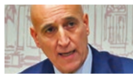
José Antonio Díez Alcalde de León

El alcalde de León recogió el martes 25 de abril en Madrid el premio que reconoce a la ciudad de León como 'Mejor Destino Urbano de España' por la revista Viajes National Geographic, donde ha puesto en valor las "maravillas arquitectónicas" de la capital, que se encuentra enclavada en el Camino de Santiago. Díez agradeció el reconocimiento, una distinción realizada en el marco de los Premios de los Lectores 2023 en los que han votado miles de personas, según la propia publicación, que se ha convertido en una "auténtica referencia en el mundo del viaje". Díez resaltó la apuesta municipal por el patrimonio, la cultura y el turismo.