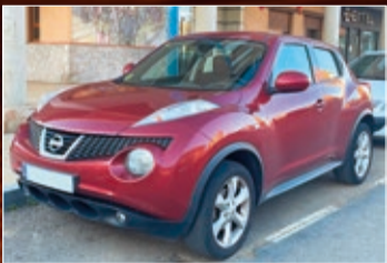
NISSAN JUKE DCI 110 CV AÑO 2012 • 11.600 €