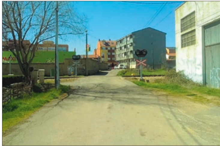
Uno de los pasos a nivel de la línea de Feve que Adif suprimirá en Villaquilambre.

Para garantizar la permeabilidad transversal peatonal, el proyecto incluye también la ejecución de una pasarela peatonal metálica sobre las vías, en el entorno del paso a nivel del PK 2/455. El proyecto se