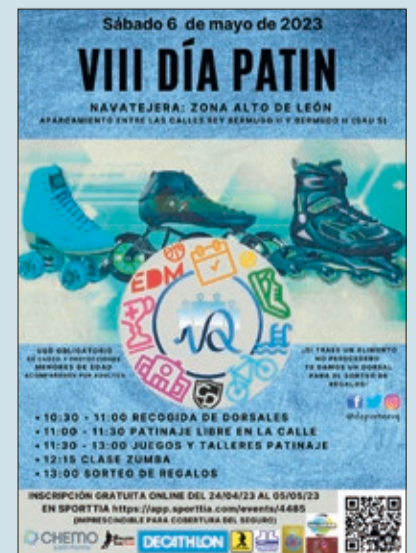
Cartel del VIII Día del Patín Solidario.

La Concejalía de Deportes de Villaquilambre ha organizado el 'VIII Día del Patín Solidario' que se celebrará el 6 de mayo en Navatejera (Alto León SAU 5). Es un evento ya consolidado con actividades, talleres y competiciones relacionados con el mundo del patinaje como slalom, equilibrio, velocidad, hockey... En 2022 participaron 300 niños, jóvenes y adultos. El evento tiene un trasfondo solidario en la que cada participante debe llevar un alimento no perecedero para banco de alimentos municipal.