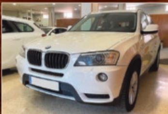
BMW X3 20D X-DRIVE 184 CV. AUTO 8 VEL. NAVY, XENON, LED, ETC... MOD. 2011 • 16.900 €