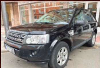
LAND ROVER FREELANDER II TD4 150 CV CUERO AÑO 2010 • 10.900 €