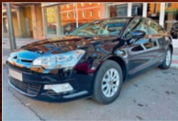
CITROEN C5 HDI 110 CV BUSINESS, CLIMA, TEMPOMAT, ETC. AÑO 2010 • 9.600 €

Avda. Párroco Pablo Díez 199 Trobajo del Camino 24010 León Tel.: 987 840 448 www.autoscelada.es