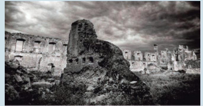
Una imagen de la exposición, en concreto del Monasterio de San Pedro de Eslonza.

CULTURA | HASTA EL 21 DE MAYO EN EL CENTRO CULTURAL DE BRED