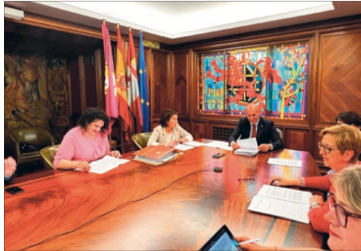
Junta de Gobierno Local del Ayuntamiento de León celebrada el viernes 21 de abril.

El diseño de la instalación incluye la construcción de unos módulos de hormigón diseñados con la intención de satisfacer las necesi-