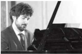
JOSÉ ANTONIO TOLOSA Piano • Viernes, 28 de abril, 19:30 h.