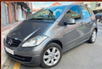
MERCEDES A180 CDI 109 CV. AÑO 2011 • 9.600 €