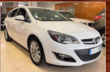
OPEL ASTRA CDTI 130 CV SPORTS TOURER NAVY XENON 11/2013 • 11.200 €