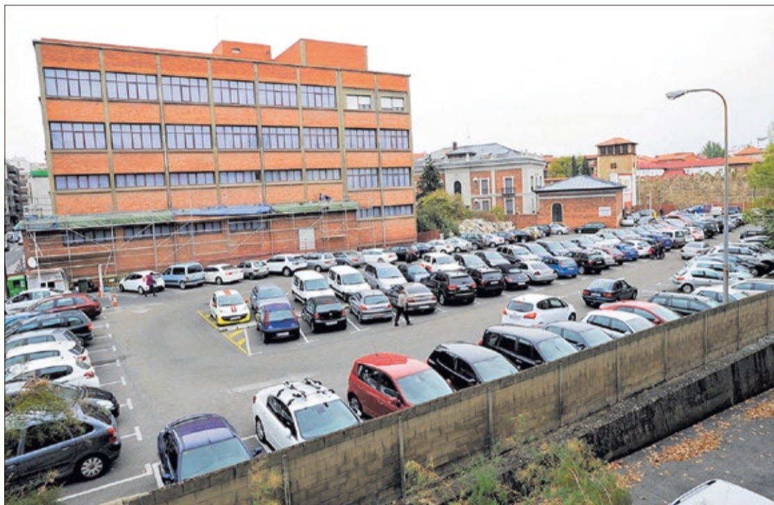
El llamado parking de Santa Nonia y su uso ha estado envuelto en polémica desde que abrió su actividad hace más de 30 años.

En la actualidad, el parking de Santa Nonia sigue ofreciendo el servicio en planta calle a través de una cooperativa de discapacitados, pero sin pagar canon alguno ni licencia de actividad. En 2019, el Ayuntamiento de León pidió a la Diputación la cesión del