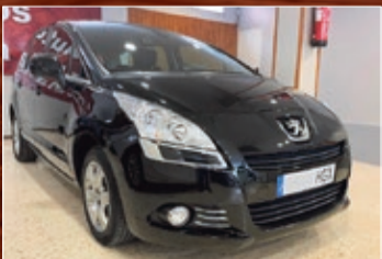
PEUGEOT 5008 PREMIUM HDI 112 CV. AÑO 2011 • 10.600 €