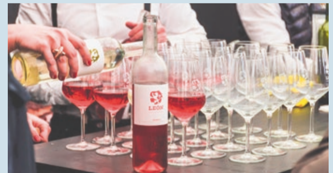
Las producciones del sur de la provincia demuestran la alta calidad enológica.

ENOLOGÍA | TRES MEDALLAS DE ORO EN LYON; Y OTRO ORO MÁS EN MARSELLA