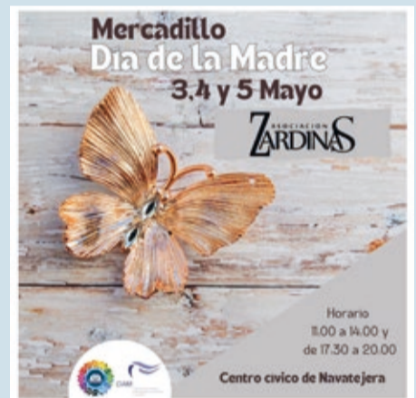
Cartel del mercadillo del Día de la Madre

La Asociación Zardinas de Villaquilambre ha organizado un mercadillo con motivo del Día de la Madre que se celebrará los días 3, 4 y 5 de mayo en el Centro Cívico de Navatejera, donde se podrán encontrar 'cosas bonitas para regalar' realizadas por las artesanas de la asociación. Esta iniciativa cuenta con la colaboración del Ayuntamiento de Villaquilambre y del Centro de Información y Asesoramiento a la Mujer e Igualdad (CIAMI).