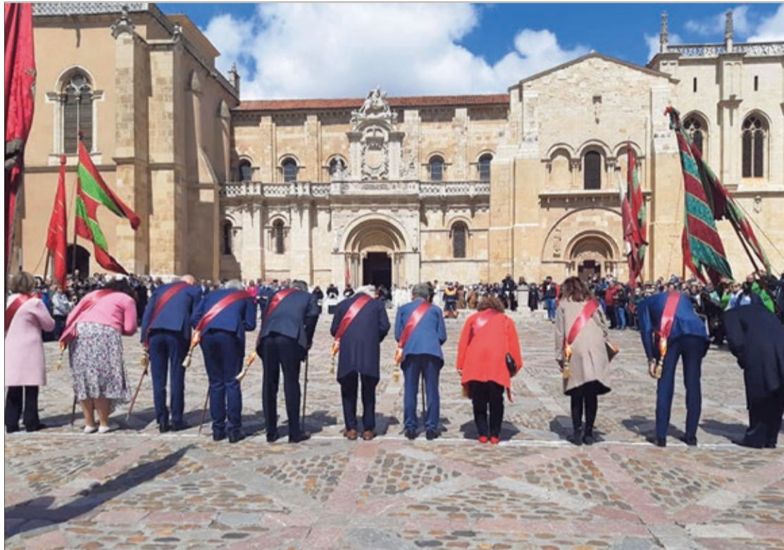
Exagerada reverencia que la Corporación realiza tres veces para despedirse del Cabildo de San Isidoro en Las Cabezas.

La fiesta de Las Cabezas rememora la intercesión de San Isidoro durante un período de sequía. Cuenta la tradición que en 1158, durante un período de se-