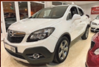
OPEL MOKKA 1.7 CDTI 130CV 4X4 NAVY, XENON, LED, ETC... AÑO 2013 • 12.600€