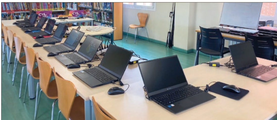
Los 12 equipos de CyL Digital han llegado a la Biblioteca de La Virgen para poder realizar este tipo de formación en informática.