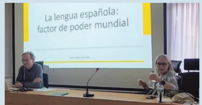
Momento de la conferencia organizada por la Asociación Héroes de Cavite.

CULTURA | CHARLA CELEBRADA EN LA CÁMARA DE COMERCIO