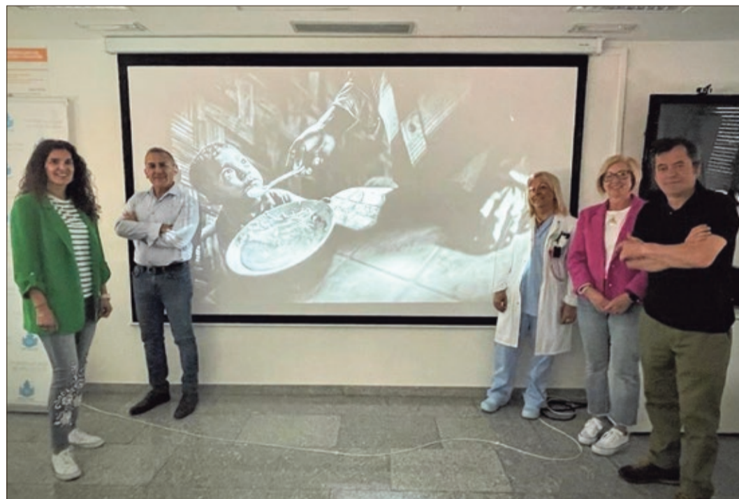
El jurado, compuesto por fotógrafos leoneses y trabajadoras del hospital, falló el concurso fotográfico el 21 de abril.