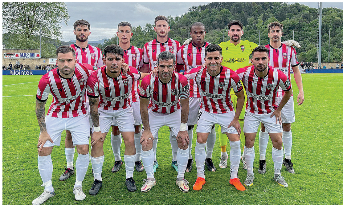
El once de la Unión Deportiva Logroñés que cayó en Urritxe.