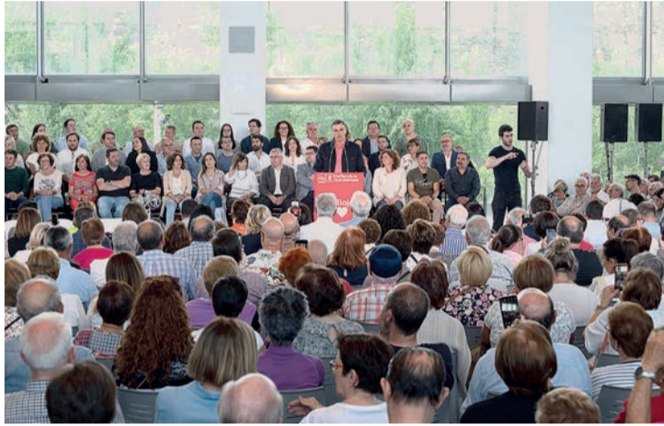
Pedro Sánchez, en su intervención en Riojaforum.

Este viernes 28 de abril, a un mes exacto del 28 de mayo, cita con las urnas para los riojanos en los comicios autonómicos y municipales, se celebrará el último Pleno de la X Legislatura en el Parlamento de La Rioja (y debatirá la Ley de Función Pública). Con las listas registradas, los partidos se encuentran en plena precampaña. Para reforzar a los aspirantes socialistas en Logroño, Pablo Hermoso de Mendoza, y la comunidad, Concha Andreu, el presidente del Gobierno, Pedro Sánchez, realizó una visita relámpago y un acto político en Riojaforum. Igualmente fugaz, el candidato popular al Palacete, Gonzalo Capellán, participó en un desayuno informativo en Madrid con la número dos de su formación, Cuca Gamarra. Ciudadanos, PR+ España Vaciada, Por La Rioja, IU-Podemos, Vox... todos pretenden posicionarse