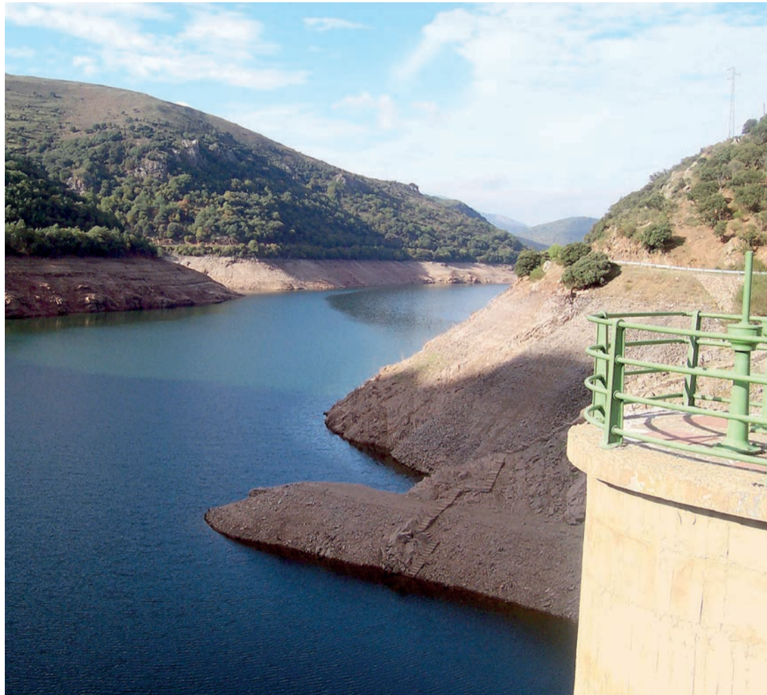
Imagen del embalse de Mansilla.