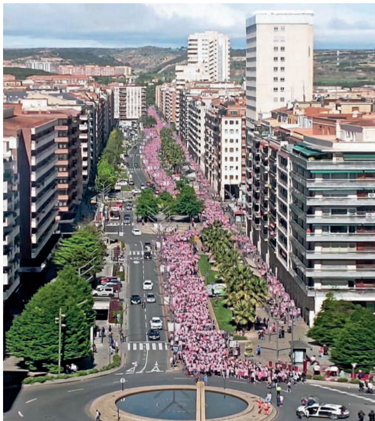
La VIII Carrera de la Mujer por la Investigación.

“Es un día grande para las mujeres de La Rioja, porque la investigación de hoy es la medicina de mañana, así como la esperanza de muchas personas”, señaló la presi-