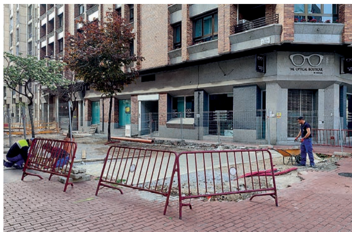
Las reparaciones emprendidas por el Ayuntamiento en las Cien Tiendas.

Asimismo, el primer edil se disculpó por el hecho de que “estas tareas no se acometieran antes”, de igual manera que “por los problemas y retrasos ocasionados a vecinos y comerciantes”. Además, Hermoso confirmó que su equipo de gobierno se afana en