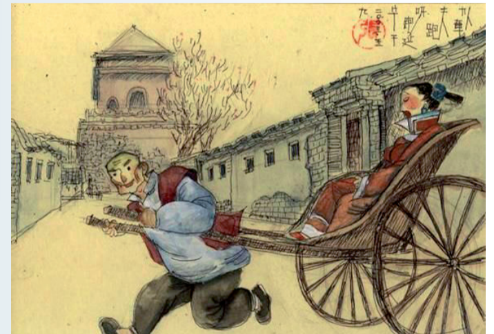
Un rickshaw chino.

empresa es doble. Por un lado, pretende satisfacer, en la mayor brevedad de tiempo, al cliente. Y por el otro, ajustar los costes, tanto de personal, como en gasto de transporte. En este punto es precisamente en el que existe el mayor problema para las compañías de transporte y logística. Llevar a un punto cercano de la entrega final un conjunto grande de paquetes es fácil. Se llena un camión de palés y se transporta. Sin embargo, en la 'última milla' se realiza una distribución mucho más pormenorizada. Y ahí me figuro yo que, según esté estructurada la ciudad, los repartidores tendrán más o menos problemas. Me gustaría saber qué piensan los repartidores de la nueva estructura de las calles de Logroño, porque yo con un 'rickshaw' chino no los veo.