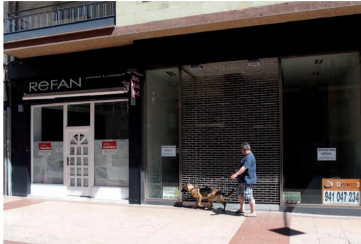
Tiendas cerradas en Logroño.

La FER reclama a las Administraciones Públicas "el máximo apoyo a la actividad de los autónomos, que tienen que soportar unos costes de la actividad, triplicados en los últimos años, especialmente por los