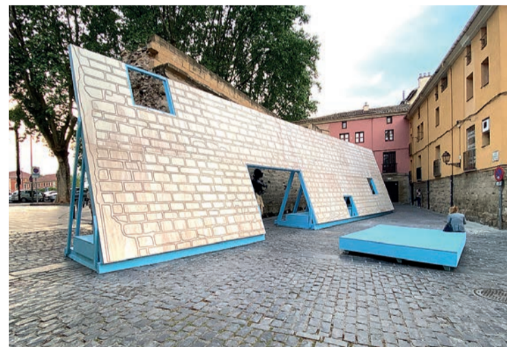
La intervención junto al Revellín.