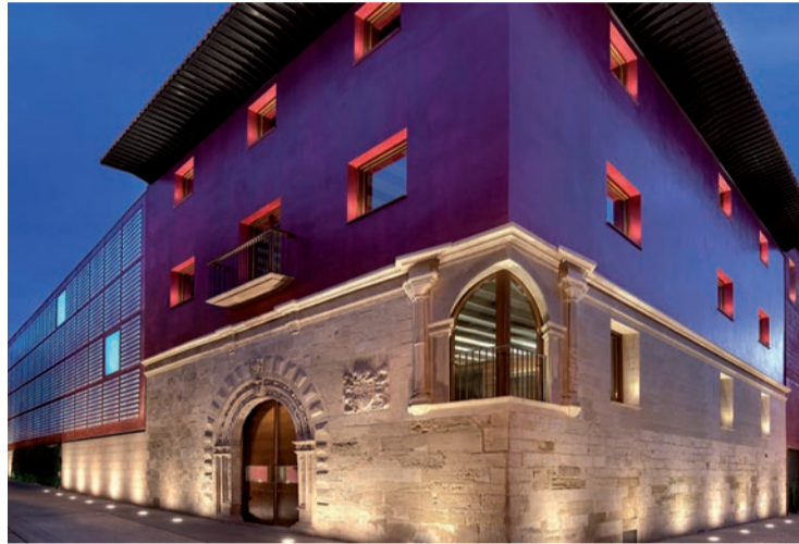
El CCR de Logroño.

Además, se aprobó el expediente para la contratación de un préstamo de 12 millones de euros para la financiación de diferentes inversiones incluidas en el Presu-