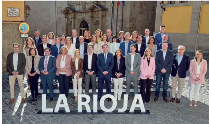
La candidatura autonómica popular para el 28M.