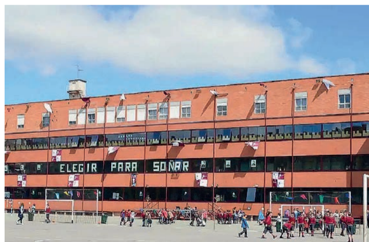
El Sagrado Corazón de Logroño.

El Consejo tiene la potestad de postular un máximo de siete días para fiestas de carácter local: dos corresponden a los festivos locales (21 de septiembre, San Mateo, y 11 de junio, San Bernabé); de los otros cinco, cuatro son los correspondientes a la semana natural de San Mateo (18, 19, 20 y 22 de septiembre) y el quinto se decidió para el 12 de febrero (dentro de las fies-