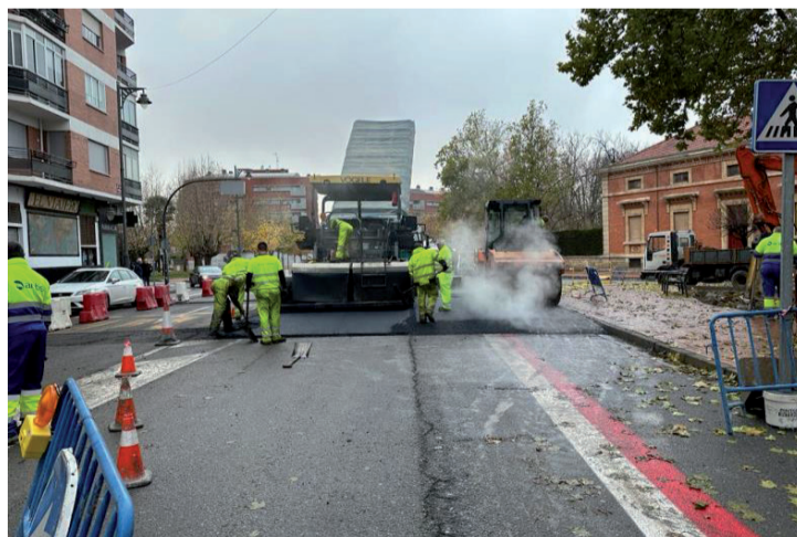
Las obras en Martínez Laorden.

La presidenta, Concha Andreu, invitó a mirar la Encuesta de Población Activa “con perspectiva” y a esperar el del paro por ser “más real”. Sin embargo, su Ejecutivo celebró que la región está entre “las cuatro