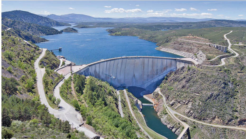
Foto de archivo del embalse de El Atazar

Sin ir más lejos, el año pasado por estas mismas fechas, los pantanos se encontraban al 72,7%, siete puntos por encima del dato actual. En lo