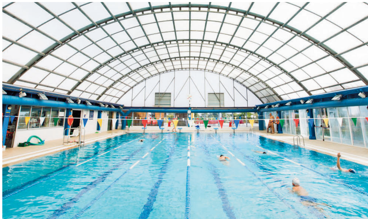
Piscina municipal en Las Rozas

Es importante reconocer los síntomas del calor extremo y así poder actuar ante ellos, ya que pueden ir desde irritaciones en la piel y calambres hasta un aumento de temperatura tal, que puede llevar a la muerte si no se recibe atención médica urgente. Algunos de ellos son los calambres musculares, el agotamiento por calor, con síntomas como debilidad, fatiga, mareos, náuseas o desmayos.