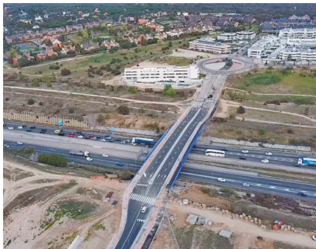
Nueva conexión en Boadilla

Se ha construido un carril por sentido, carril bici y acera. La calzada se ha duplicado antes de llegar a la M-50 hasta su finalización y en la avenida se ha instalado iluminación LED, con sistema de gestión.