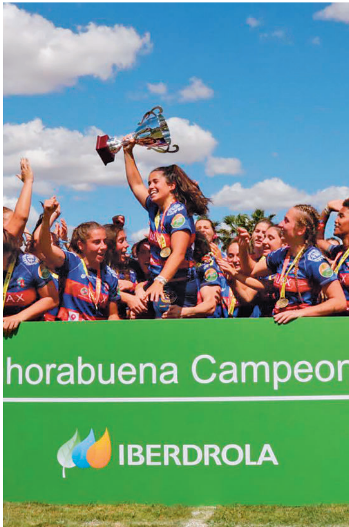
Las jugadoras del CR Majadahonda celebraron este éxito