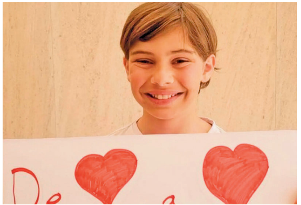
El joven vecino de Boadilla, durante la campaña de recogida de fondos