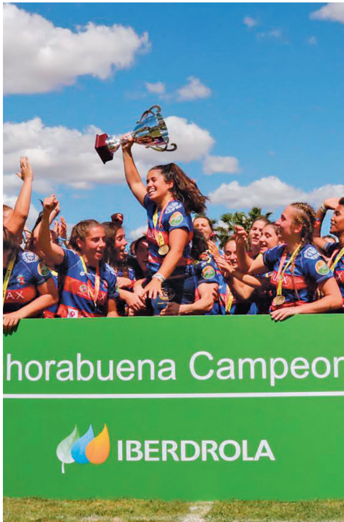
Las jugadoras del CR Majadahonda celebraron este éxito