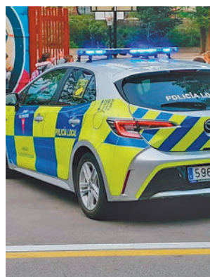
Coche de la Policía Local

licial por las calles de la localidad con un coche robado y sin carnet de conducir. Los hechos se produjeron sobre las 23 horas del jueves día 27 cuando los agentes detectaron al conductor de un vehículo que estaba realizando una conducción negligente en el estacionamiento del re-