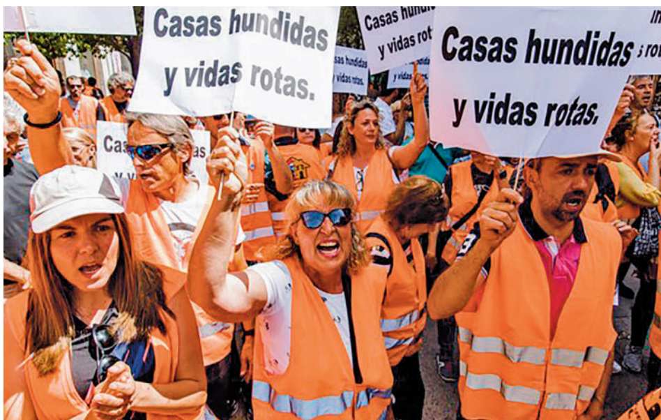
Manifestantes el pasado martes en Sol E.P.