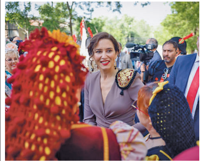
Isabel Díaz Ayuso, durante el 2 de Mayo

El dúo Andy & Lucas celebra sus 20 años en la música con un nuevo disco