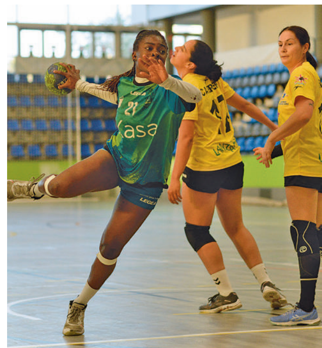
Wella, en el partido de ida ante el Lanzarote IKASA BM