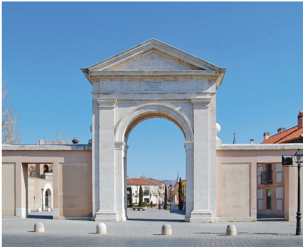
Se actuará en las inmediaciones de la Puerta de Madrid de Alcalá de Henares

Por municipios, Alcalá de Henares es el que más dinero recibe. En total, algo más de 7,4 millones de euros. De ellos, 4,6 millones se destinarán a la peatonalización y la implantación de la Zona de Bajas Emisiones del casco histórico. Además, 2,5 millones de euros irán para la mejora de las pasarelas sobre las vías del tren de las zonas este, oeste y centro. A Torrejón de Ardoz llegarán casi 4 millones de euros. El importe íntegro irá destinado a la ampliación del aparcamiento disuasorio que ya existe en la Plaza de España, junto a la estación