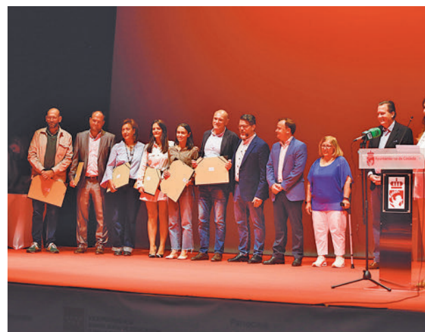
Fotografía de algunos de los galardonados

Los proyectos premiados dentro de la Modalidad A, Mejora del Éxito Escolar, han sido el 'Plan de enriquecimiento para alumnado con altas capacidades y plan de atención al alumnado con dislexia' del CEIP Pablo Neruda; y 'Blashogwarts', del CEIP Blas de Otero. Asimismo, han