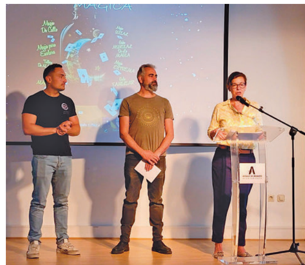
Presentación del evento