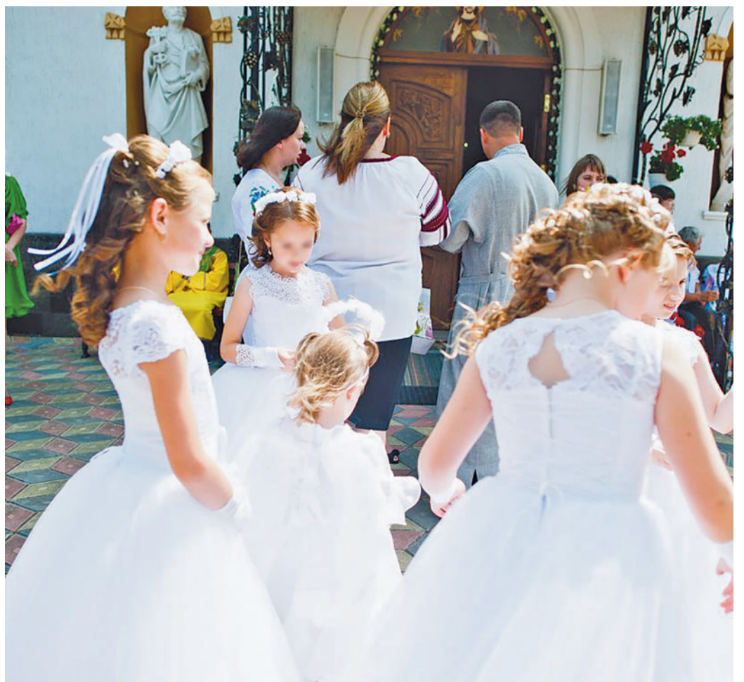
Las comuniones son cada vez más caras

Respecto al coste por comunidades autónomas, Alcarria detalla que son Madrid y Cataluña los territorios donde más han aumentado sus precios en el presupuesto en la celebración de comuniones llegando a superar los 3.000 euros. Un aumento de costes que también se localiza en ciudades como Bilbao, San Sebastián, Pamplona e incluso Logroño. Por contra, las ciudades más económicas en