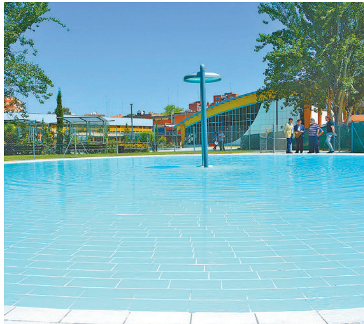
Piscina municipal en Alcorcón

Alcorcón activa el 'Programa de Alerta y Prevención de los Efectos sobre la salud de altas temperatura en el municipio' para proteger a la población y, en especial, a la más vulnerable de los efectos adversos derivados de las altas temperaturas. Cada concejalía se encargará de llevar a cabo las "medidas organizativas o de cualquier otra índole" que resulten precisas, entre otras