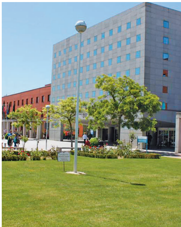
Hospital Universitario Fundación Alcorcón HUFA

Una vez finalizada la adecuación de las cubiertas, la