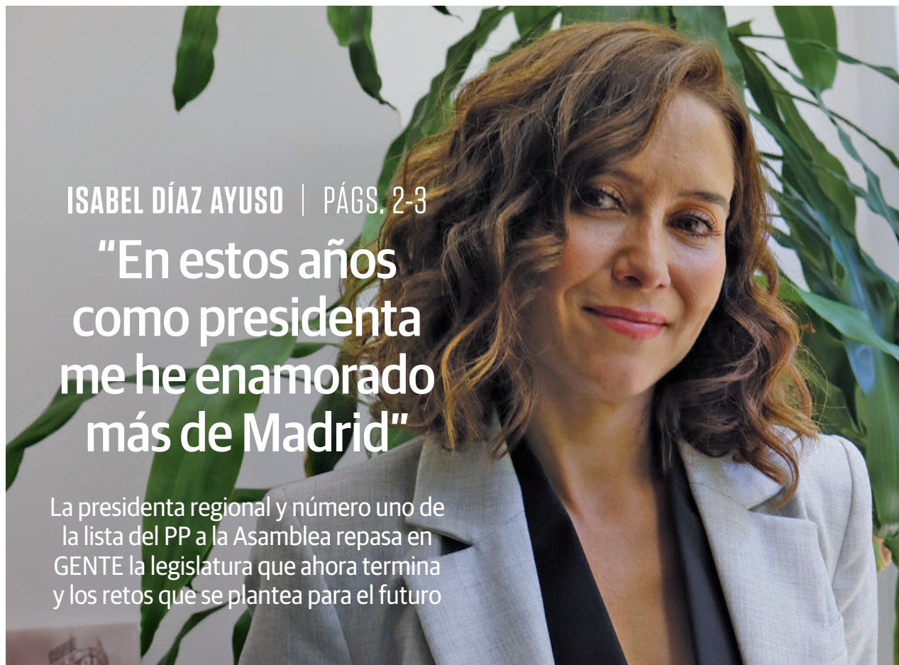
CARLA FLECHA / GENTE

La presidenta regional y número uno de la lista del PP a la Asamblea repasa en GENTE la legislatura que ahora termina y los retos que se plantea para el futuro