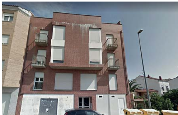
El edificio okupado de Lardero.