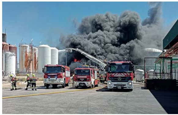
Los bomberos, en la extinción del fuego en la planta de biodiésel de Calahorra.

También se acordó requerir, de nuevo, los expedientes de los Juzgados número 2 de Calahorra y número 3 de Logroño referidos a este caso, como el informe pericial. Una información que, al igual que la solicitada al Ejecutivo riojano, debe ser remitida antes de este sábado