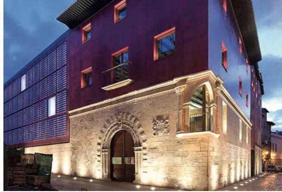
El CCR, iluminado.

Cruz-Dunne recordó que el CCR es un centro municipal de uso polivalente, que engloba diferentes