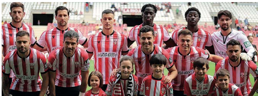
El once que descendió a la Unión Deportiva Logroñés a Segunda RFEF.