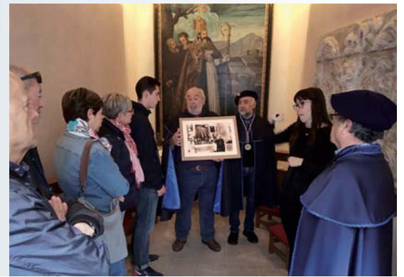
Ermita de San Gregorio.