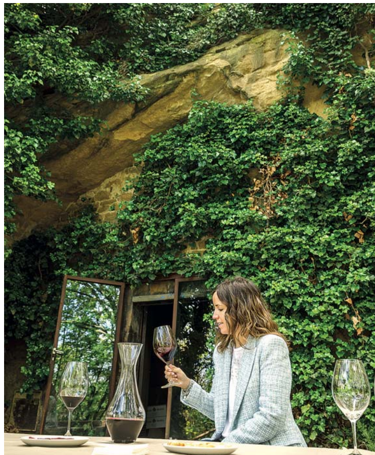
Una cata de vino.