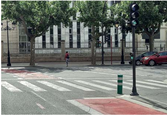
El semáforo para bicis en Muro de la Mata.

MOVILIDAD | Culminación del eje ciclista