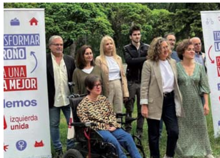
Presentación del equipo Podemos-IU en Logroño.