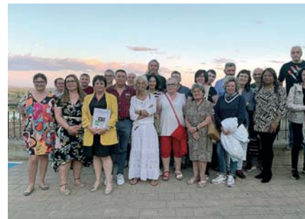
Los aspirantes en Calahorra.