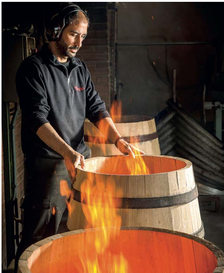
La fabricación artesanal de barricas.