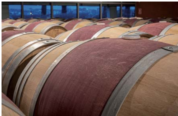
Barricas de vino.

El Gobierno riojano habilitará 15 millones de euros para la destilación de crisis de los 40 millones de litros de vino Rioja comunicados, a razón de 1,13 euros por litro, según anunció la consejera de Agricultura, Eva Hita. Hita señaló que 134 bodegas de las 384 activas en la comunidad aportaron sus datos sobre la necesidad de destilación. Además, el 11% de esas 134 bodegas comunicaron la necesidad de destilar la totalidad de sus existencias, lo que es "inasumible" con fondos públicos, como confirmó Hita: "Y se dará prioridad a las cooperativas y las pequeñas bodegas familiares de La Rioja". Para concluir, la consejera recaló que "esta situación crítica de una parte muy significativa del vino con DOPa Rioja evidencia que el sistema de autorregulación no está funcionando".