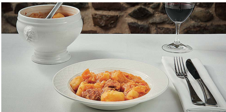
Típicas patatas a la riojana.