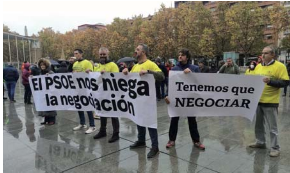
Protesta de la Junta de Personal del Consistorio.

"Unas declaraciones desafortunadas, y más cuando no se cumple con la obligación de negociar con los representantes de los trabajadores municipales. Durante toda esta legislatura, la voluntad de diálogo del primer edil del