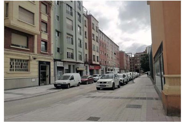
Ruperto Gómez de Segura, una calle en la que se actuará.