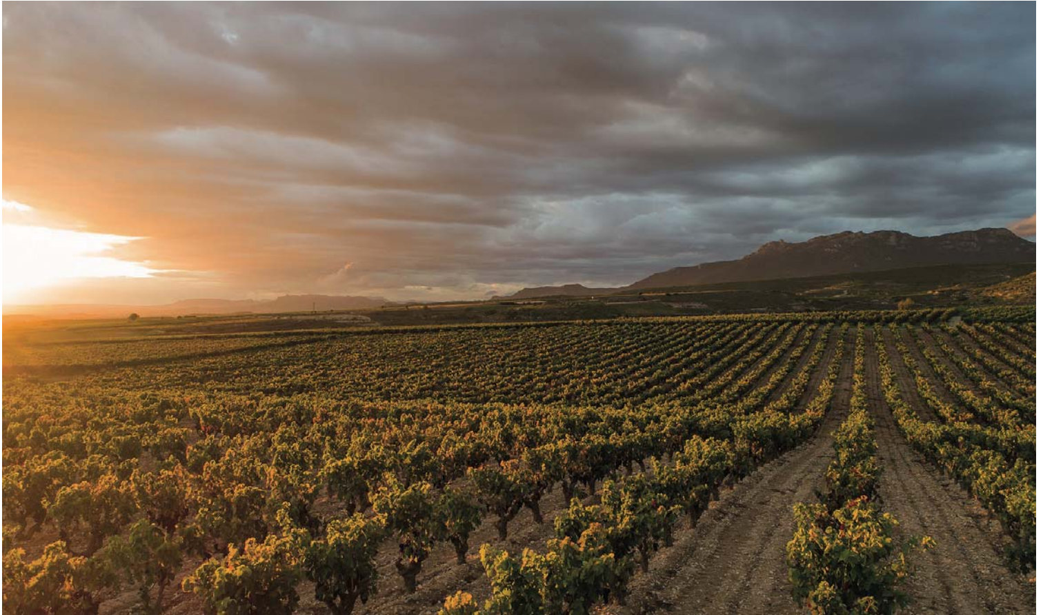
Un atardecer en los viñedos de Álbalos.