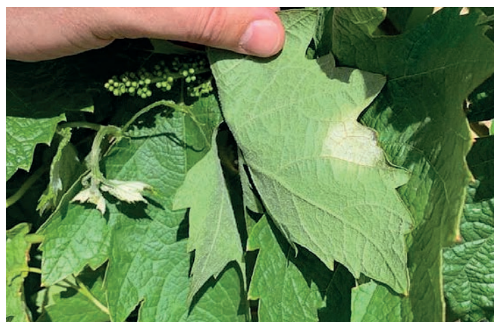
Mancha de mildiu.

Las primeras manchas de la enfermedad se vieron el 8 y 11 de mayo