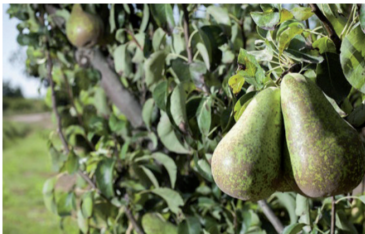
Los perales del Iregua.