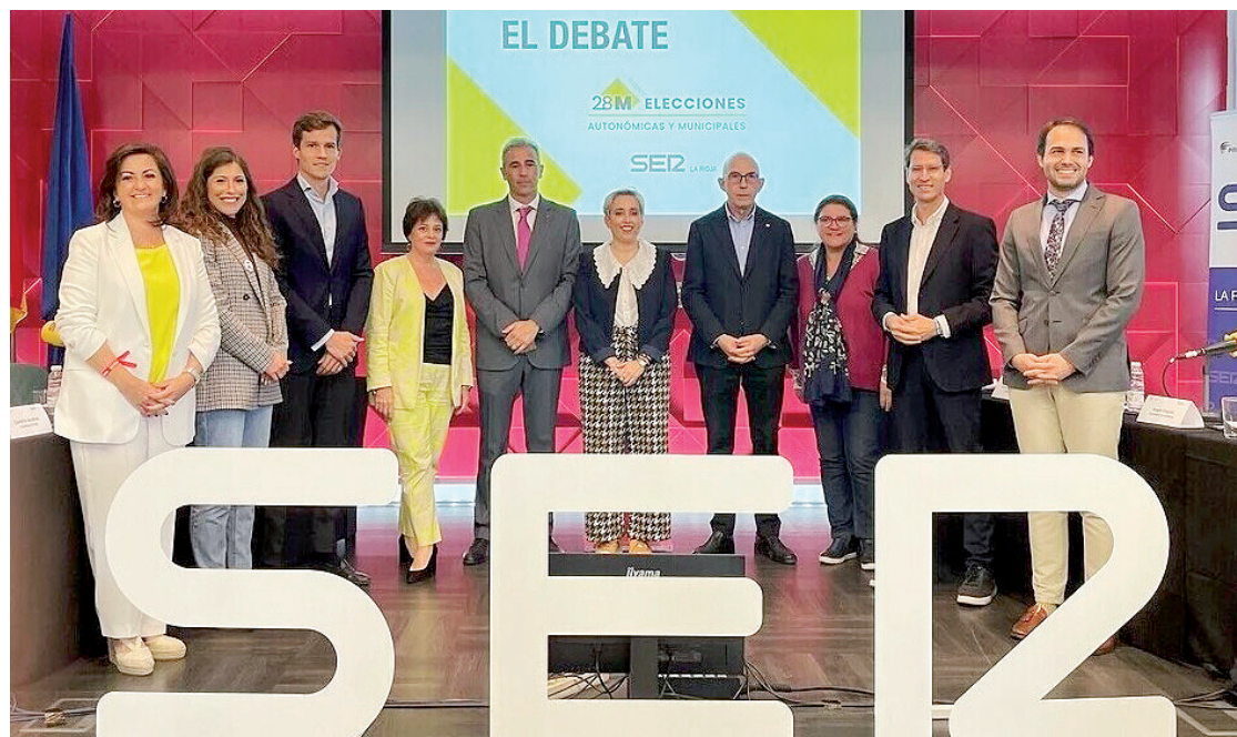
Los siete candidatos a la presidencia del Gobierno, en el debate de la SER y la UR.

Capellán confirmó que derogaría el Decreto de Convivencia y cargó contra la “mala gestión” del Valle de la Lengua y la Ciudad del Envase y el Embalaje (“Dos proyectos que de momento son humo y no interesan, la autonomía debería aprovechar mucho más sus potencialidades y mejorar la econo-