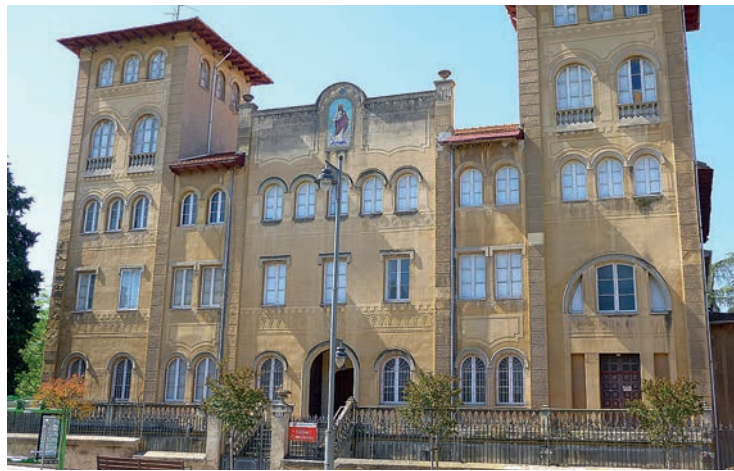
El edificio de Corazonistas, en Logroño.

El Consejo de Gobierno aprobó el convenio para la creación del Centro de Inteligencia de la Nueva Economía de la Lengua, que se ubicará en el edificio Corazonistas de Logroño en el marco del proyecto Valle de la Lengua. El trato debe ser ratificado próximamente con el Ministerio de Asuntos Económicos y Transformación Digital, y recoge las actuaciones avanzadas por los presidentes de La Rioja, Concha Andreu, y de España, Pedro Sánchez, el 7 de diciembre pasado en San Millán de la Cogolla: habrá 44,67 millones de euros, de los que la Administración riojana aportará 23,87 y la nacional, los otros 20,80. El objetivo es convertir a la lengua española en una herramienta de desarrollo en un escenario digital y globalizado.