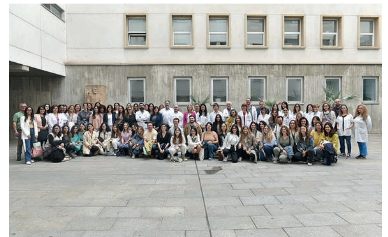
Los nuevos MIR.

SANIDAD | Periodo de formación en La Rioja