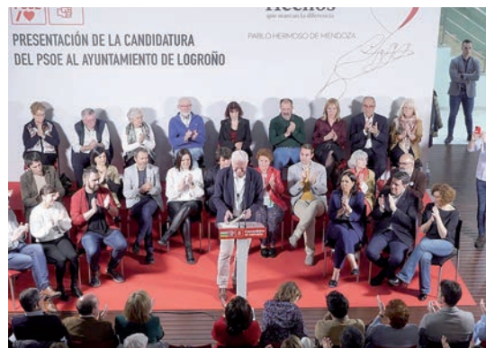
Pablo Hermoso de Mendoza y su equipo.

“trabajar para mejorar los municipios”, y propone “continuar avanzando para cuidar a las personas y conseguir que Logroño sea la mejor ciudad para vivir”. En su ideario, “un Logroño alegre, tolerante, con oportunidades y con una gestión enfocada a los vecinos, valiente y a veces con audacia, con una apuesta clara por la movilidad sostenible, el peatón y en contra de la tristeza del PP y de sus dobles filas”.