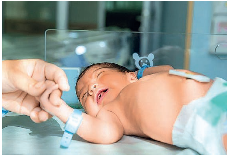
La imagen de un recién nacido.

Los datos del Instituto Nacional de Estadística muestran que 2016 fue el último año en el que en nacieron más de 100.000 bebés durante el primer trimestre del año en el país, y 2017, en el que se batió en ese lapso el millar de alumbramientos diarios. La evolución negativa de la natalidad es común a prácticamente toda España, y exclusiva-