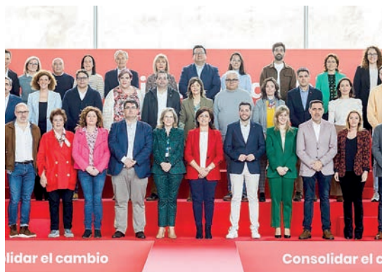
El grupo de Concha Andreu al Parlamento.