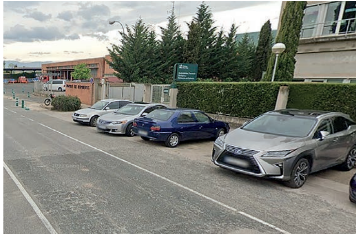
La calle Prado Viejo, con la Consejería de Sostenibilidad y el Parque de Bomberos.

La Junta de Gobierno Local aprobó el proyecto de urbanización en la calle Prado Viejo, vinculado al convenio urbanístico presentado por Inmuebles Moisela, propietaria del terreno. La empresa ejecutará la acera este de Prado Viejo, entre la Avenida de Burgos y Rodejón, asumiendo también el coste, de 70.000 euros. De esta forma, "la ciudad logrará una mejora importante para la movilidad peatonal en la zona al mejorar la conexión entre Avenida de Burgos y Alfonso VI", en