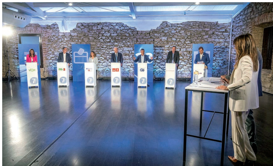
Los siete aspirantes a la alcaldía de la capital riojana, Logroño, en el programa especial de La 7.