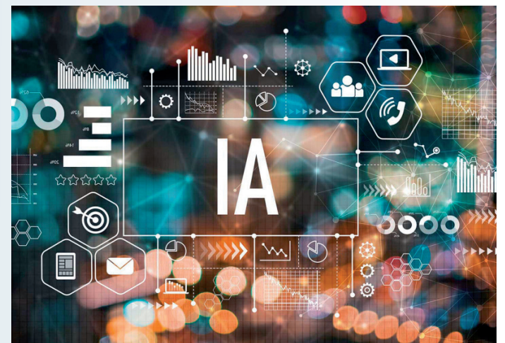
IA. Inteligencia Artificial.

manas. El Metaverso es un mundo virtual, uno al que nos conectamos utilizando una serie de dispositivos que nos harán pensar que realmente estamos dentro de él, interactuando con todos sus elementos. Será como realmente teletransportarse a un mundo totalmente nuevo a través de gafas de realidad virtual y otros complementos que nos permitirán interactuar con él. De las criptomonedas todavía no he asimilado el concepto. Vamos, que dentro de poco vamos a vivir, pero sin vivir o algo así. Y ya no nos van a servir todos los carriles bici que están poniendo en mi pueblo, si voy a poder pedalear por donde quiera y además cambiando de bici todos los días. Ufff... menudo lío. No sé cómo va a acabar todo esto, pero no parece que bien.