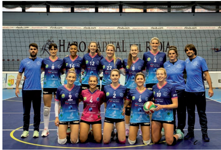
El Haro Rioja Vóley.

El Decreto por el que se otorga la distinción al Haro Rioja Vóley señala que "se caracteriza por ser un conjunto de referencia con cantera