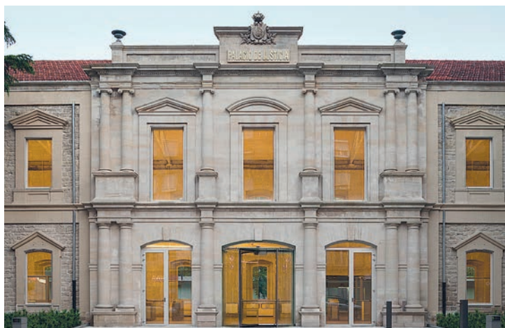
El Palacio de Justicia.

Esta agresión sexual, según el Código Penal anterior a la inclusión de la regla orgánica 10/2022, de garantía integral de la libertad sexual, hubiera podido estar castigada entre tres y seis años de prisión; y, con la Ley del 'sólo sí es sí', está penada entre dos y cuatro años de cárcel.