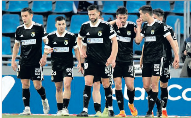
El conjunto blanquinegro llega al duelo tras caer en Tenerife.

El conjunto blanquinegro intentará sumar los tres puntos para estar lo más arriba posible en la clasificación. El equipo burgalés puede ascender hasta la novena posición o descender varios puestos en la última jornada, según los resultados de la jornada. Calero contará con toda la plantilla para el choque menos con Matos, sancionado por acu-