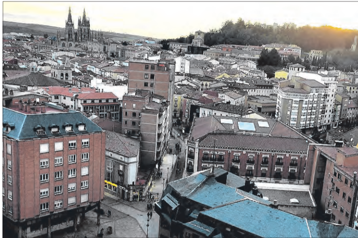
El proyecto Indicadores Urbanos 2023 ha estudiado 126 ciudades, entre ellas Burgos.

Además del indicador correspondiente a la renta, la publicación, cuyos resultados publicó el Instituto Nacional de Estadística (INE) el 22 de mayo, recoge información correspondiente a la esperanza de vida al nacimiento,