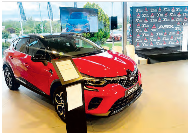
El diseño del nuevo ASX se basa en una estética llena de vigor, dinamismo, robustez y deportividad.

La ampliación de la gama de productos ha sido una constante durante estas tres décadas, lo que ha permitido al concesionario su consolidación, incremento de facturación y ampliación de plantillas para poder dar servicio a las nuevas necesidades tanto en