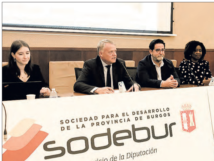
Presentación del programa europeo, el martes 23.

Por su parte, el director del Centro Europeo de Empresas e