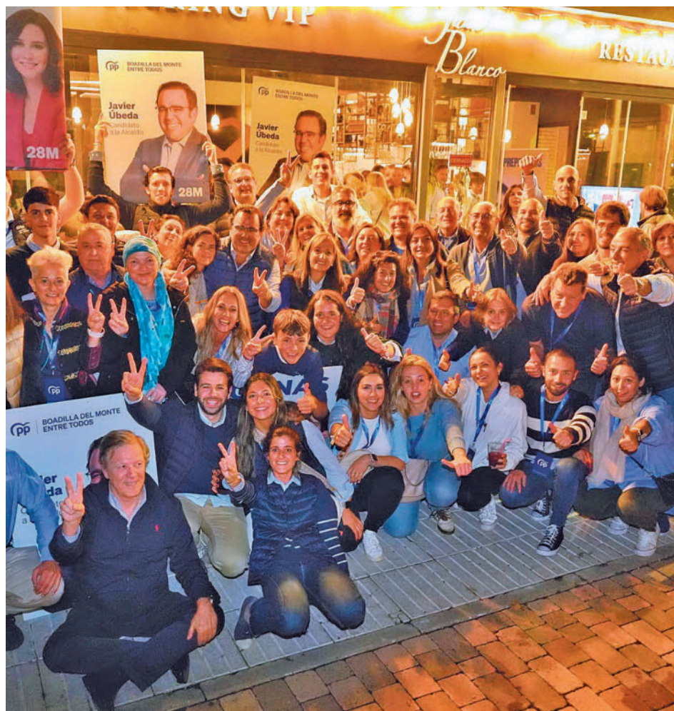
El Partido Popular de Boadilla celebra los resultados

Vox, segunda fuerza Con Ciudadanos desaparecido, el segundo puesto en estas elecciones municipales