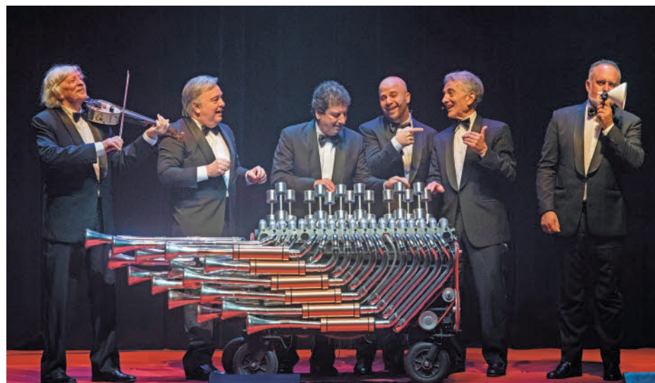
Los seis integrantes actuales de Les Luthiers