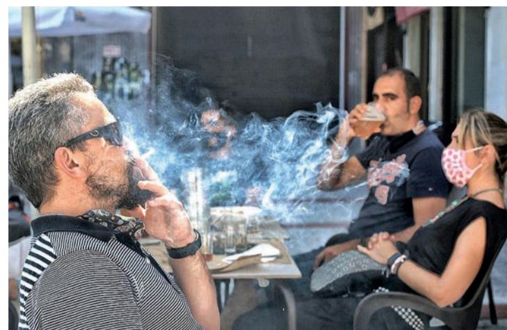
Un fumador, en una terraza.