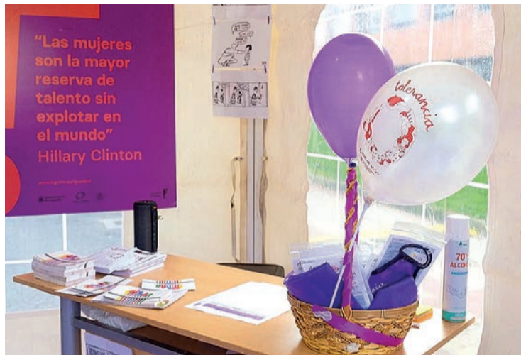
Un Punto Violeta contra las agresiones machistas.

En este recuento figuran todos los actos de violencia física o psicológica, incluidas las agresiones a la libertad sexual, las amenazas, las coacciones o la privación de li-