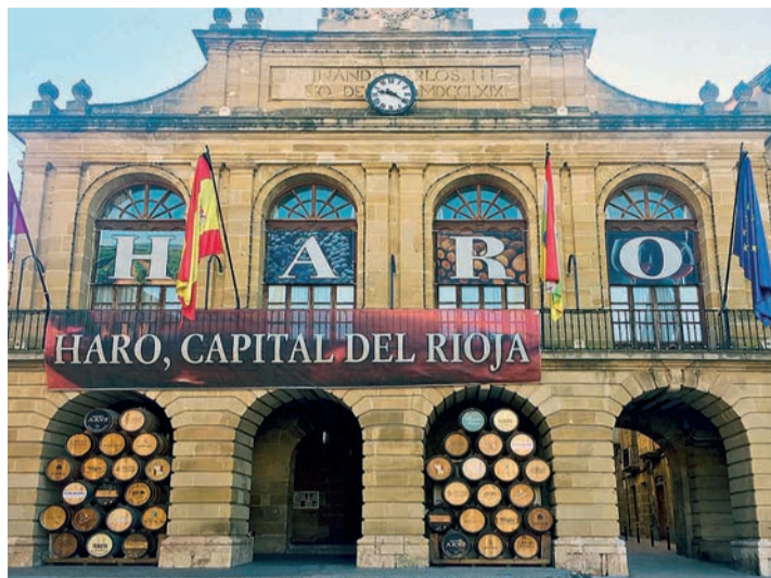
El Consistorio de Haro.