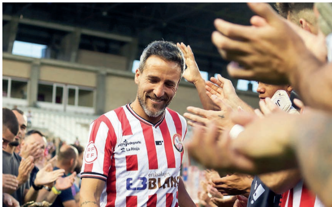
César Caneda recibe el homenaje en su retirada del fútbol.