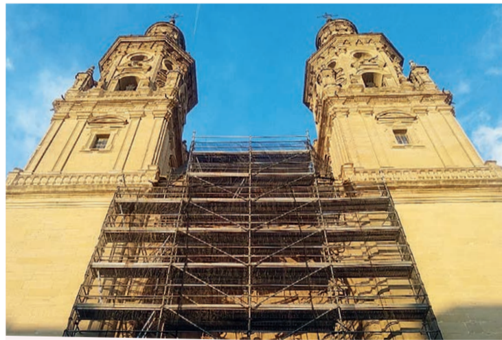
La fachada de La Redonda.