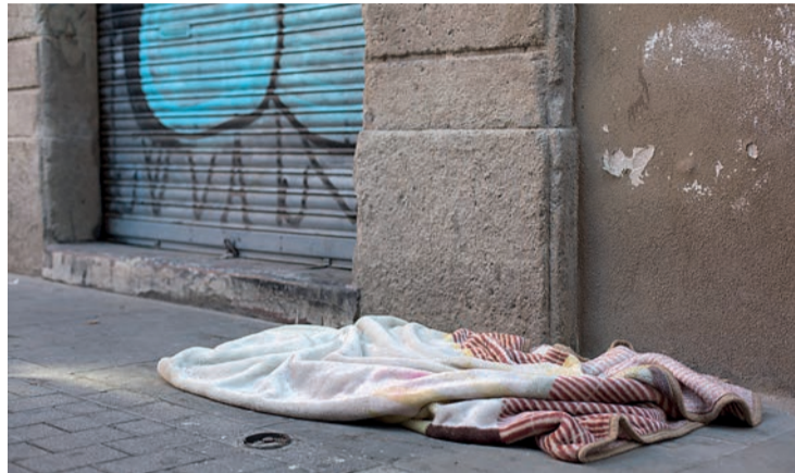
El refugio de una persona sin techo.

No obstante, se considera que las personas son pobres si viven en un hogar cuyos ingresos son inferiores a 10.088 euros (840,6 euros al mes) y, con ese indicador, La Rioja cuenta con un 16,6% de sus habitantes en riesgo de pobreza, un 4% menos que el pasado año. Otro de los apartados relaciona la po-