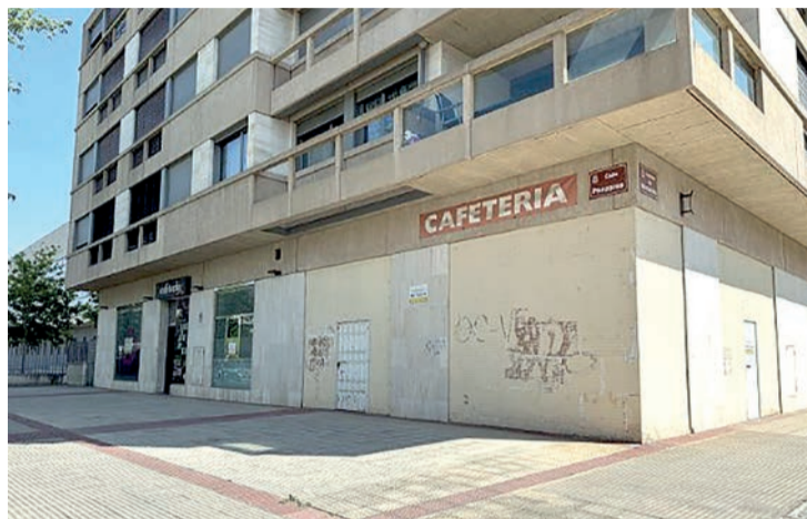
Un negocio cerrado en Logroño.

El mayor número de autónomos está representado por los sectores comercial y de reparación de vehículos de motor, con 5.208. El siguiente colectivo es el de la agricultura y la ganadería, silvicultura y pesca, con 4.099. La construcción cuenta en el sistema RETA con 2.917 autónomos y 2.467 pertenecen a la hostelería. Un total de 1.924 son actividades de profesionales, científicas y técnicas, y 1.493