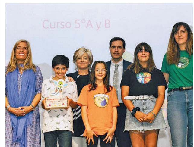
Alumnos, maestros y autoridades posan con el premio

Este colectivo se define como "una asociación cultural sin ánimo de lucro y sin ocupación de cuestiones políticas, que tiene como fines primordiales la promoción y defensa del Patrimonio material e inmaterial de Colmenar Viejo y su Comarca y zonas de influencia, así como la promoción de la cultura, historia, arqueología, etc., en dicho ámbito, mediante publicaciones, actos y conferencias". Entre sus primeras medidas están la edición de dos revistas: 'Estudios de Historia y Patrimonio' y 'Cuadernos de Estudios'.