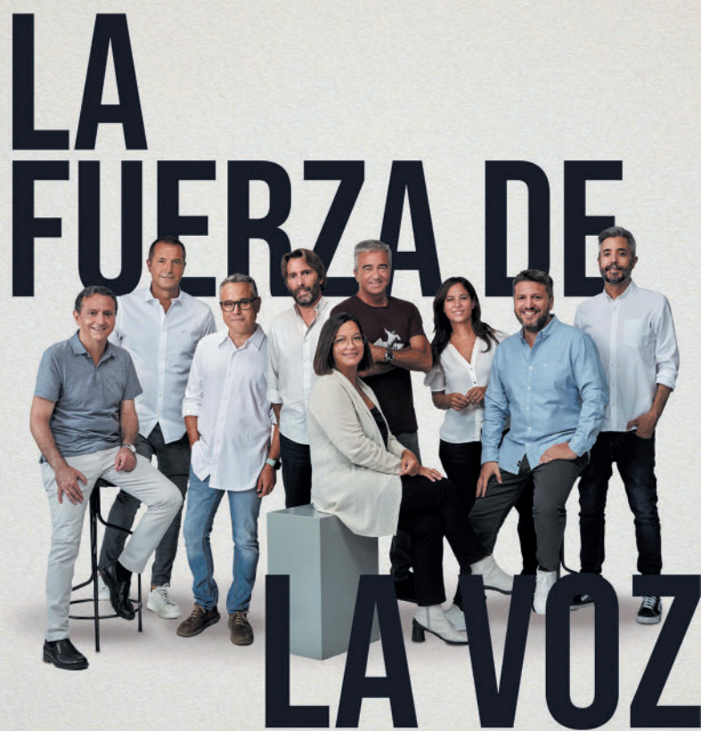
MANU CARREÑO ROBERTO SÁNCHEZ JAVIER DEL PINO JAVIER CASAL CARLES FRANCINO ÀNGELS BARCELÓ AIMAR BRETOS MARA TORRES DANI GARRIDO

La actualidad de Colmenar y Tres Cantos, en nuestra web.