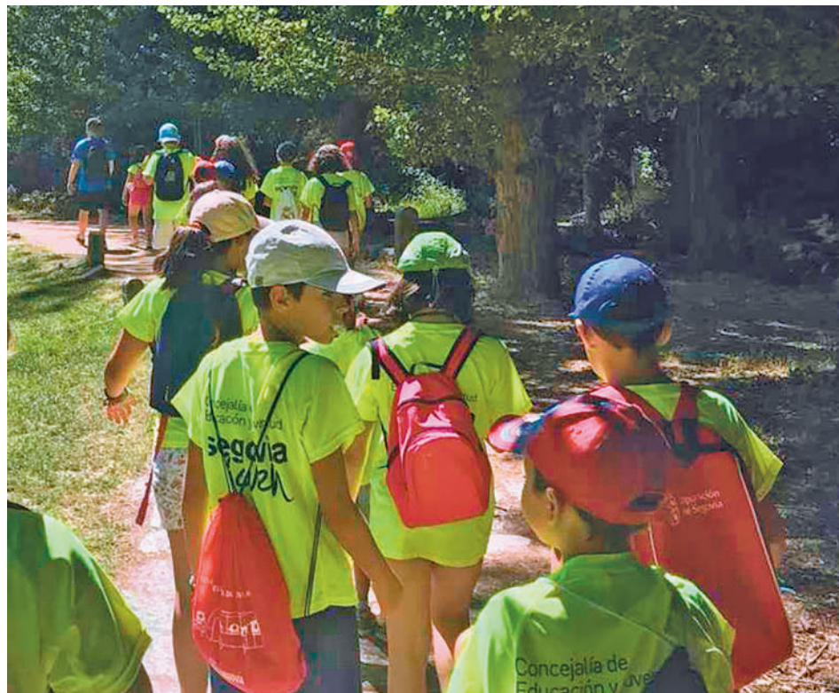
Una edición anterior de un Campamento de Aventura y Naturaleza

opciones, del 3 al 7 de julio y del 10 al 14 de julio). La natación, el tenis, el patinaje, el hockey o el fútbol sala forman parte de la variada programación de actividades deportivas, mientras que en el ámbito de los idiomas están el English Camp (de lunes a viernes durante julio), Summer Sport Camp y los cursos de inglés en Inglaterra y Escocia.