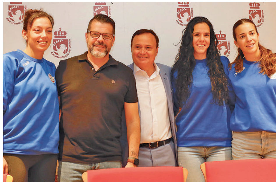
Jugadoras de voleibol junto con el concejal de deportes y el alcalde AYTO. COSLADA

Por otra parte, también se disputará la octava edición del Gran Premio Salchi-Villa de Coslada de ciclismo. Las carreras volverán a dilucidarse en el circuito urbano de la avenida del Esparragal y su confluencia con la avenida Manuel Azaña. La salida se dará a las 9 horas del domingo. Ese mismo día también se celebrará un torneo de ajedrez en el Centro Civico El Cerro desde las 10:30 horas.