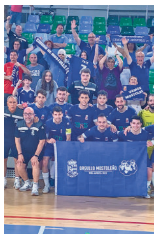
Celebración en Tenerife

El sorteo no ha sido demasiado benévolo con el Ciu-