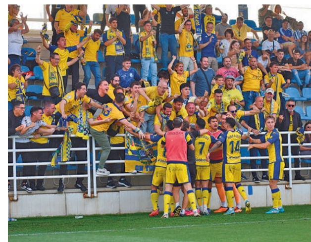
Celebración con los aficionados desplazados a San Sebastián

Por el otro lado de este cuadro caminan Deportivo y Castellón, con ventaja momentánea para los gallegos por 1-0.