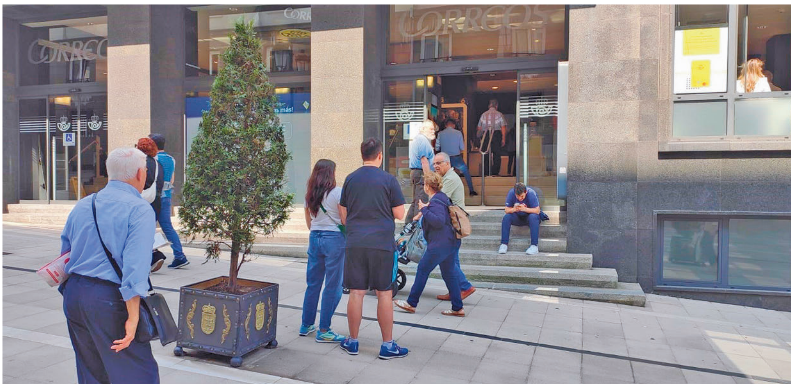
Las oficinas de Correos se han llenado en los últimos días