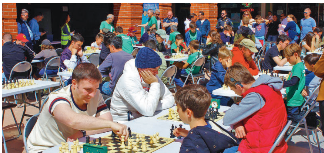
Campeonato de ajedrez en el Barrio del Puerto AYTO. COSLADA