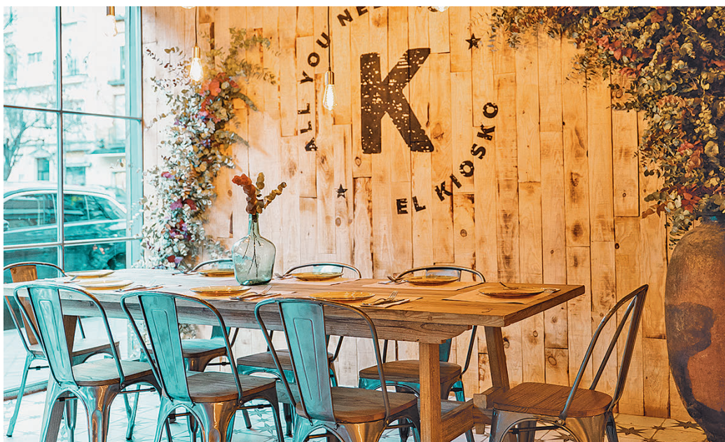
Imagen del interior del establecimiento de la calle Ponzano