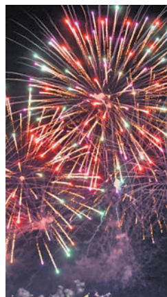
EL SÁBADO A MEDIA NOCHE SERÁ TURNO DE LOS FUEGOS

Tradiciones religiosas aparte, las fiestas más paganas siempre tienen como protagonista los conciertos. Este año habrá dos cabezas de cartel que actuarán en el campo de fútbol La Vía y la