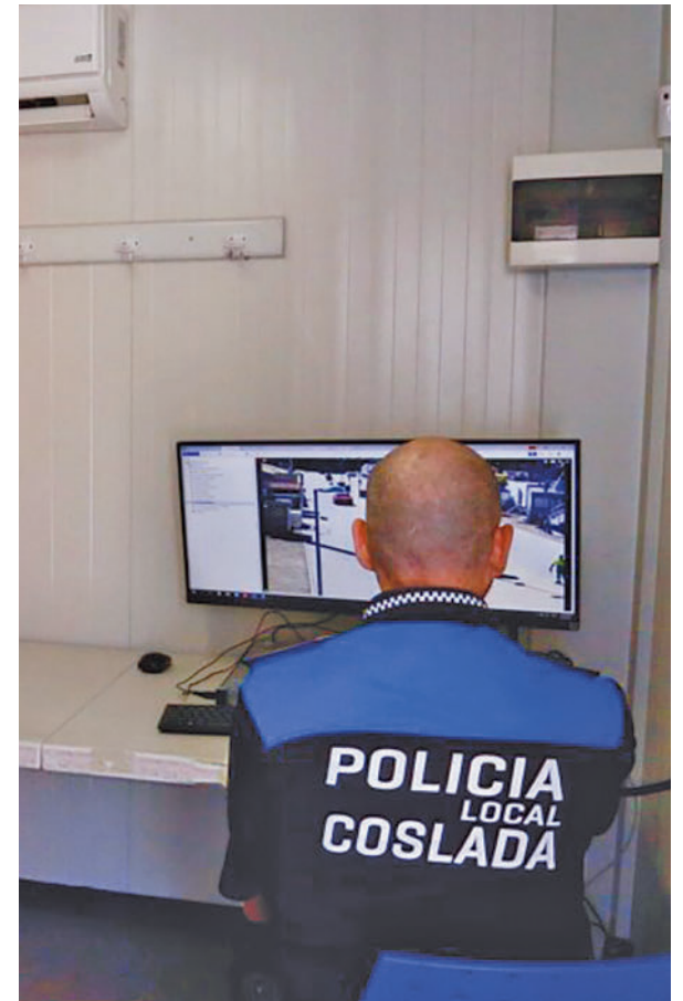
Cuarto de videovigilancia AYO.COSLADA

Según los datos de Policía Local, se espera una afluencia de hasta 25.000 personas el sábado desde las 22 horas y hasta bien entrada la madrugada, por lo