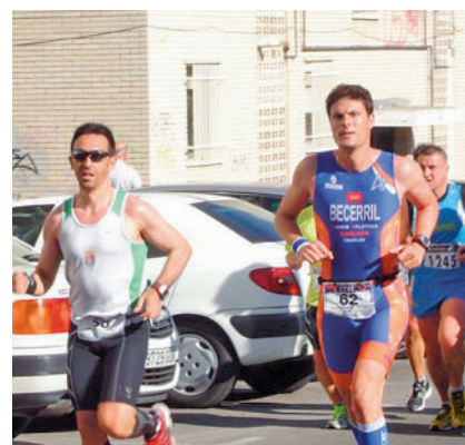
Carrera de fiestas CLUB DE ATLETISMO