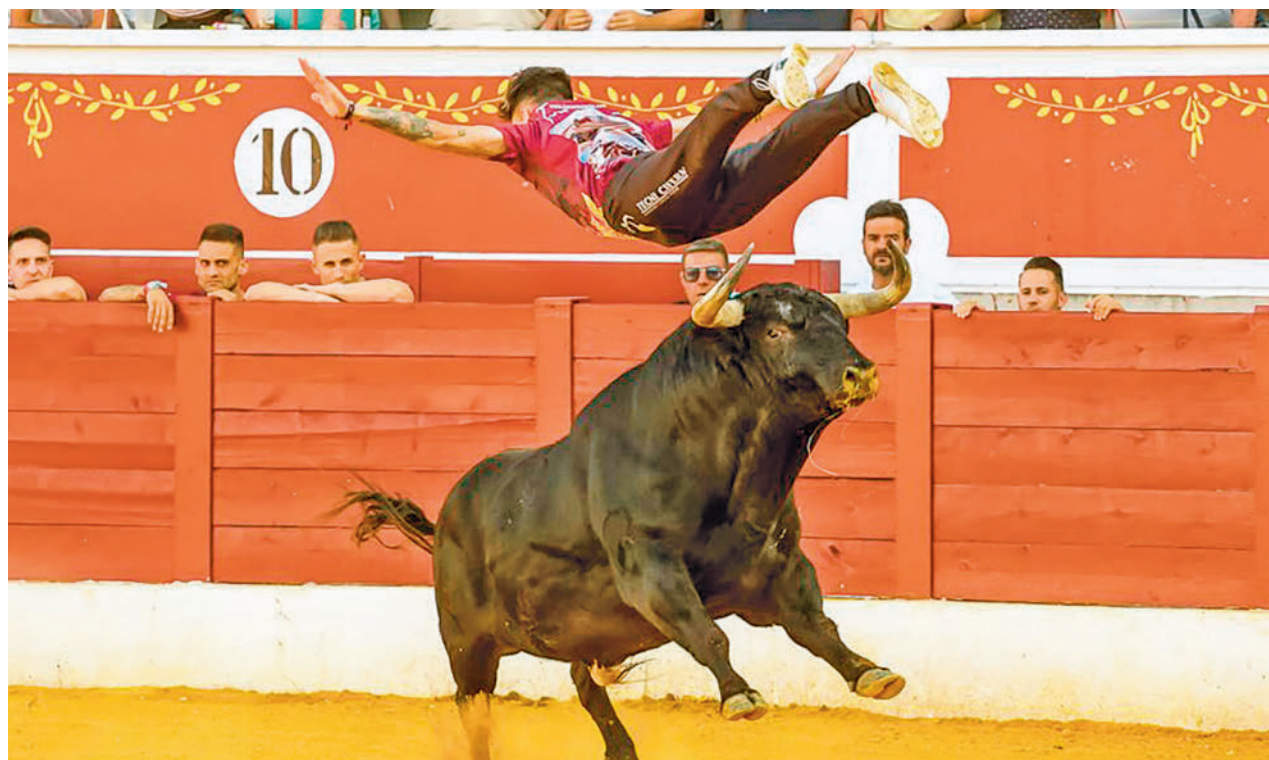
Un recortador saltando por encima de un astado durante el concurso de 2022 AYTO. TORREJÓN

Toda la información de su interés, en nuestra página web