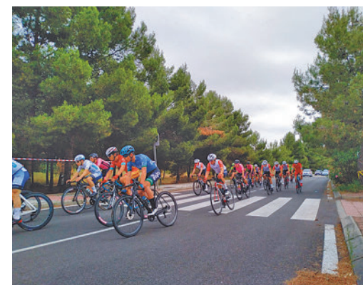
GP Ciclista de Coslada EOLO KOMETA

LA CARRERA NOCTURNA TENDRÁ UN RECORRIDO DE 4 KILOMETROS