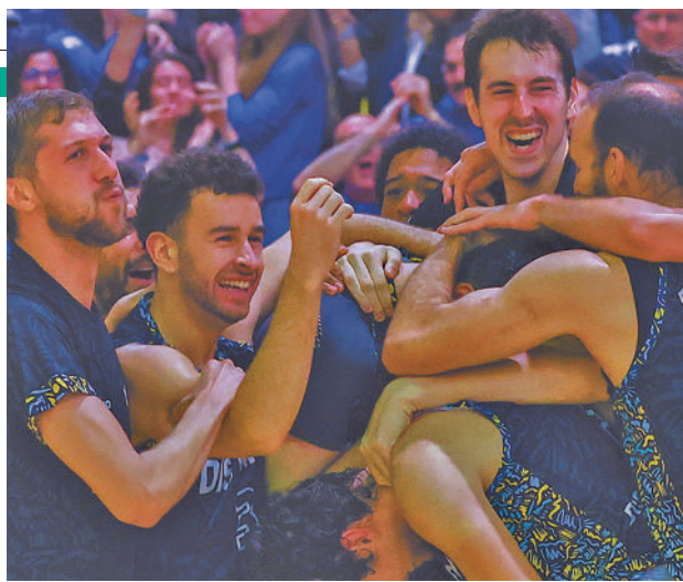
Hereda San Pablo Burgos ganó los dos primeros partidos

Este tramo final de temporada también dejó otra gran ale-