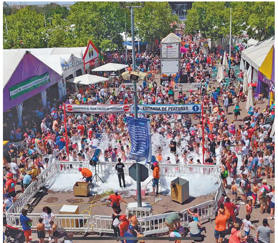
Fiesta de la espuma en el recinto ferial AYO. TORREJÓN

Por otro lado, son las peñas las encargadas de dar color a unos festejos continuos. La