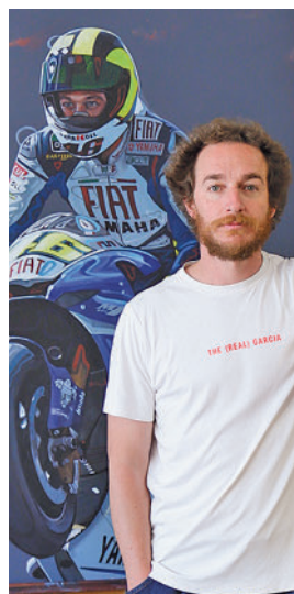
Otro de los cuadros

Ese talento, unido a la disciplina y a la empatía con el coleccionista le han colocado como una referencia internacional. Ya ha expuesto en Miami, Shangai o Lisboa.