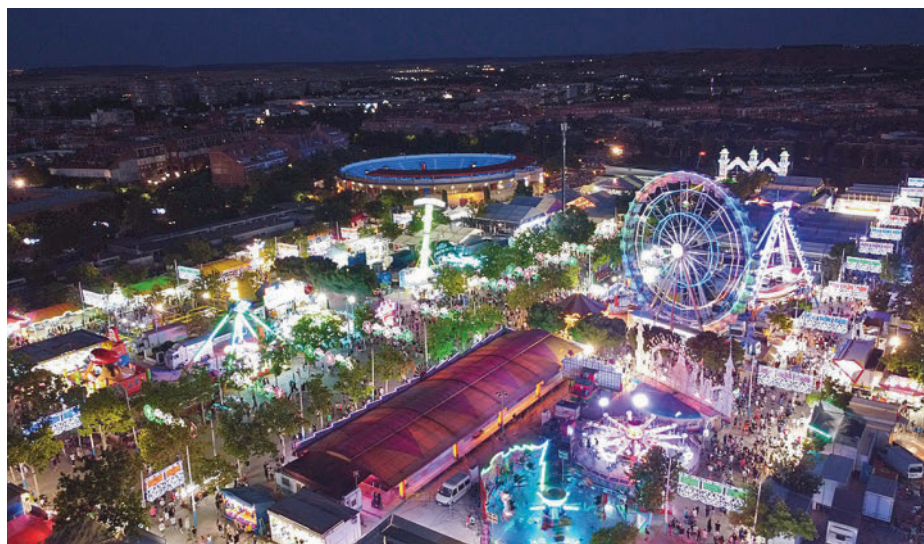
Vista aérea del recinto ferrial AYTO. TORREJÓN

En cuanto a seguridad, el Ayuntamiento ha dise-