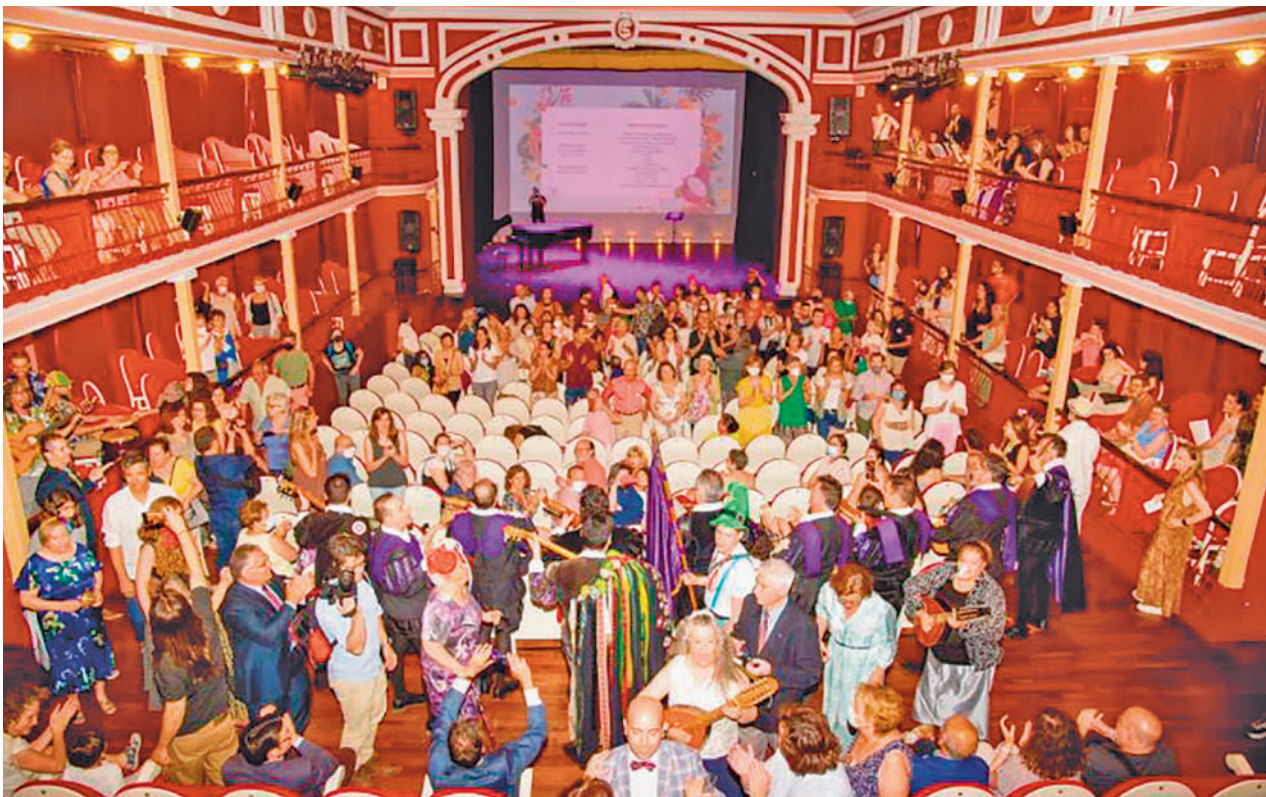
Patio de butacas del Teatro Salón Cervantes durante los Clásicos del año pasado AYTO. ALCALÁ