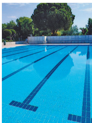
Pileta principal AYTO

vista que permanezcan en funcionamiento hasta el 31 de agosto. En concreto, el horario será de lunes a viernes de 11:30 a 19:30 horas, y sábados y domingos, entre las 11 y las 20 horas. Además habrá una bonificación del 50% en las tarifas de lunes a viernes a partir de las 16:30 horas, se-