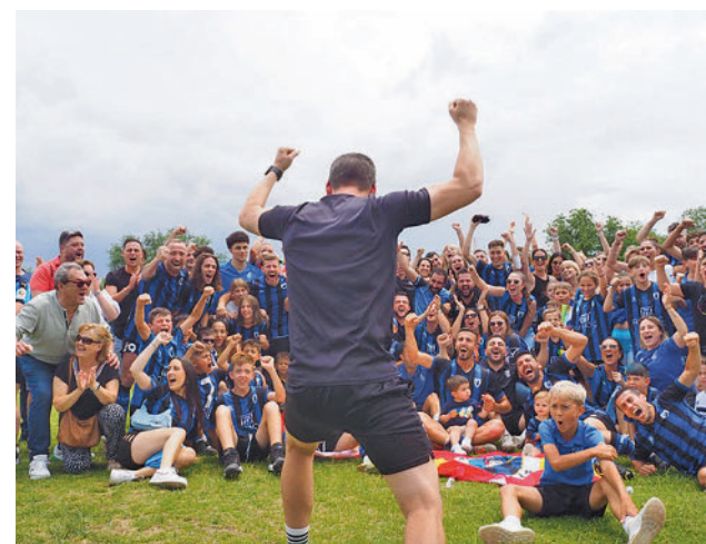
Un momento de la fiesta parleña

mento hasta los 18 equipos, podría dar un billete a otro equipo de Preferente, toda vez que el Getafe B ha subido a Segunda Federación. En ese caso, el Parla Escuela podría hacerse acreedor de esa plaza, ya que obtuvo más puntos que el tercero del Grupo 1 de Preferente, aunque también se podría repescar al último descendido, el Rayo B.