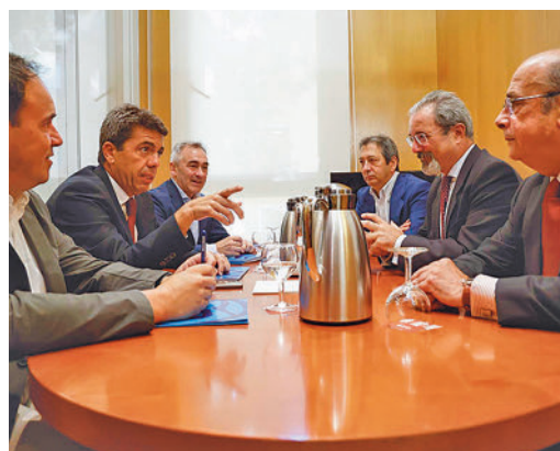
Negociación entre el PP y Vox en Valencia

EL PERIÓDICO GENTE NO SE RESPONSABILIZA NI SE IDENTIFICA CON LAS OPINIONES QUE SUS LECTORES Y COLABORADORES EXPONGAN EN SUS CARTAS Y ARTÍCULOS