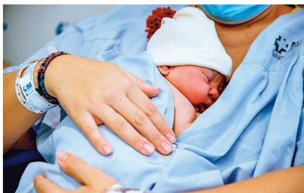
En Madrid han nacido más bebés

El dato es todavía más positivo si se tiene en cuenta que Madrid fue, junto con Aragón, la única región que experimentó un crecimiento en este periodo. En el conjunto del país los nacimientos cayeron un 1,75% con respecto al mismo mes del pasado año, con 25.141 nacidos el