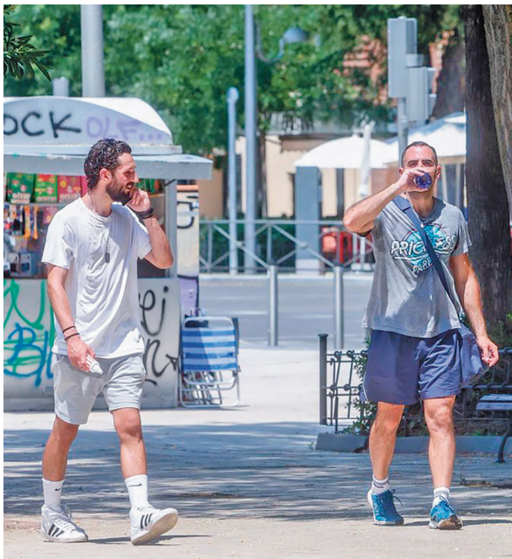
El verano comienza la semana que viene

Por lo que se refiere a las precipitaciones, la primavera fue “muy seca”, con sólo un 61% de lo que cae habitualmente en la Comunidad de Madrid, concretamente 90,4 litros por metro cuadrado, un registro “muy bajo” compara-