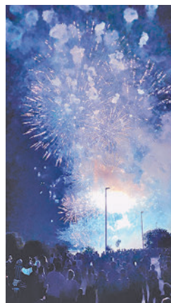
LA NOCHE DEL FUEGO PONDRÁ EL BROCHE A LAS FIESTAS

CAMELA ACTUARÁ EL DOMINGO EN EL RECINTO FERIA