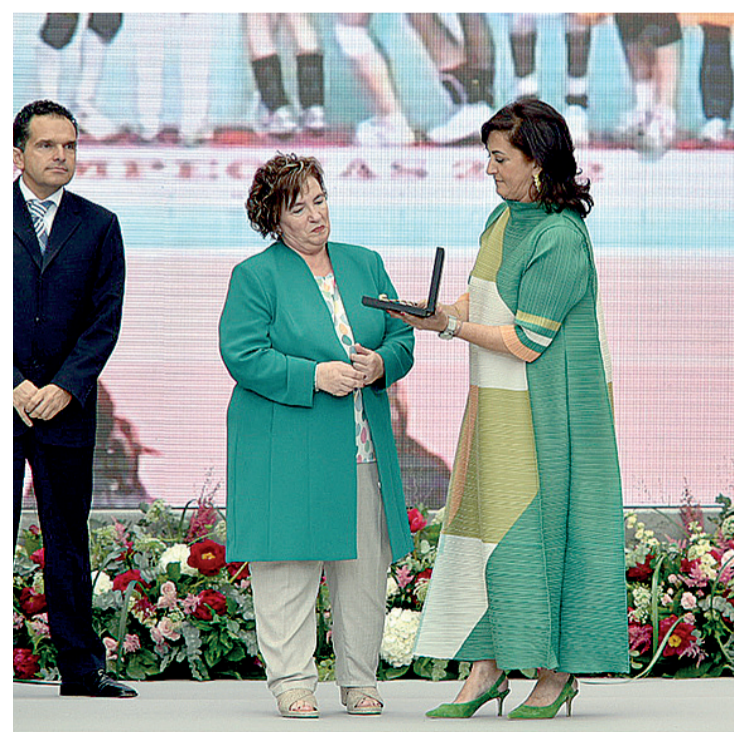
El Haro Rioja Vóley, Medalla de La Rioja.