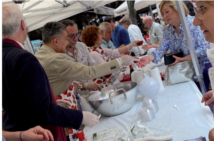
Alcalde saliente y entrante, en el reparto de las fresas con vino.

El alcalde electo confirmó que para su legislatura recuperará la figura de los concejales de distrito y potenciará la actividad del Consejo Social. En cuanto a la configuración de su equipo de gobierno, lo comunicará tras la toma de posesión: “Contamos con un grupo muy