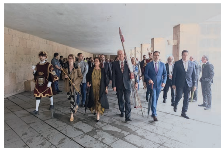
Llamada a Concejo en el Ayuntamiento.