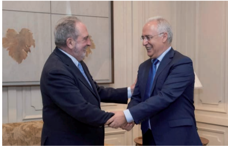
Los expresidentes riojanos Espert y Ceniceros.

Tras las elecciones autonómicas y municipales de 1987, Espert pasó a dirigir el Gobierno riojano en minoría, después de un acuerdo con el Partido Riojano y el CDS. Sin embargo, a finales de 1989, el PSOE, que había ganado los comicios, desbancó al dirigente popular de la presidencia con una moción de censura que apoyaron los regionalistas y dos diputados del CDS.