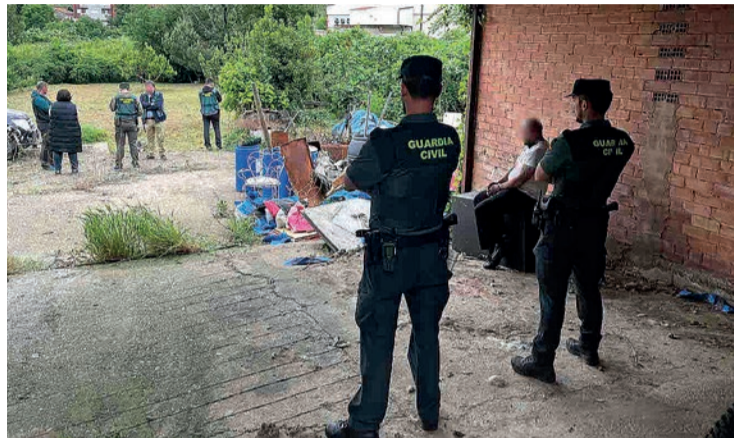
La Guardia Civil, con el acusado, Ó. P. R., en la investigación en su casa.

El primero de los pases arrancará el lunes a las nueve de la mañana con el testimonio del presunto asesino de Ovejas, natural de Cornago, tras el cual empezará la prueba testifical. Este jueves 15 se constituyó el tribunal del jurado, que quedó conformado por cinco hombres y cuatro mujeres, con edades entre