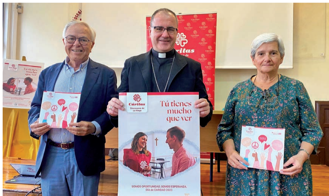
La presentación de la memoria del curso 2022 de Cáritas.

A través de sus 50 grupos parroquiales, el pilar fundamental de los cuidados de Cáritas, en 2022 se atendió a 2.366 personas. “Si comparamos estos datos con los del año 2019, cuando todavía no había comenzado la pandemia y en el que atendimos a 2.398 personas, concluimos que estamos tocando la misma pobreza estructural, pero las necesidades económicas de las personas hoy en día son mayores y exigen un mayor esfuerzo por parte de la en-