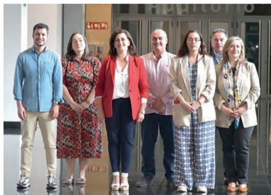
El PSOE renueva sus listas para el Senado y el Congreso.