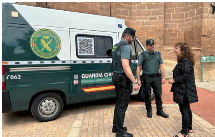
El puesto móvil de atención de la Guardia Civil.