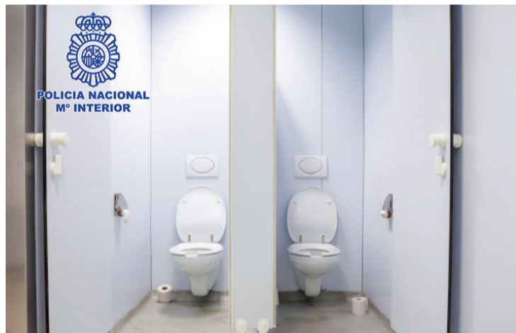
Los baños en los que grabó el detenido.

SEGURIDAD | Operativo de la Policía Nacional