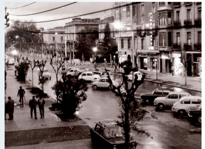
El Logroño de los años 70.

podía circular, que lo hacía todo el mundo. Ahora veo que han suprimido semáforos en varias arterias principales de la ciudad: Espolón, Murrieta... en fin, que no lo entiendo. Creo que, con mucho tráfico, o los semáforos o las rotondas reparten muy bien el tráfico. Las holandesas no, pues estás mirando a ver si no atropellas al de la bici, al peatón o le cascás un golpe al coche que te viene por tu izquierda. No sé qué pasará al final, si la nueva Corporación municipal podrá arreglar algo del desaguisado de las ‘Calles abiertas’. Lo más probable que todo no, pero yo me conformo con los entretos principales, que los hay. Y a ver si al final urbanizan mi calle, Avenida de la Sierra, que llevo 23 años esperando.