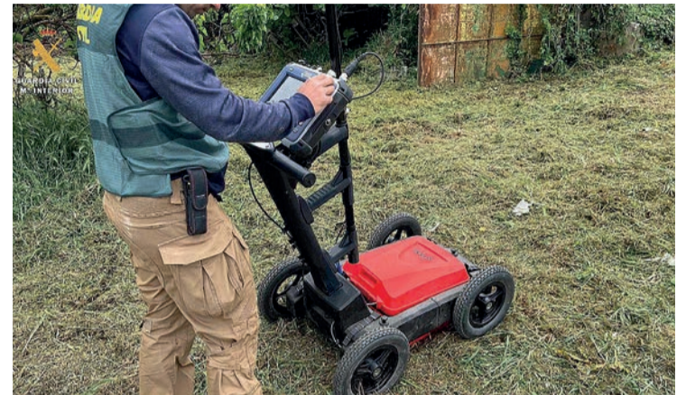
La búsqueda con georadar.

El relato de la Fiscalía continúa afirmando que, una vez que la víctima estuvo en el inmueble del inculcado, Ó. P. R. le causó la muerte por "sorpresa y con ventaja", disparándole varias veces. Añade