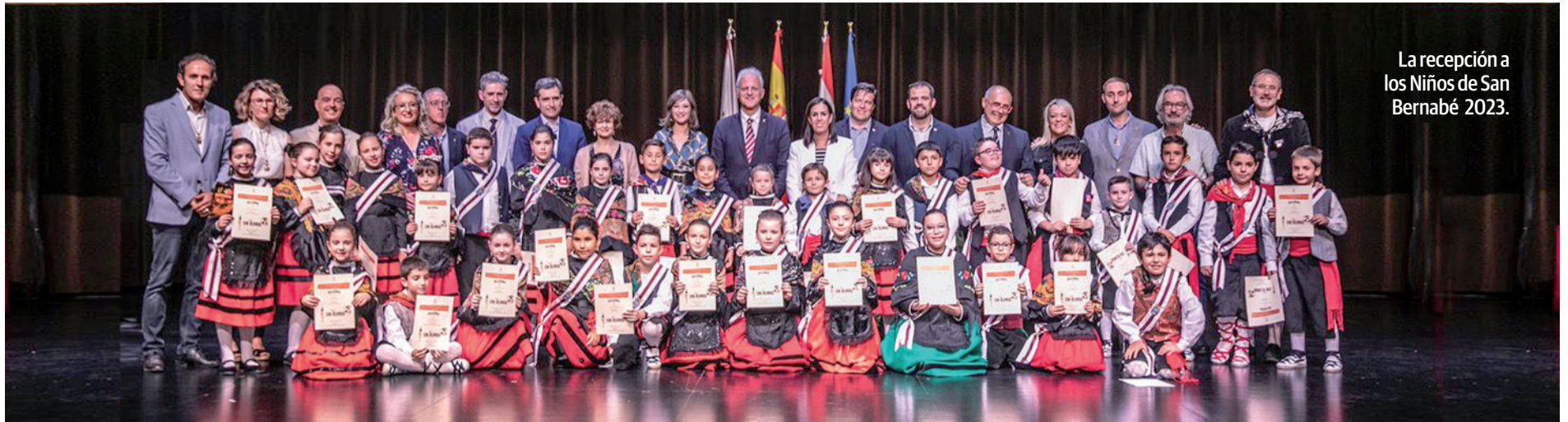
La recepción a los Niños de San Bernabé 2023.