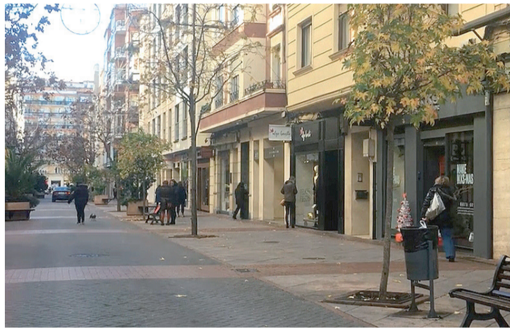
Los comercios de las Cien Tiendas de Logroño.

Respecto a hace un año, los precios descendieron, de forma especial, en el grupo de vivienda,