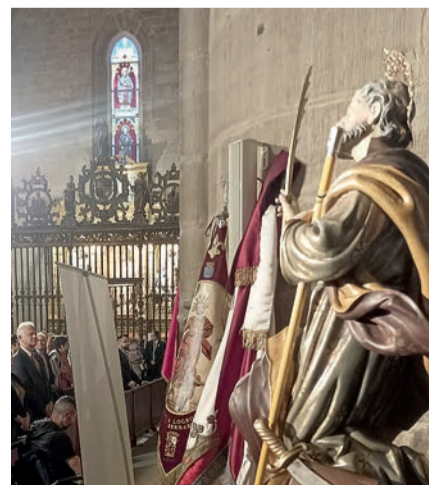
Misa en honor a San Bernabé en La Redonda.