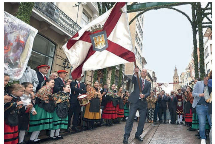
El primer banderazo de Hermoso, bajo el Arco de San Bernabé.