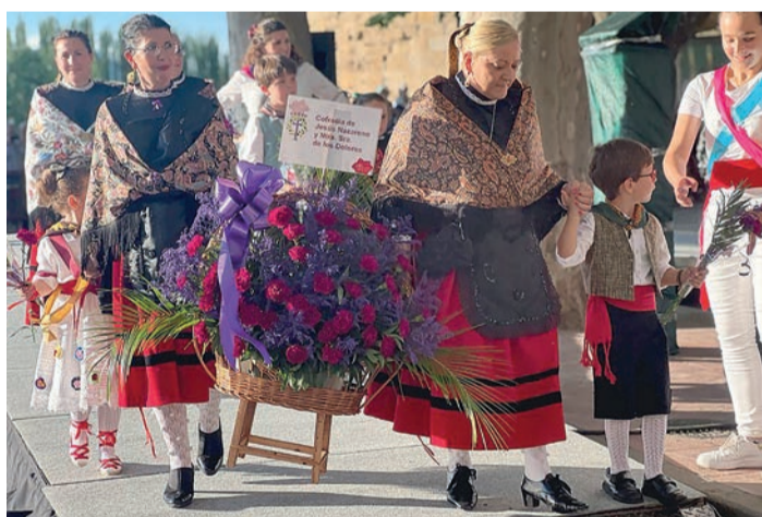
Ofrenda floral a San Bernabé.