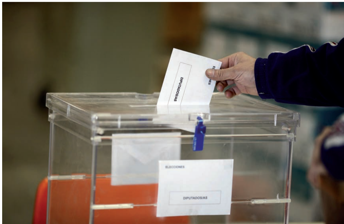
Urna de votación en las elecciones generales.

Para los que el próximo 23 de julio no se encuentren en su domicilio habitual, se podrá solicitar el voto por correo hasta el 13 de julio, ex-