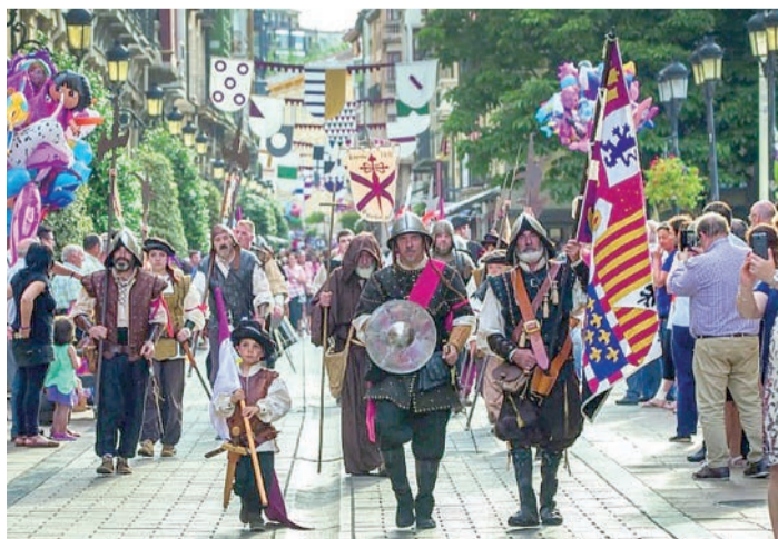
Desfile de la milicia logroñesa.