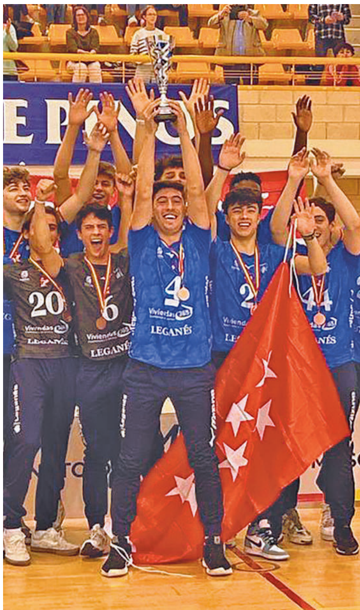
El Junior masculino terminó en tercera posición

notable llegaba de la mano del Cadete A masculino, que se colgaba la medalla de plata en Castellón gracias a una trayectoria sólida que comenzó a cimentarse en los triunfos logrados en el Grupo F. Ya en la siguiente ronda, CV Valencia Zeus y Wefferent Mintonette comprobaron el poderío de los jóvenes leganenses, quienes sumaban dos nuevas victorias que les colocaban en semifinales. Ahí les esperaba el CV Mediterráneo, un rival que apenas pudo