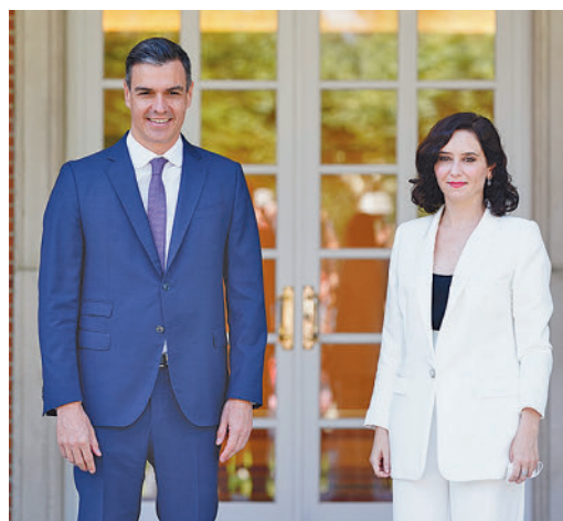
Imagen de archivo de Sánchez y Díaz Ayuso

EL PERIÓDICO GENTE NO SE RESPONSABILIZA NI SE IDENTIFICA CON LAS OPINIONES QUE SUS LECTORES Y COLABORADORES EXPONGAN EN SUS CARTAS Y ARTÍCULOS