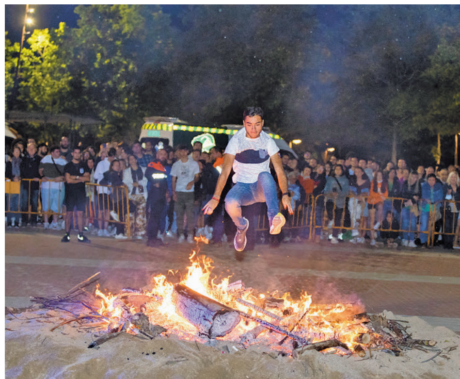
Un joven saltando la hoguera en la edición de 2022

LA HOGUERA ACAPARARÁ LA ATENCIÓN EN LA NOCHE DE ESTE VIERNES 23