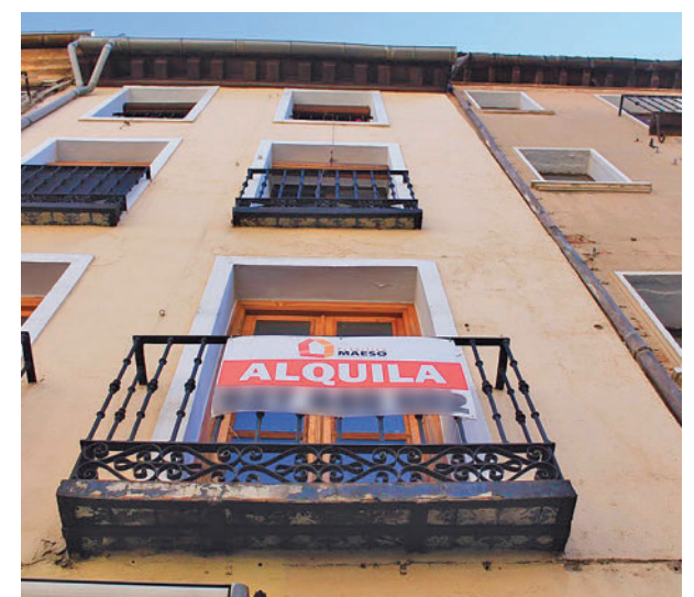
Viviendas en alquiler

“La particularidad de esta nueva legislación es