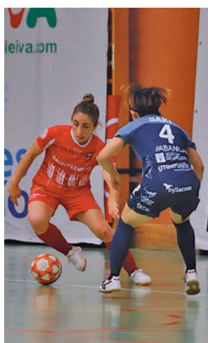
Derrota en el primer partido

off' por el título. El Pescados Rubén Burela volvió a demostrar su capacidad competitiva para llevarse la victoria de tierras madrileñas, gracias a