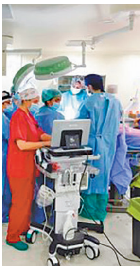
Intervención quirúrgica E.P.

en un modelo animal. El siguiente paso es conseguir una supervivencia de entre tres y cuatro semanas. En esta segunda fase, que tendrá una financiación de 4,3 millones de euros por parte de la Fundación La Caixa, quie-