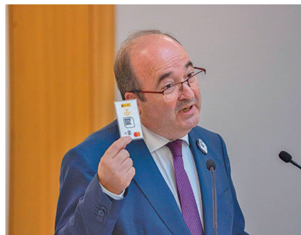
El ministro de Cultura, Miquel Iceta, con el Bono Cultural

A partir de la concesión de la ayuda, las personas beneficiarias disponen de un año para utilizar los 400 euros en productos o servicios culturales en los establecimientos