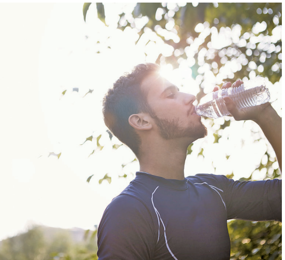
Debemos de disponer siempre de agua a mano