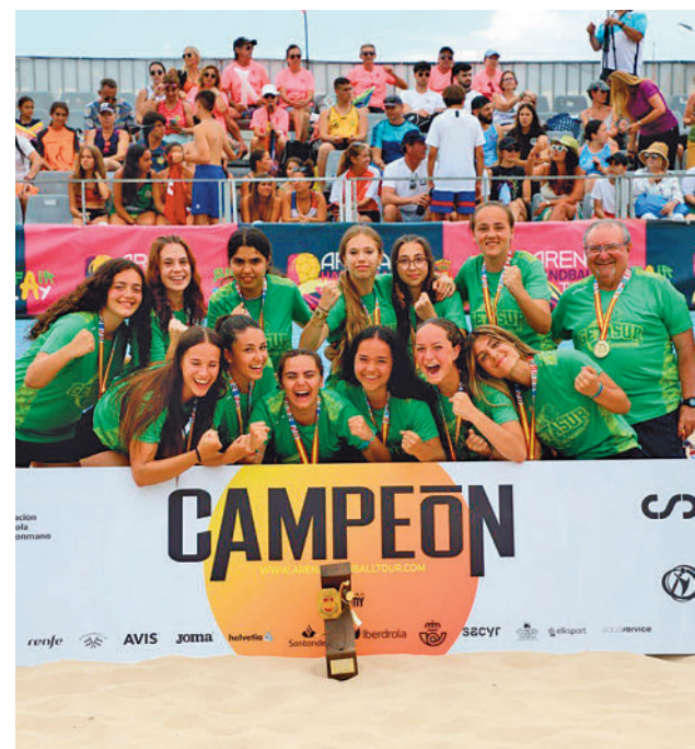
Las jugadoras celebrando el título