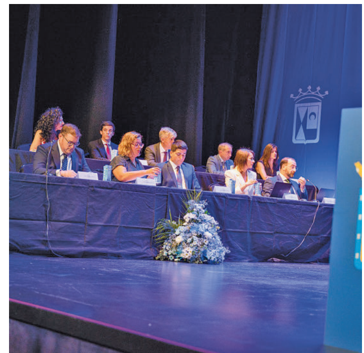
Bancada popular en Colmenar Viejo

Por su parte, Carlos Blázquez fue investido alcalde de Colmenar Viejo después de pactar con Vox, toda vez que los resultados electorales le dejaron a un solo concejal de la mayoría absoluta. En su discurso de investidura, el nuevo regidor colmenareño afirmó que "consideramos que es fundamental el asegurar un gobierno sólido y estable para poder seguir transformando Colmenar Viejo con