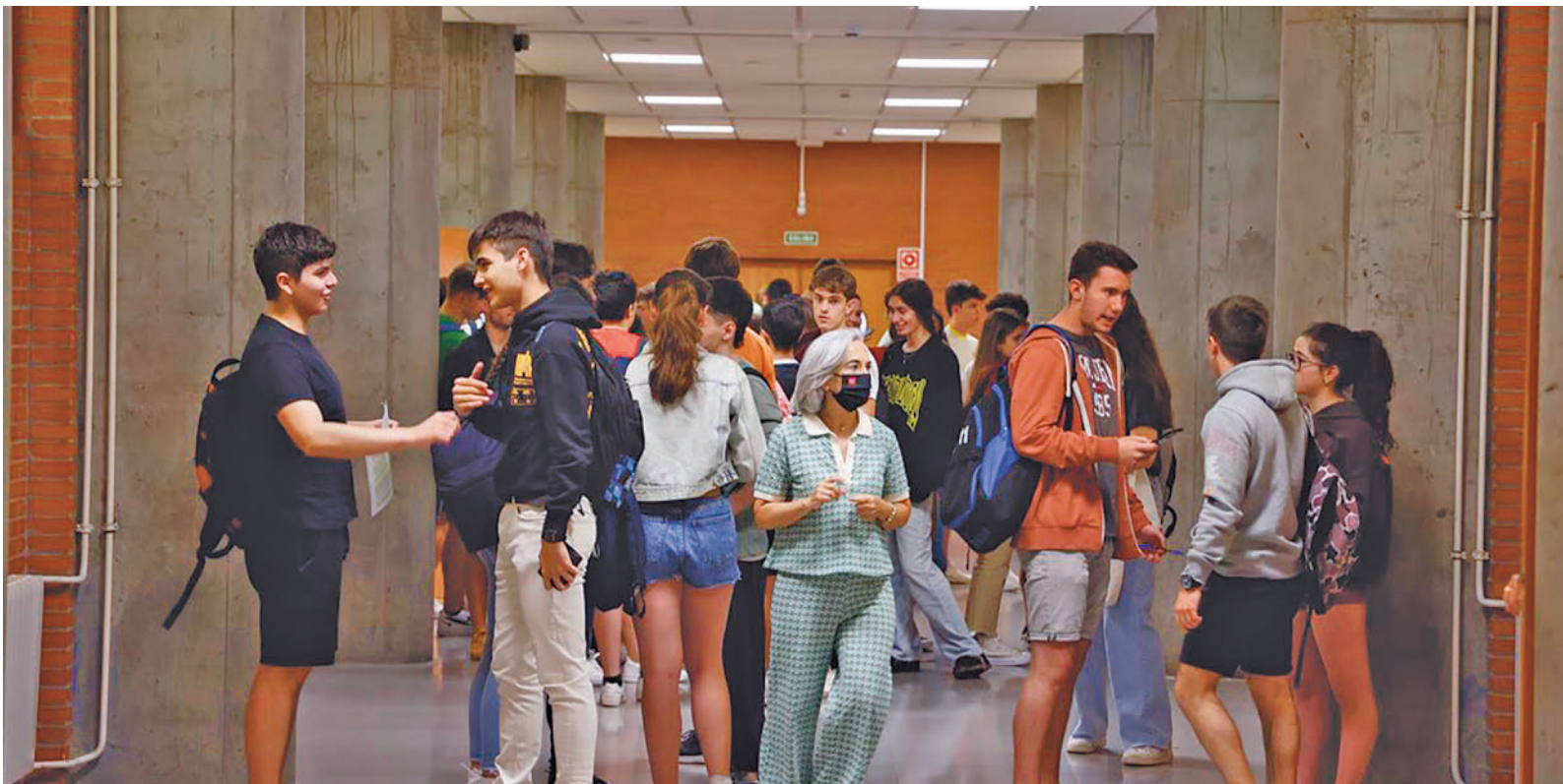
Las grandes ciudades son el destino favorito de los que salen de su región para estudiar