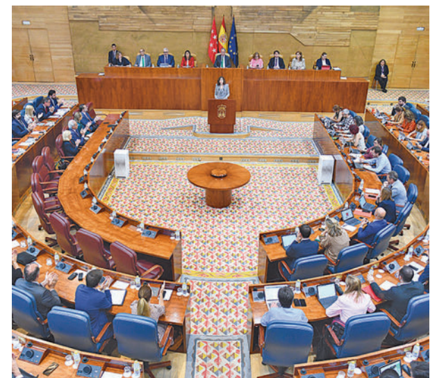
Asamblea de Madrid