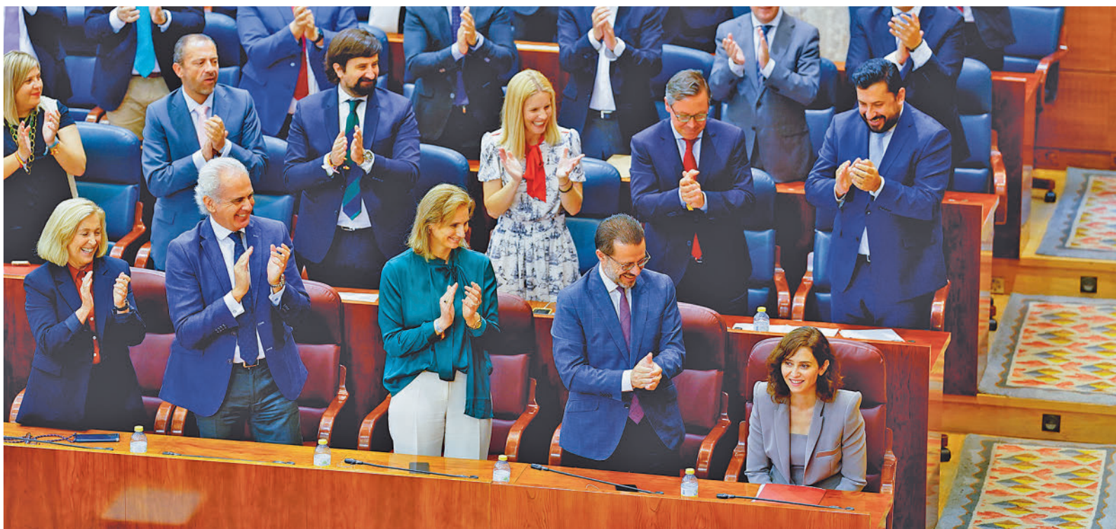
Los diputados del Partido Popular aplauden la intervención de Isabel Díaz Ayuso

Ayuso pidió a los ayuntamientos bajar al mínimo el impuesto por las plusvalías, algo que será obligatorio en las ciudades con alcalde del Partido Popular.