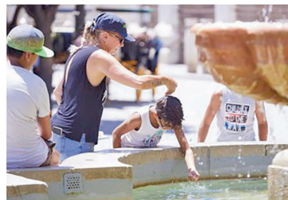
Europa se calienta cada vez más rápido

Así lo asegura el informe 'Estado del Clima en Europa en 2022', elaborado por la Organiza-