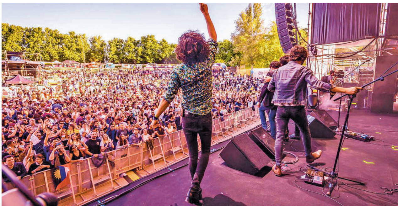
Una de las actuaciones de la pasada edición

» Sábado 24, 23 horas. Escenario Principal. Gratis