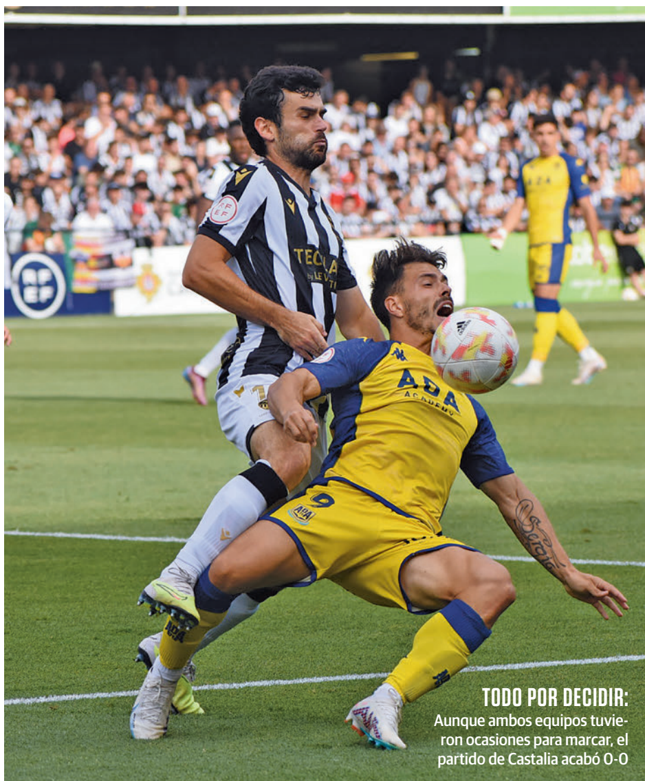
TODO POR DECIDIR: Aunque ambos equipos tuvieron ocasiones para marcar, el partido de Castalia acabó 0-0

Con todo, los alfareros no se fían de estas circunstancias