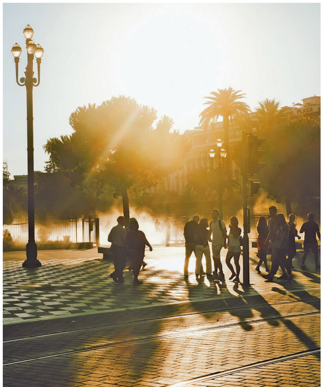
Las ciudades sufren más las olas de calor extremos

en zonas urbanas para la población general y permitir la continuación de la actividad en un entorno seguro. Arup recomienda potenciar las zonas verdes y restaurar las áreas fluviales con el objetivo de crear refugios climáticos, como plazas con fuentes o parques en el río.