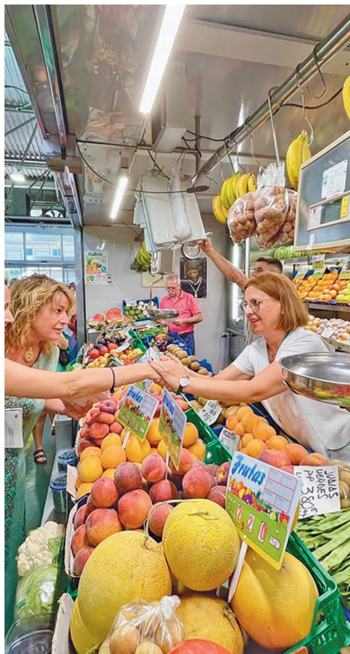
Los precios están moderando su subida

Frente a los alimentos, que lideraron las subidas interanuales de precios, lo que más se abarató en el sexto mes del año en relación a junio de 2022 fue el transporte combinado de pasajeros (-47,7%); la electricidad