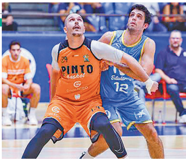
Imagen de un partido de la pasada edición FBM

EBA. En esta ocasión serán 13 de los 14 conjuntos integrados en esa competición, después de que el CB Majadahonda declinara la invitación de la FBM. Este contratiempo ha dejado un poco cojo uno de los cuatro grupos, el C, que contará sólo con dos equipos, el Uros de Rivas y el CB Zentro, quienes se jugarán el pase a la siguiente ronda en un único partido, el que tendrá lugar este domingo 10 de septiembre (17 horas) en el Cerro del Telégra-