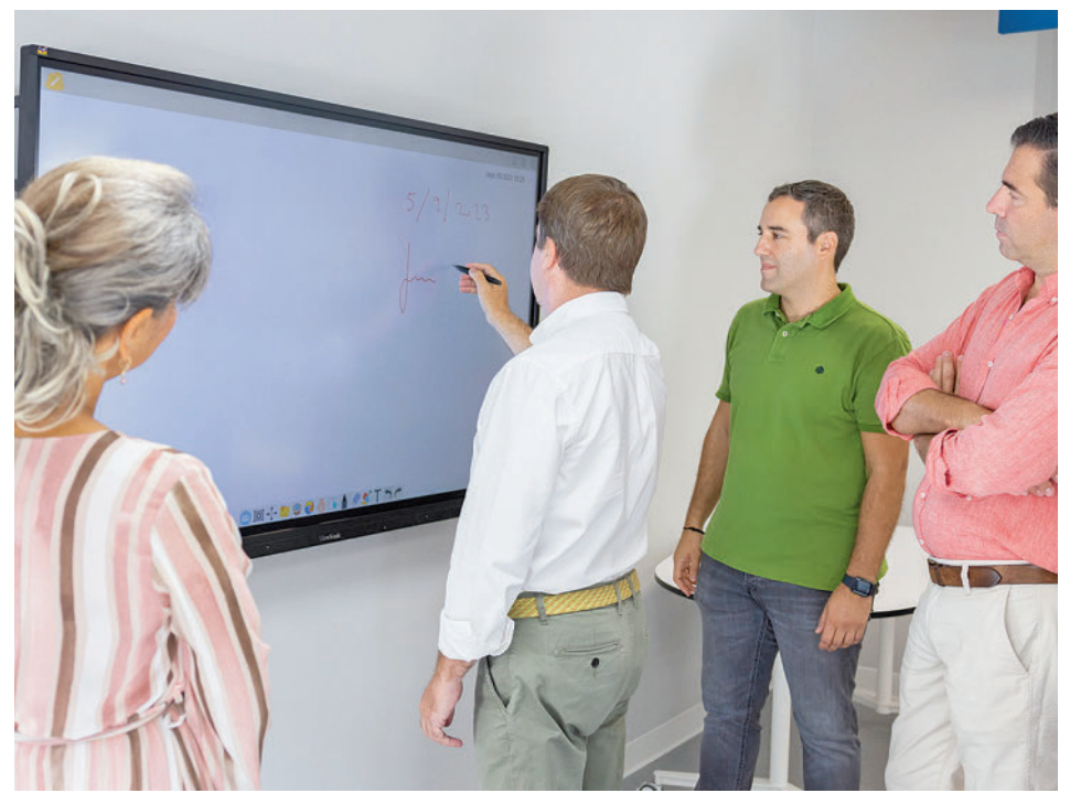
Visita institucional a las nuevas aulas del CPB Ciudad de Columbia