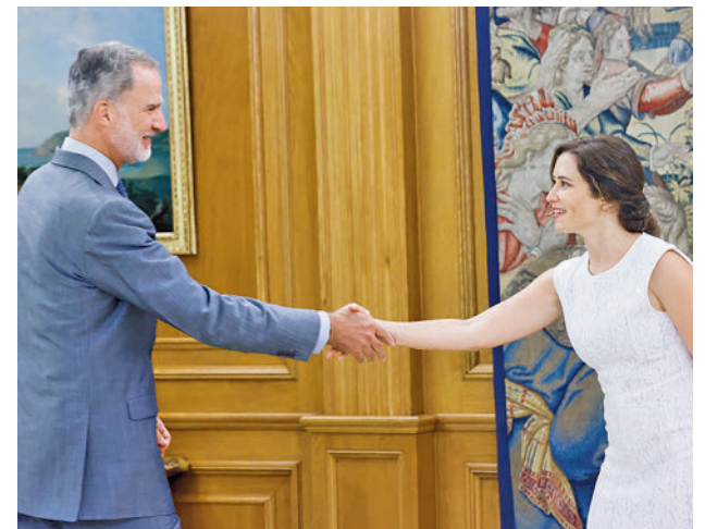
Felipe VI e Isabel Díaz Ayuso

Esta ha sido la tercera vez que Ayuso ha acudido a Zarzuela para un encuentro de este tipo. Ya estuvo tras las elecciones de 2019 y después de las de 2021.