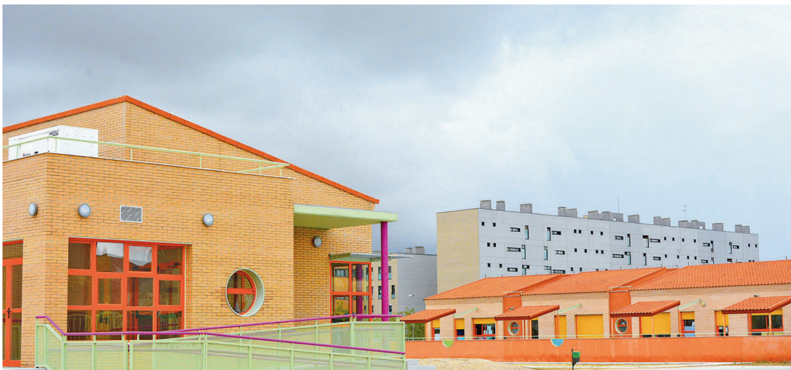
Un colegio público de Alcorcón