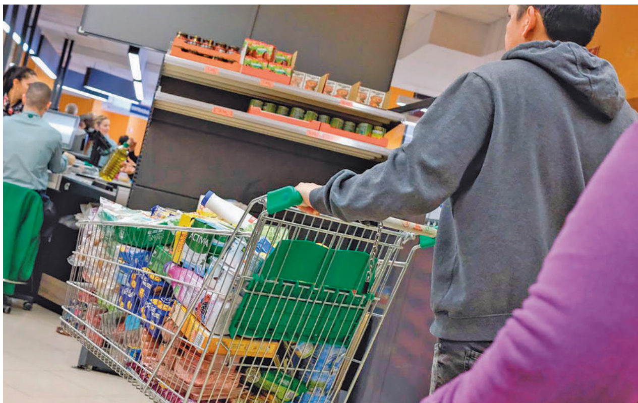
Los supermercados cuentan con sus propias líneas de productos

Fenómenos como la inflación general y el aumento del precio de la cesta de la compra en concreto tienen mucho que ver en este comportamiento. "La inflación ha generado una subida de precios, no solo para las marcas de fabricante (comerciales), sino también para las marcas blancas. Es evidente que en un contexto en el que esas marcas son más baratas, el precio final será, también, menor que el de las marcas de fabricante", explica Juan Carlos Gázquez Abad, profesor colaborador de los Estudios de Economía y Empresa de la Universitat Oberta de Catalunya (UOC). "Es posible que, en ese sentido, haya consumidores que hayan visto como el precio de sus marcas nacionales 'de toda la vida' se ha disparado hasta un punto que