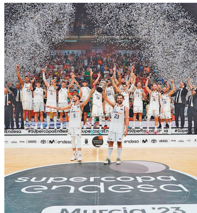
Los blancos conquistaron una nueva Supercopa