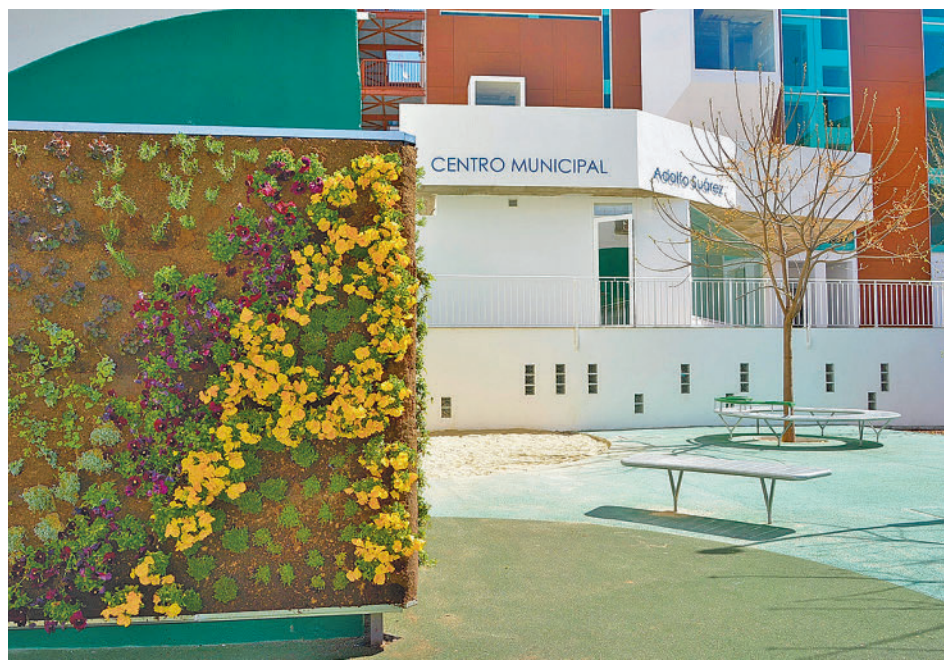
Centro Municipal de Mayores Adolfo Suárez