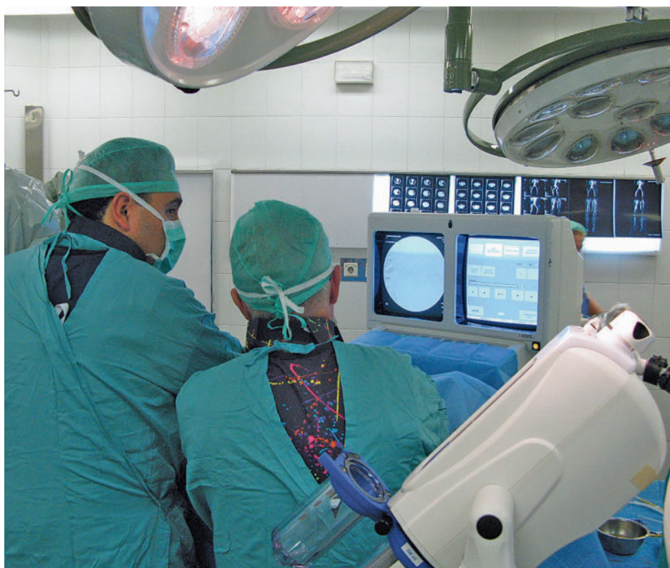
Intervención quirúrgica en la sanidad madrileña

En el mes de agosto, marcado por la época estival y las vacaciones, también creció respecto a julio la lista de espera para consultas externas, tanto en número de personas como en tiempo de demora media, y la lista para pruebas diagnósticas. En concreto, la primera acumulaba un total de 658.714 pacientes en espera estructural para primera consulta, con un aumento