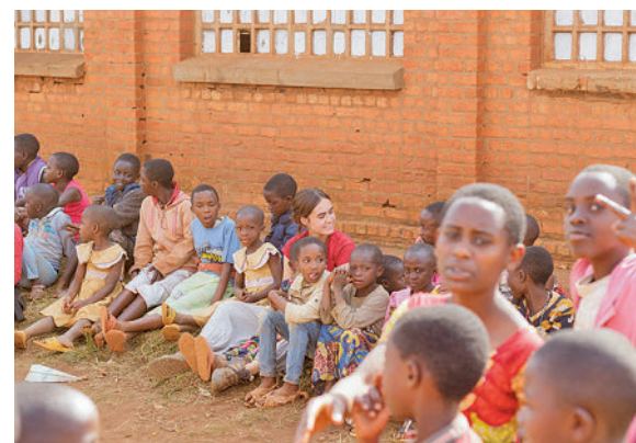
Voluntariado en África

comunes para hacer una aportación. Estas son algunas de las principales conclusiones del estudio '¿Cómo es el compromiso social con las ONG en España?' realizado por Rebold, compañía de marketing y comunicación, en el que aborda