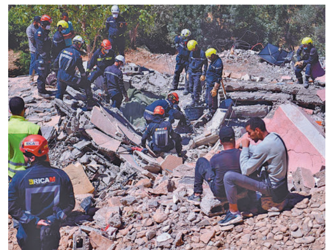
Efectivo madrileños trabajando en marruecos

Además, un equipo de diez personas, formado por ocho bomberos y dos sanitarios del SUMMA112, se desplazó a pie a la zona remota de Ankdzame, donde no había acceso por carretera. Allí atendieron a nueve personas y trasladaron hasta su campamento a tres personas en camilla y a una niña de tres años que fue llevada sobre la espalda de un miembro del equipo.