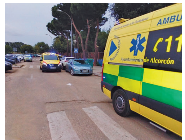
Una ambulancia del 112 PROTECCIÓN CIVIL

La Audiencia Provincial de Madrid ha condenado a once personas por su relación con una trama que fabricaba y proporcionaba permisos temporales de conducir falsos. Las penas van del mes y medio a los 13 meses de prisión. La sentencia considera acreditado que durante los años 2013, 2014 y 2015 los dos principales acusados, aprovechando que uno de ellos era personal laboral en la Jefatura de Tráfico de Alcorcón, se dedicaron a proporcionar a cambio de dinero diversos permisos temporales de conducir elaborados en papel y sellados por la oficina expendedora, bien por la Jefatura Provincial o por otra oficina local de tráfico. Los acusados beneficiarios carecían de permiso de conducir o bien habían sido privados del carné por pérdida de puntos.