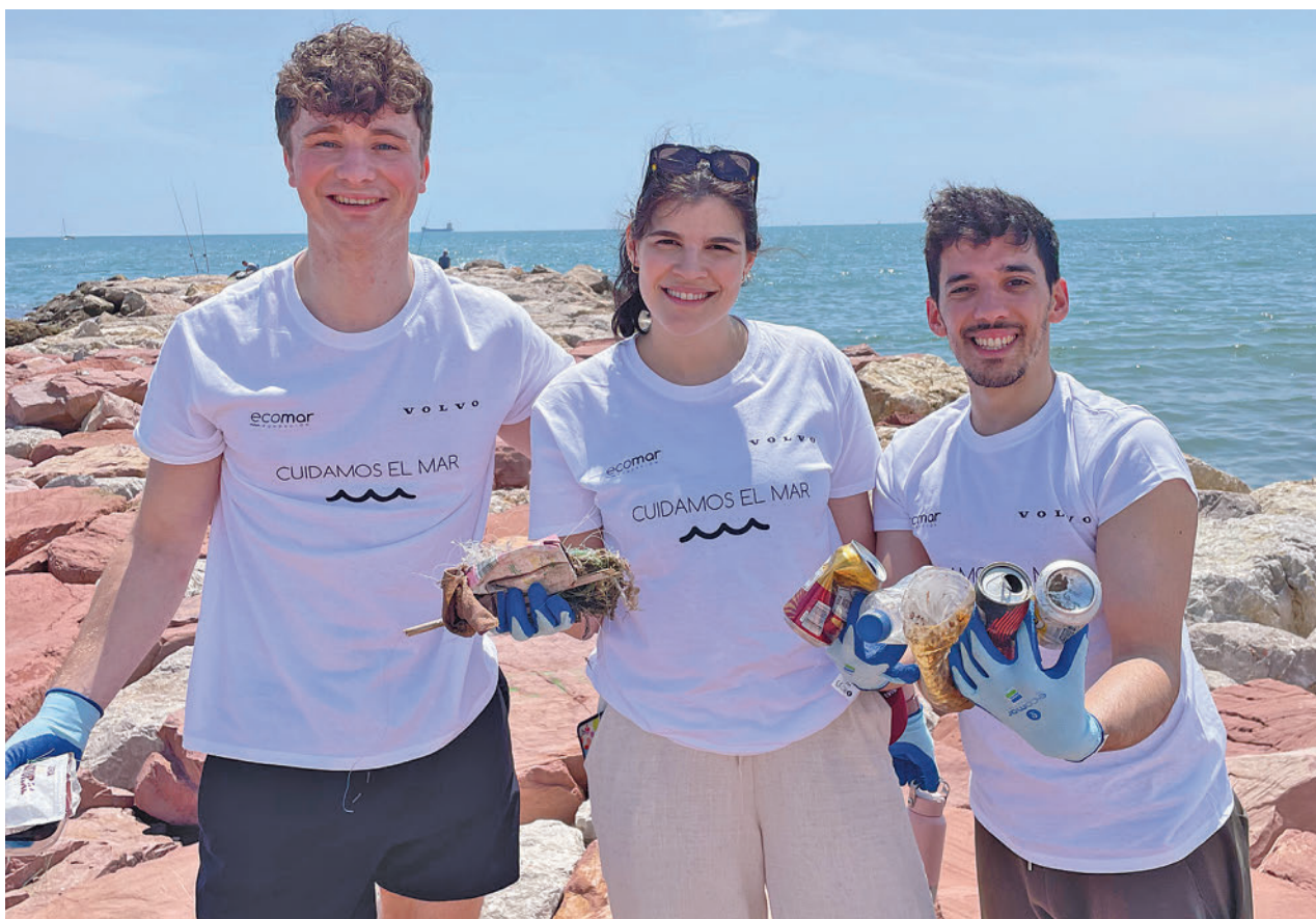
Jóvenes implicados en la realización de tareas de voluntariado