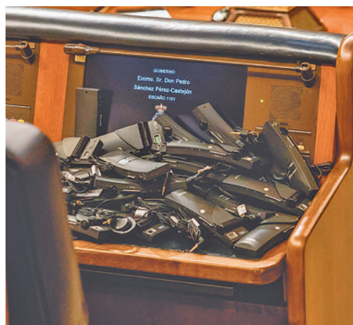
Aparatos de traducción en el escaño de Sánchez

EL PERIÓDICO GENTE NO SE RESPONSABILIZA NI SE IDENTIFICA CON LAS OPINIONES QUE SUS LECTORES Y COLABORADORES EXPONGAN EN SUS CARTAS Y ARTÍCULOS