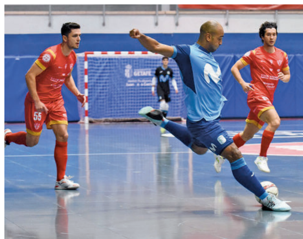
El Inter disputó un torneo amistoso en Getafe

Después de ese primer revés y de una semana de descanso en Liga por los compromisos de la selección en la fase de clasificación para el próximo Mundial, el Inter re-