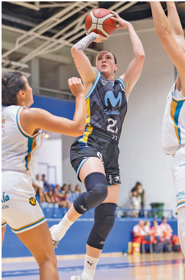
Estudiantes y Jairis ya se midieron en pretemporada: 83-76

Con ese buen sabor de boca, el equipo estudiantil arranca este domingo 24 (18 horas) su andadura en un nuevo curso. Lo hará, además, en un escenario, el