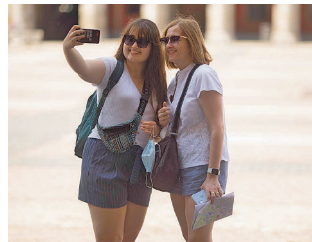
Turistas en Madrid

Se promocionarán Paisaje de la Luz de la capital, la Universidad y centro histórico de Alcalá de Henares, Monasterio y Real Sitio de San Lorenzo de El Escorial y Aranjuez.