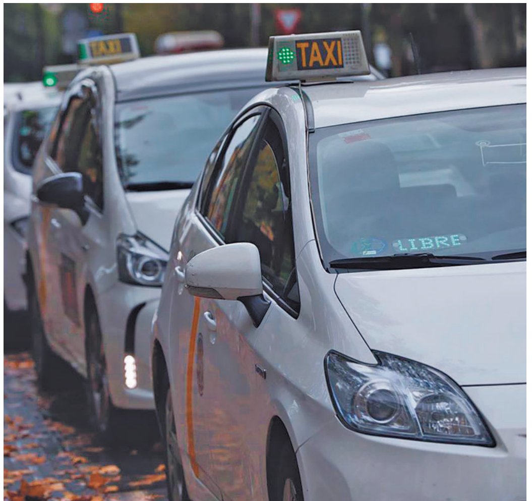
Los VTC y los taxis tendrán nuevas normativas

Antes de que finalice el presente año, el Gobierno regional también se pretende tener aprobado de forma definitiva el nuevo reglamento del taxi, que actualmente está en fase de estudio de alegaciones. La Comunidad de Madrid adelantó como líneas del nuevo texto la posibilidad de que estos profesionales tengan libertad horaria y trabajen todos los días y las horas que quieran. También se flexibilizaría la normativa facilitando la contratación de conducto-