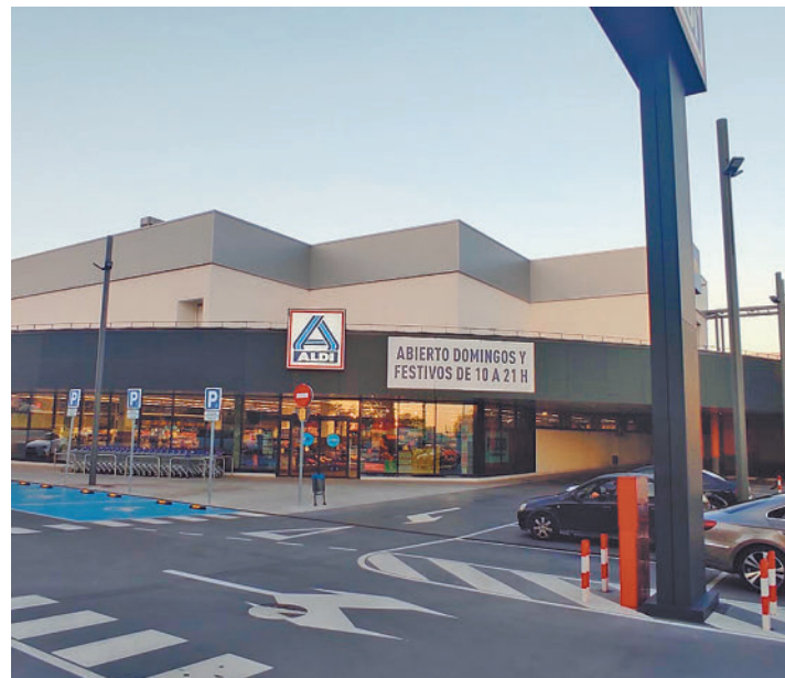
Supermercado de Alcorcón

Un menor con Trastorno del Espectro Autista que se dirigía a su centro escolar en Leganés terminó a las puertas de un supermercado en Alcorcón • Los hechos han sido denunciados