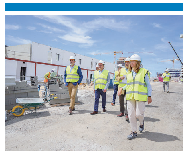
Visita institucional a las viviendas en Tres Cantos

Las estaciones de recarga gratuita para autoservicio que se encuentran ubicadas en la Avenida de Colmenar (a la altura de El Zoco) y en Avenida de Viñuelas (a la altura de Alcampo) permiten la recarga semirápida de dos vehículos de forma simultánea, con una potencia de 22kW cada uno. Los vecinos podrán hacer uso de estos puntos durante un periodo máximo de dos horas, tiempo suficiente para hacer prácticamente una carga completa de un coche eléctrico.