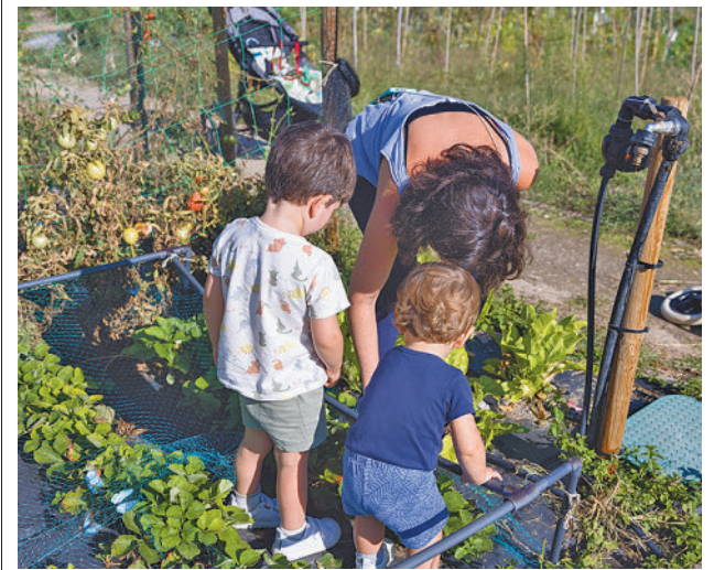
Las instalaciones cuentan con taquillas y aseos

gentedigital.es La actualidad de Colmenar y Tres Cantos, en nuestra web.