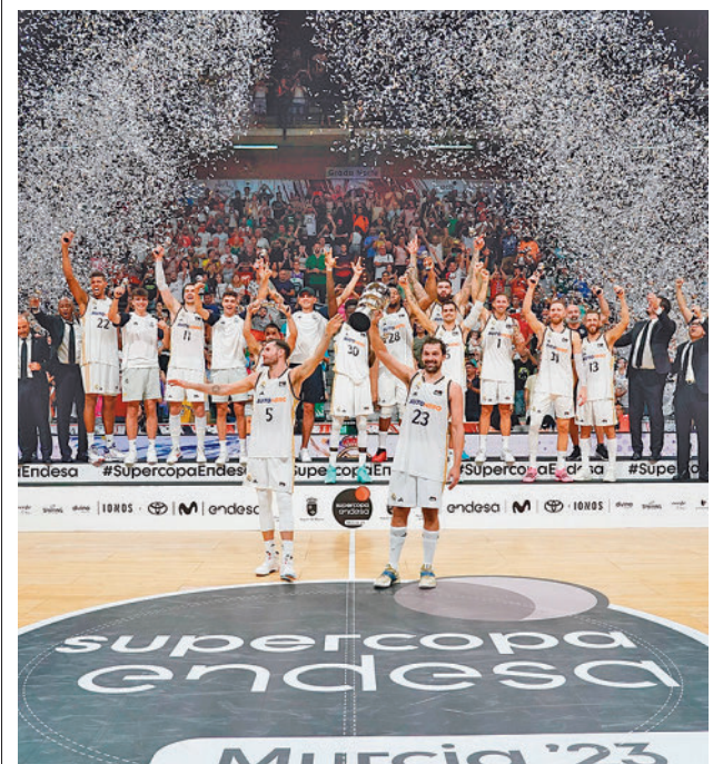
Los blancos conquistaron una nueva Supercopa