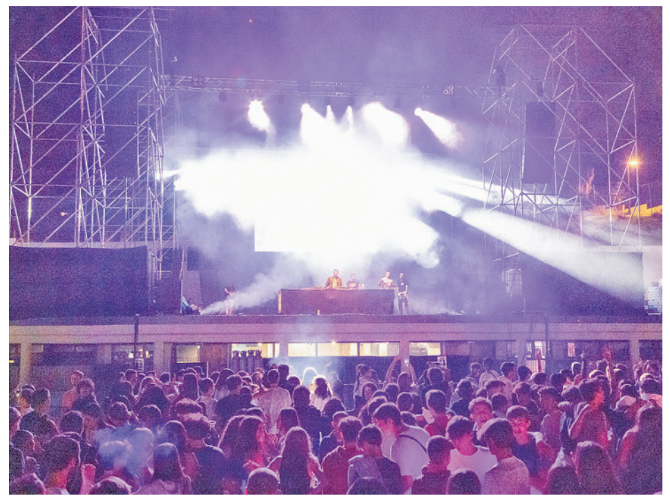
Imagen de la pasada edición

Como viene siendo habitual en celebraciones multitu-