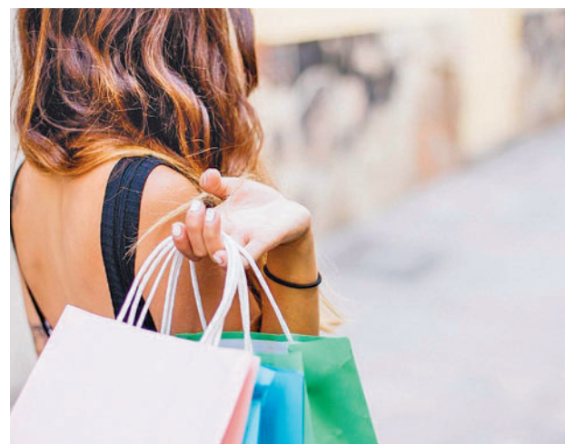
Cada establecimiento celebrará un sorteo

dos durante la campaña con una banderola en forma de lágrima a la entrada de su local, para que los clientes puedan saber qué establecimientos están adheridos. Durante las dos semanas que durará la campaña los clientes que realicen una compra igual o superior a 20 euros podrán rellenar una única papeleta que depositarán en una urna, y les dará la opción de ser el