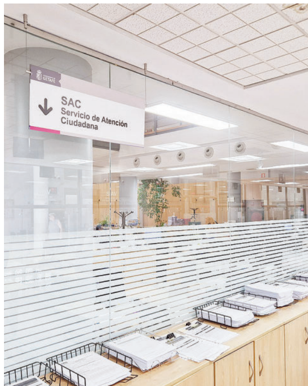
Servicio de Atención Ciudadana de Getafe

Está compuesto por una expendedora de tickets, un panel donde se van mostrando las llamadas y 22 'display' situados en las mesas de atención, que se encuentra ubicada en la sede central del Ayuntamiento de Getafe y ofrece dicha funcionalidad al Servicio de Atención al Vecino. No existe un sistema de cita previa integrado con el sistema de gestión de esperas y actualmente los servicios de atención al vecino se ofrecen desde distintas ubicaciones donde no se dispone de un sistema de gestión de esperas, por lo que con esta adjudicación se pretende ofrecer