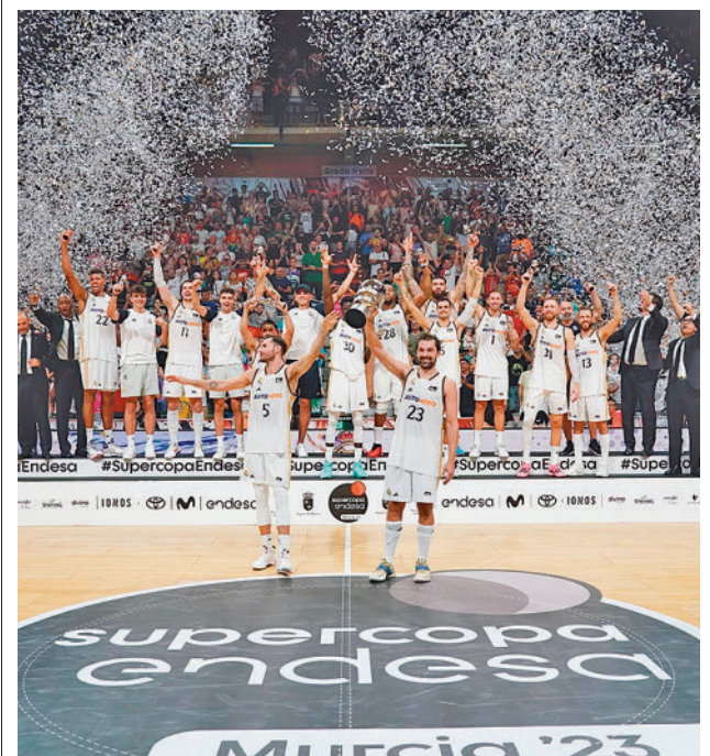
Los blancos conquistaron una nueva Supercopa