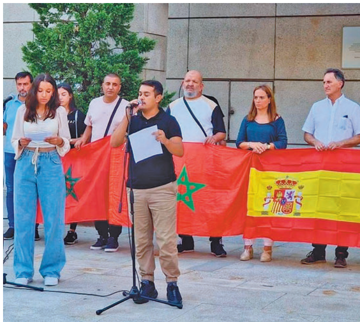
Acto institucional de apoyo a Marruecos

El Ayuntamiento de Getafe pone en marcha una campaña solidaria con Marruecos, para recaudar fondos, material sanitario y de higiene personal, para los afectados por el terremoto sufrido el país vecino. Los vecinos interesados en colaborar podrán llevar el material a los centros cívicos y la Fábrica de Harinas, hasta el 1 de octubre. Concretamente se recogerá mate-