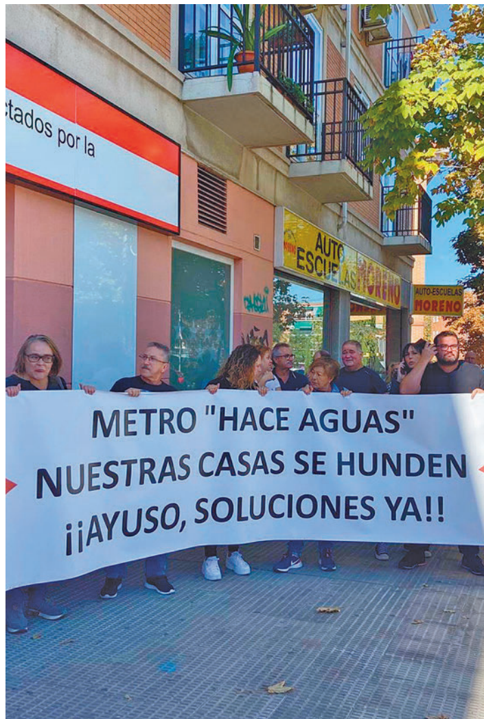
Una de las protestas realizadas en la localidad