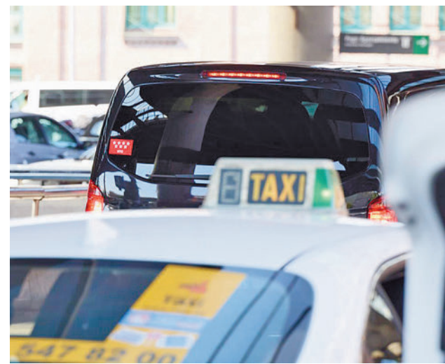
VTC por las calles de Madrid