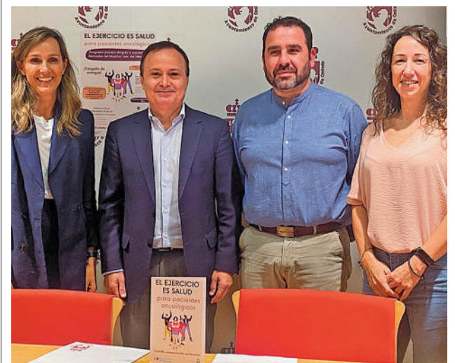
Foto de familia durante la presentación

gentedigital.es La actualidad de la zona Este de la región, en nuestra web.