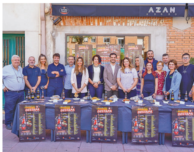
Foto del acto de presentación

El objetivo de este evento es promocionar la gastronomía de Torrejón y hacer que esta feria se convierta "en un reclamo para el cliente que se dé cita cada año para de-