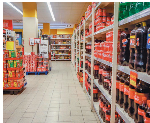
La marca blanca aumenta sus ventas