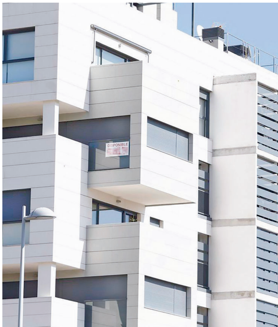
La hipoteca aumenta su porcentaje de los gastos familiares

Viviendas Se vendieron en España en mayo de este año