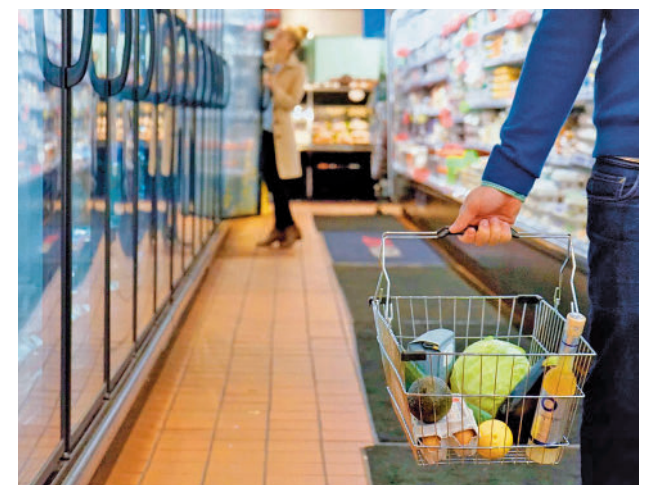
Los españoles gastan más de lo que ganan

No obstante, Nueno ha afirmado que la evolución del mercado laboral tendrá un "efecto positivo" en el consumo, ya que la creación de empleo permitirá que gente más joven se incorpore al mercado laboral y tenga ingresos con los que gastar. "Esto impulsará diferentes categorías de pequeño gasto, como la restauración, los viajes 'low cost' o la moda", ha concluido.