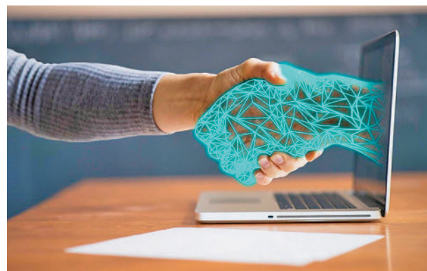
La Inteligencia Artificial ha llegado para quedarse

redefiniendo la manera en que las empresas operan y, en consecuencia, las habilidades necesarias para sobresalir en el mercado laboral. “Los expertos en el campo de la tecnología y la educación ven la necesidad de una adaptación constante en un mundo laboral cada vez más im-