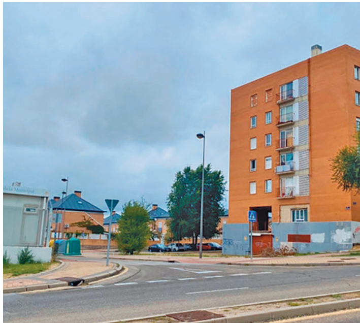
Entorno de la calle Praga y de la avenida de Villaviciosa PP ALCORCÓN

Las quejas de los vecinos de la calle Praga y de la avenida de Villaviciosa sobre la "inseguridad" y la "proliferación de ratas" han formado parte del debate del Pleno Municipal. Una situación que quienes viven allí achacan a la presencia de viviendas okupadas, pertenecientes a la Sociedad de Gestión de Activos Procedentes de la Reestructuración Bancaria (Sareb). Es