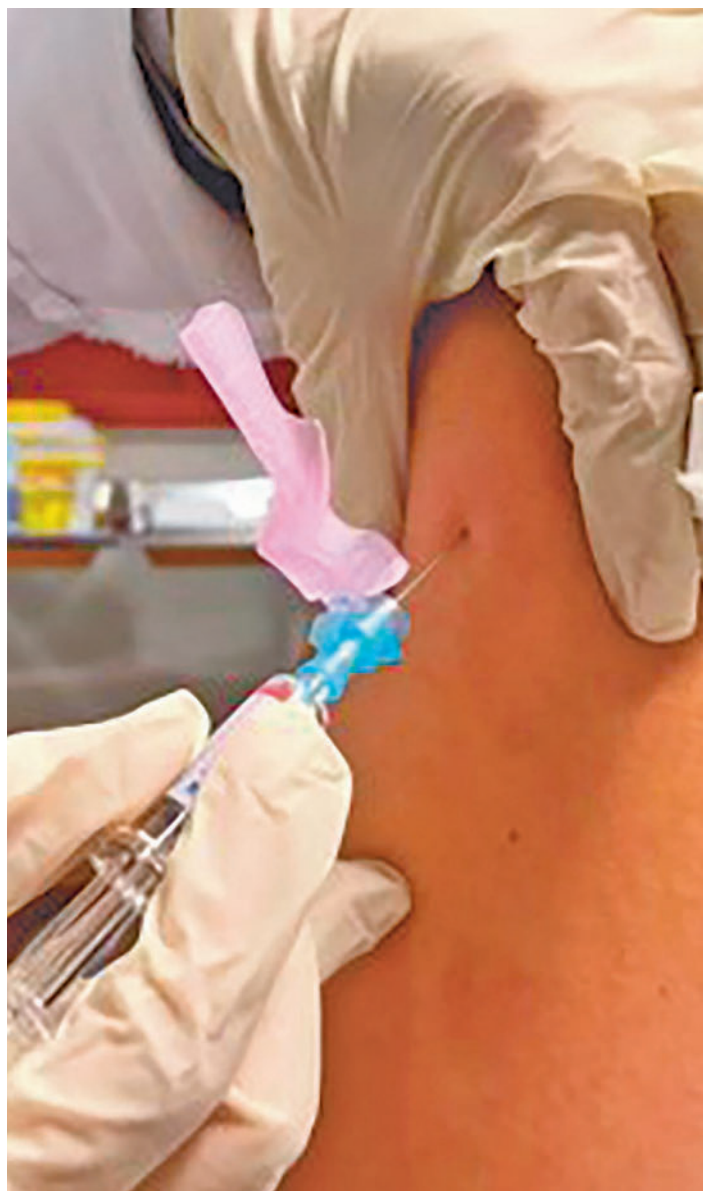
Vacunación en la Comunidad de Madrid

El lunes 2 empieza la del Virus Respiratorio Sincitial para los bebés menores de 6 meses • A partir del día 16 comenzará la de la gripe y la de la covid-19 para los mayores de 60 años