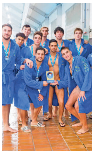
Triunfo del Canoe

triple representación madrileña. En la División de Honor Femenina, al CDN Boadilla se une el Simalga Real Canoe, que arranca la Liga ju-