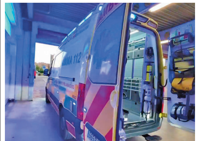
Traslado del herido al hospital EMERGENCIAS 112 CAM

Asimismo, aseguran que muchas iniciativas del plan del PP ya se están ejecutando, que se han hecho limpiezas y se están llevando a cabo desratizaciones.