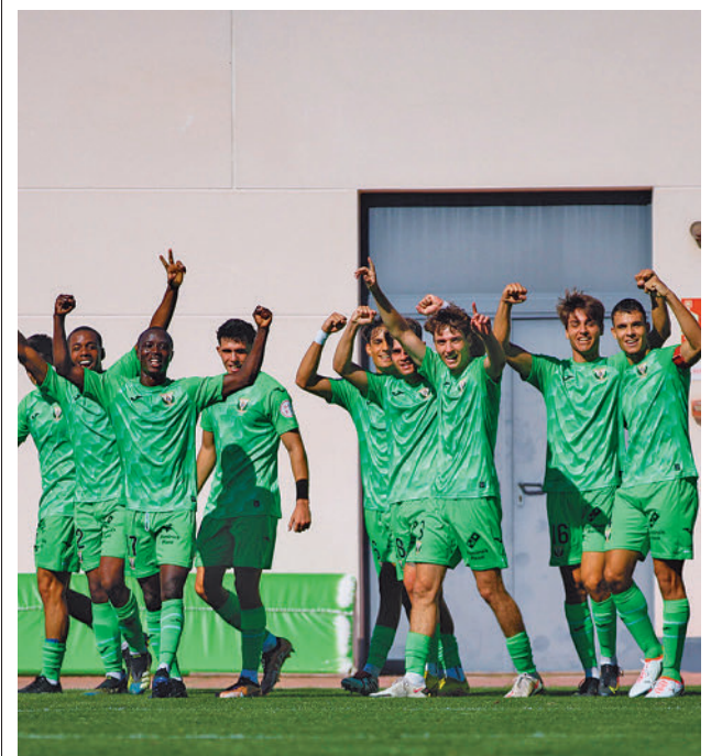
El Leganés B sigue invicto

Junto a estos dos equipos, en la Liga Femenina Challenge también competirá otro madrileño, el Sernova Renovables Real Canoe.