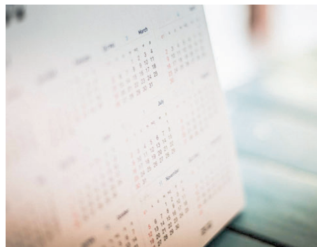
Aprobado el calendario laboral

En concreto, serán no laborables con carácter general el lunes 1 de enero (Año Nuevo), el sábado 6 de enero (Epifanía del Señor o Día de Reyes), el 28 de marzo (Jueves Santo),