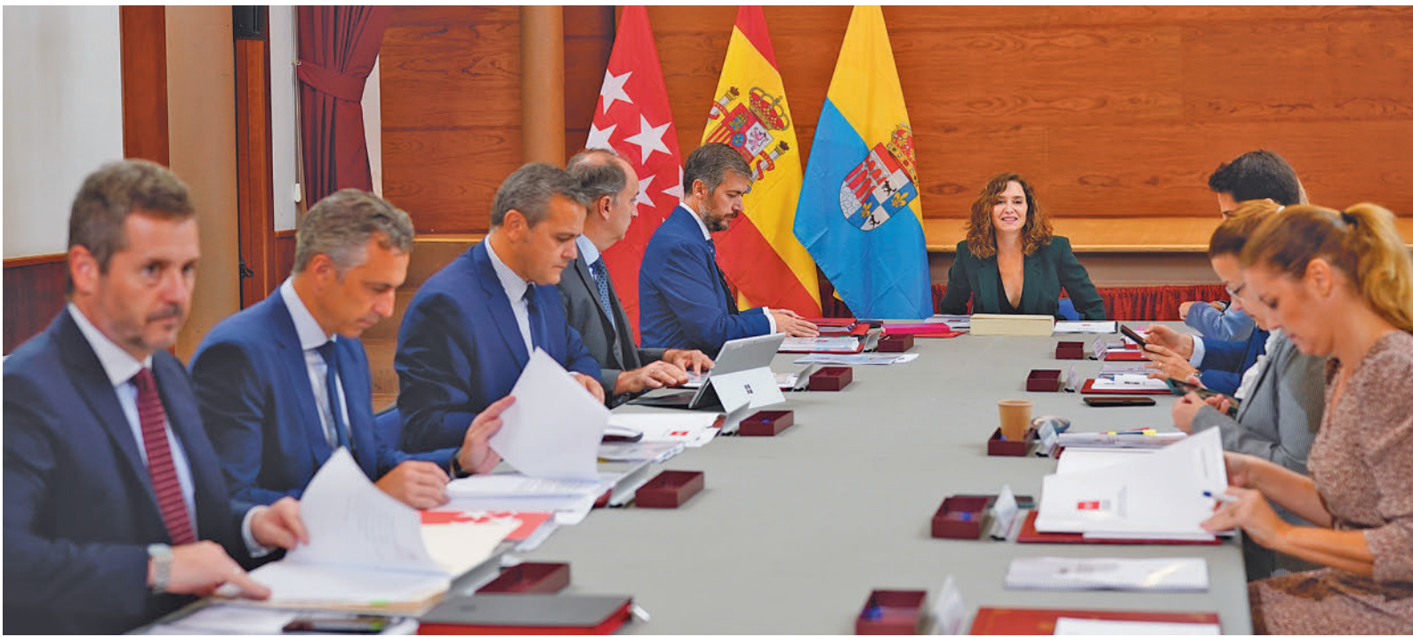
Consejo de Gobierno celebrado esta semana en Villamanta