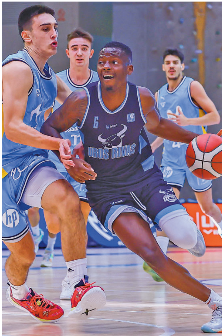
El Uros impuso su ley ante dos filiales

Ya en la gran final, el Uros de Rivas se verá las caras con otro filial, el del Movistar Es-