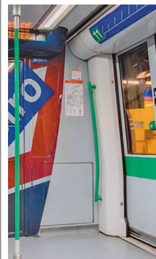
Vagón de Metro

salud y consultorios locales de la Comunidad de Madrid, centros sanitarios del Ayuntamiento, centro de Vacunación de la Comunidad de Madrid y otros puntos de vacunación autorizados. En el caso de los ancianos, también se podrá llevar a cabo en residencias. La Comunidad de Madrid ha invertido 18,9 millones de euros.