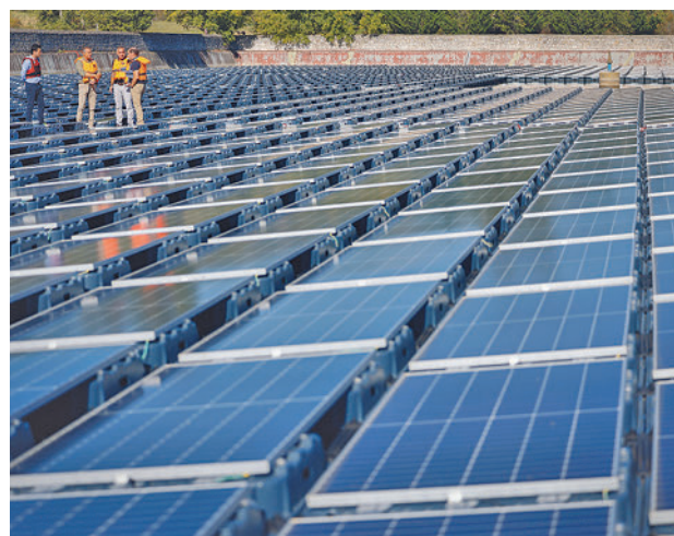
Instalación fotovoltaica de Torrelaguna

El complejo ha habilitado un total de 3.770 módulos fotovoltaicos en una superficie de 11.680 metros cuadrados con una inversión de 2,1 mi-