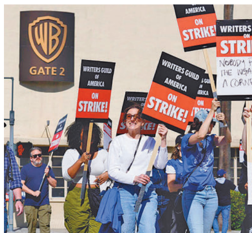
Protestas de los guionistas de Hollywood

EL PERIÓDICO GENTE NO SE RESPONSABILIZA NI SE IDENTIFICA CON LAS OPINIONES QUE SUS LECTORES Y COLABORADORES EXPONGAN EN SUS CARTAS Y ARTÍCULOS