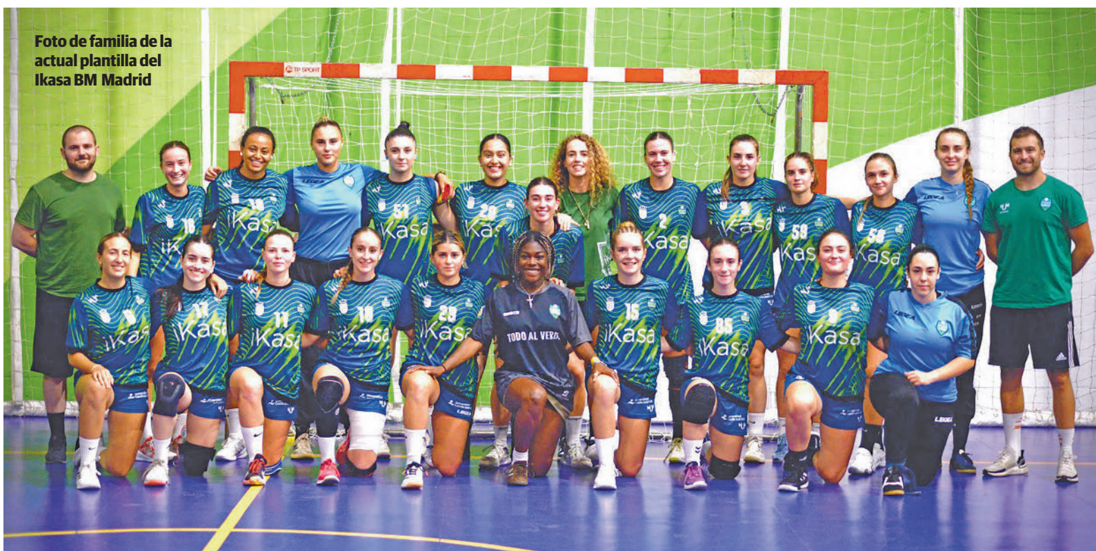
Foto de familia de la actual plantilla del Ikasa BM Madrid