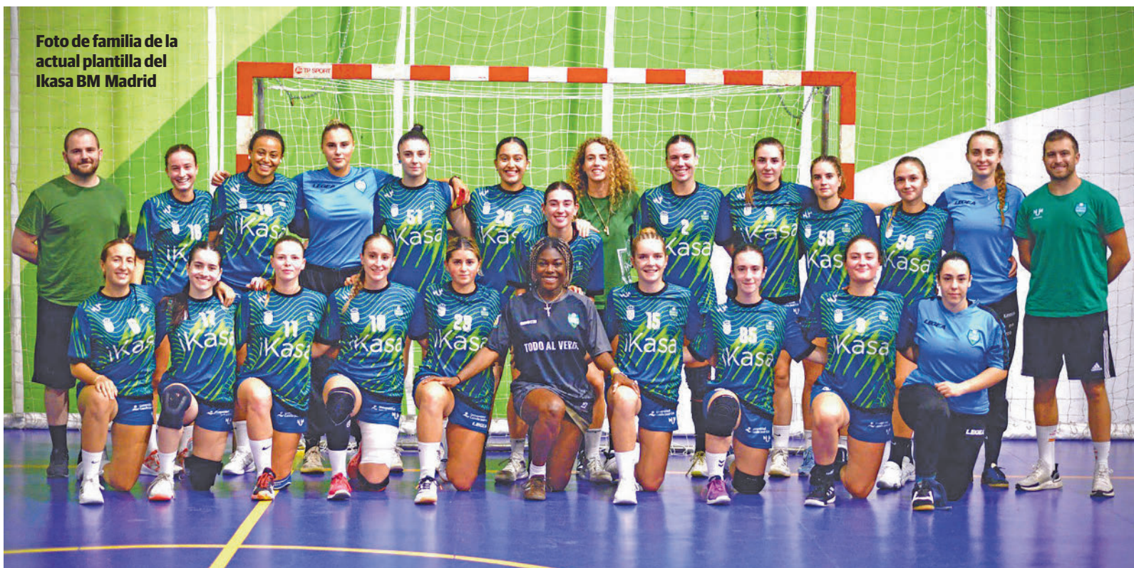
Foto de familia de la actual plantilla del Ikasa BM Madrid