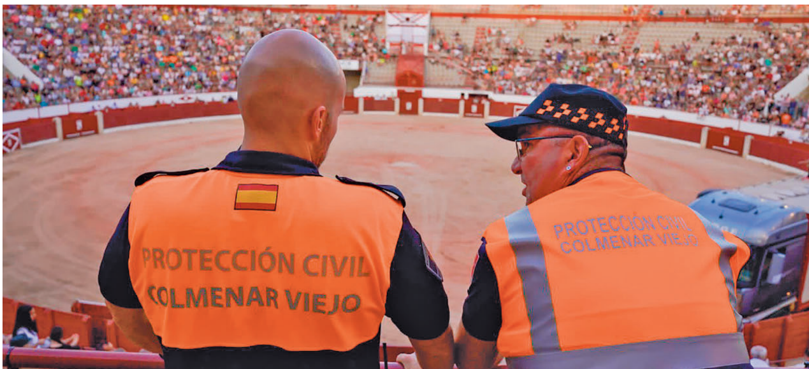
La actuación de Protección Civil ha contribuido al buen desarrollo de eventos como la feria taurina

Otra de las novedades que será una realidad en un breve espacio de tiempo tiene que ver con la Concejalía de Calidad, Mantenimiento de la Ciudad y Edificios Públicos. Recientemente, ha aprobado el proyecto de mejora de accesibilidad e itinerarios peatonales en las calles Río Júcar, Jamaica, Lima, Colombia, Pilar de Zaragoza y Río Duero, cuya fase de licitación comienza en las próximas semanas por un importe base de licitación de 1.300.000 euros. La semana pasada se presentó la reforma integral del barrio de Prado Tito-El Olivar tras acabar los trabajos.