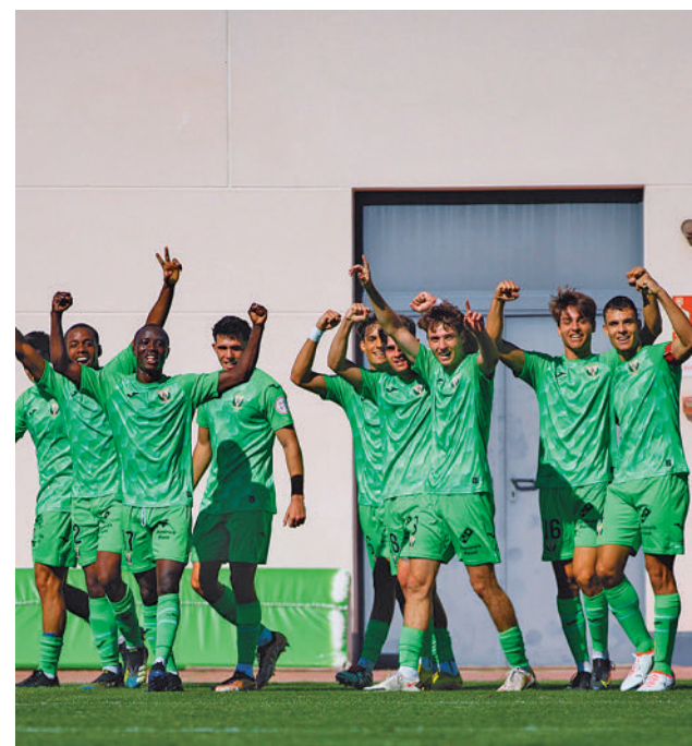
El Leganés B sigue invicto

Junto a estos dos equipos, en la Liga Femenina Challenge también competirá otro madrileño, el Sernova Renovables Real Canoe.