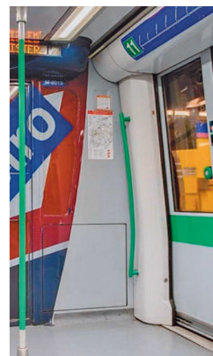
Vagón de Metro

salud y consultorios locales de la Comunidad de Madrid, centros sanitarios del Ayuntamiento, centro de Vacunación de la Comunidad de Madrid y otros puntos de vacunación autorizados. En el caso de los ancianos, también se podrá llevar a cabo en residencias. La Comunidad de Madrid ha invertido 18,9 millones de euros.