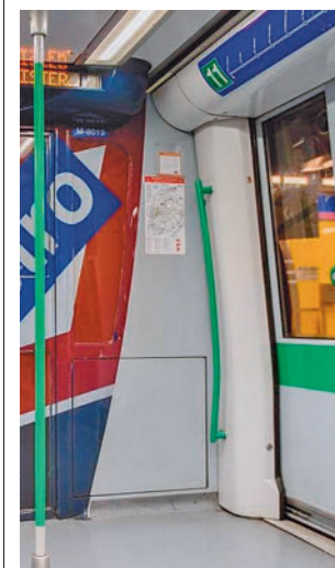
Vagón de Metro

salud y consultorios locales de la Comunidad de Madrid, centros sanitarios del Ayuntamiento, centro de Vacunación de la Comunidad de Madrid y otros puntos de vacunación autorizados. En el caso de los ancianos, también se podrá llevar a cabo en residencias. La Comunidad de Madrid ha invertido 18,9 millones de euros.