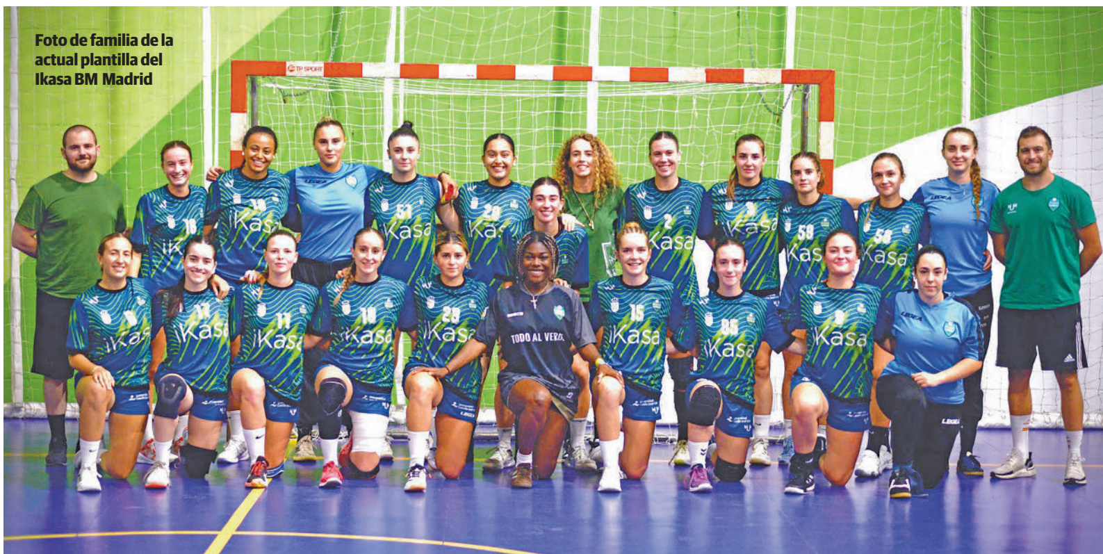
Foto de familia de la actual plantilla del Ikasa BM Madrid