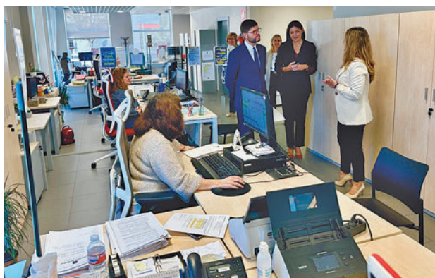
Oficina de empleo de Majadahonda

Por su ubicación en el Polígono El Carralero este re-