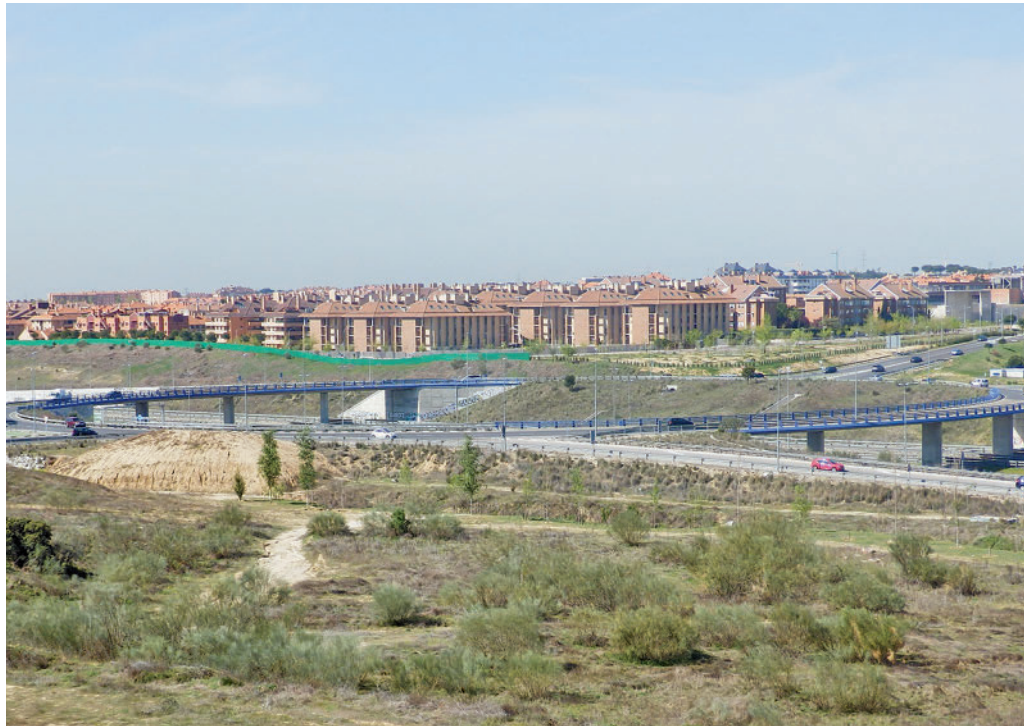
Vía de circunvalación M-50 a su paso por Boadilla del Monte

Para ello, según ha informado el Ayuntamiento de Boadilla del Monte esta semana se modificará el acceso a la M-513 desde la estación de servicio, se generará un tercer carril en esta vía y se ampliará a dos carriles el ramal de acceso a la misma desde la avenida del Infante Don Luis, uno de los cuales hará de 'bypass' para facilitar esa incorporación directa a la M-50.