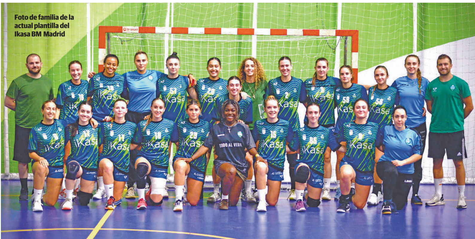
Foto de familia de la actual plantilla del Ikasa BM Madrid