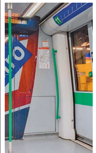
Vagón de Metro

salud y consultorios locales de la Comunidad de Madrid, centros sanitarios del Ayuntamiento, centro de Vacunación de la Comunidad de Madrid y otros puntos de vacunación autorizados. En el caso de los ancianos, también se podrá llevar a cabo en residencias. La Comunidad de Madrid ha invertido 18,9 millones de euros.