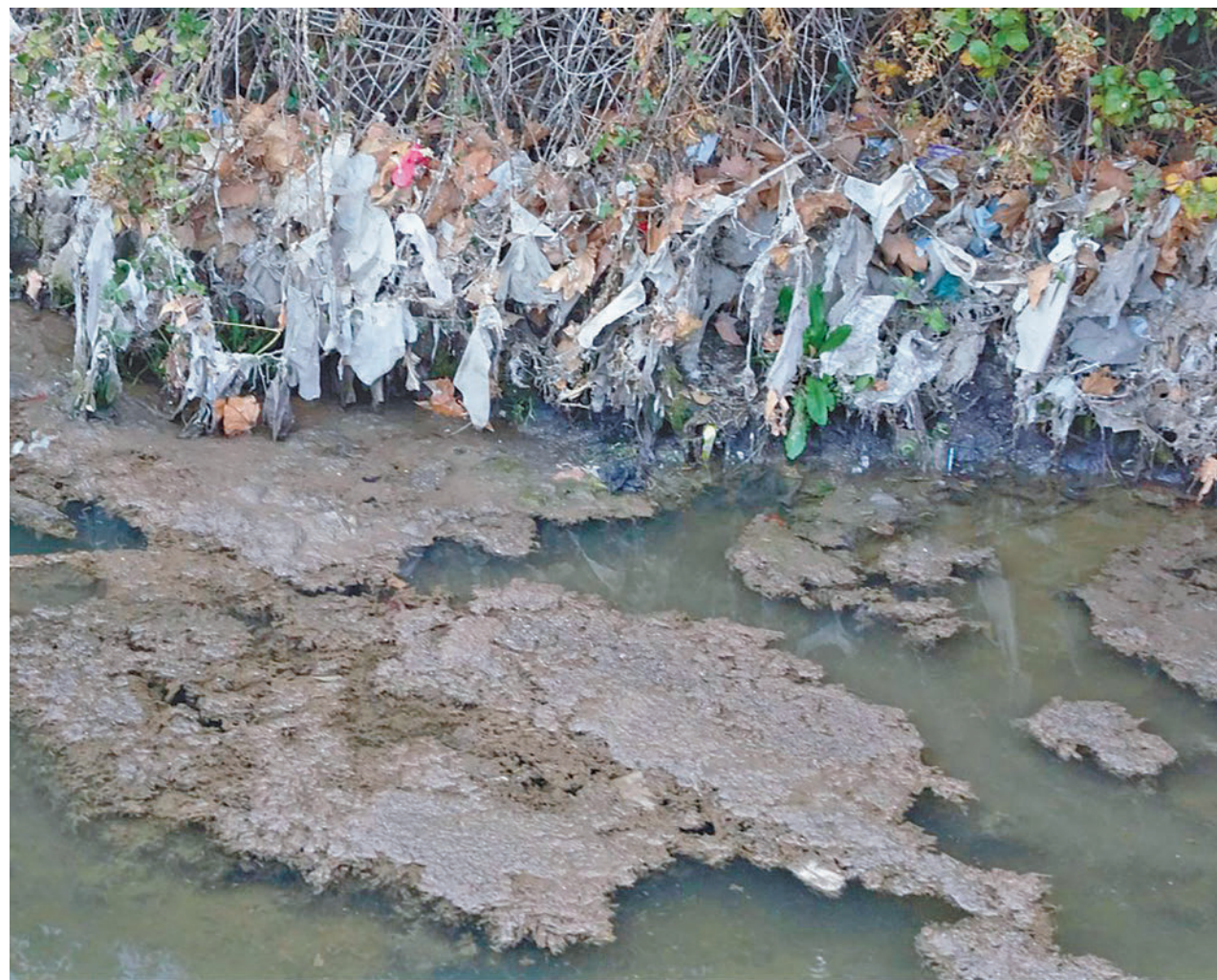
ASOC. ECOLOGISTA EL SOTO