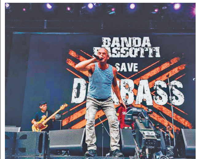
Banda Bassotti actuará este sábado 30

gentedigital.es La actualidad de la zona Este de la región, en nuestra web.