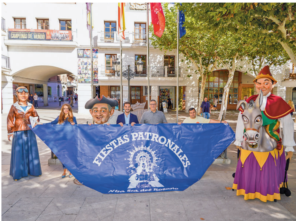
Gigantes y Cabezudos, junto al alcalde durante la presentación de las fiestas