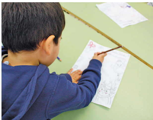
Las actividades arrancan este lunes 2

Las bajas de las Actividades Extraescolares se comunicarán por escrito con 15 días de antelación para que el cobro de las mismas no se haga efectivo.