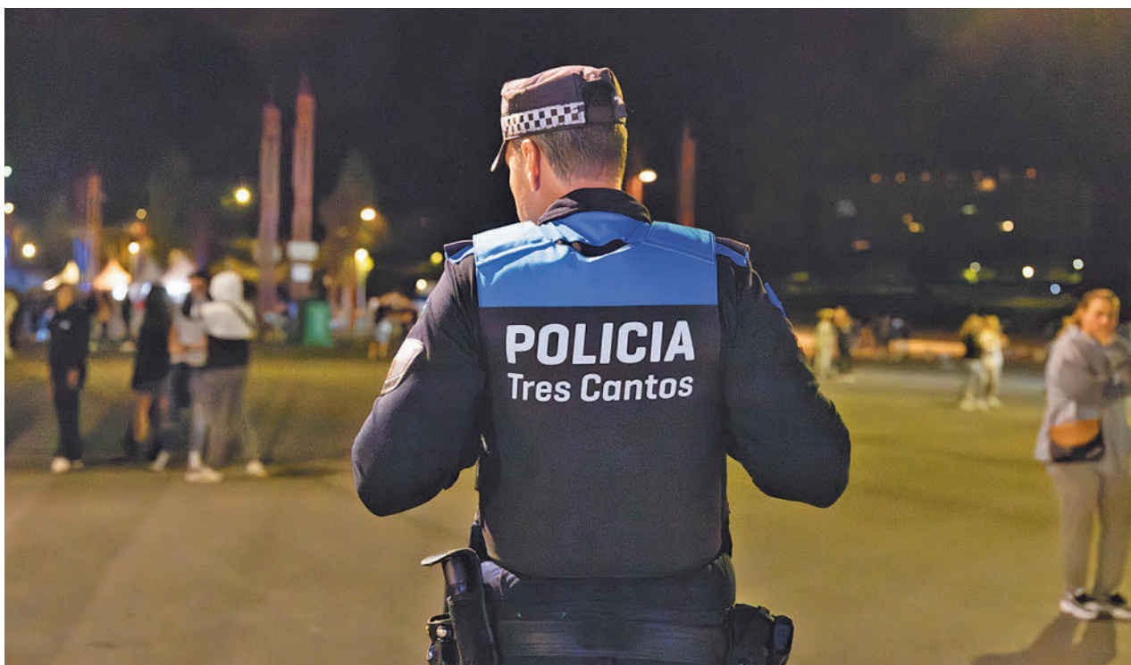
Dispositivo de seguridad durante el festival Ola Septiembre