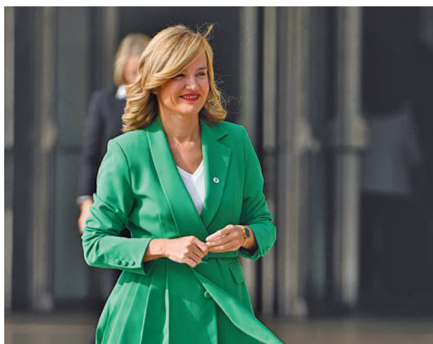
La ministra de Educación, Pilar Alegria

Con esta plataforma virtual se quiere crear una gran red nacional e internacional