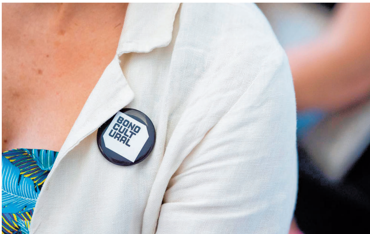
Chapa promocional del Bono Cultural Joven

Para obtenerlo, los jóvenes interesados deben registrarse en la web Bonoculturajoven.gob.es a través de Cl@ve con registro básico (que se puede solicitar y obtener por videollamada), Cl@ve con registro avanzado (de forma presencial y para aquellos que no hayan cumplido todavía los 18 años) o bien a través de su Certificado digital. Los solicitantes pueden realizar el trámite personalmente o a través de la representación de un adulto, para lo cual es preciso adjuntar el formulario de representación descargable en la página web, correctamente firmado por beneficiario y representante. En estos casos, el libro de fa-