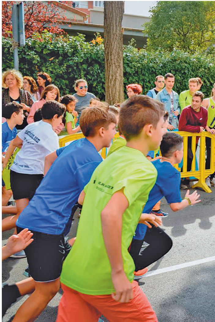
Imagen de una edición anterior

El recorrido ya está definido, con un guiño claro a ASPRODICO, ya que la salida estará instalada en los alrededores de la propia sede de esta asociación, ubicada en la calle Batanes 4. Desde ahí, los