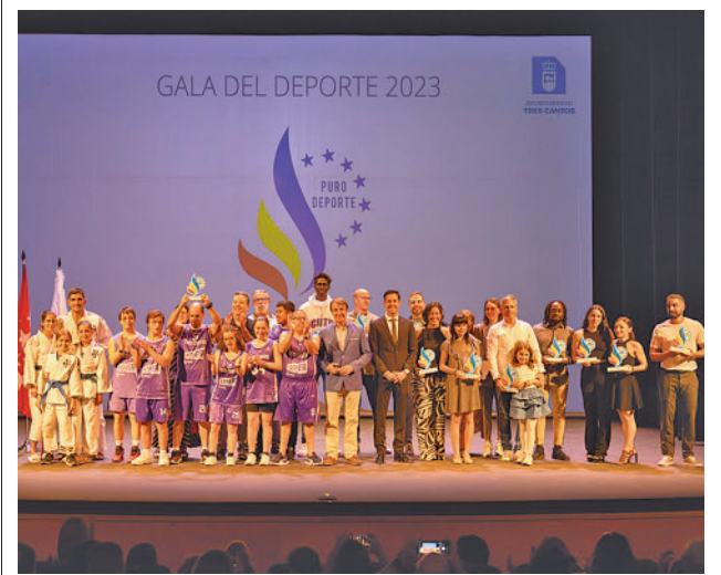
Foto de familia de los galardonados

gentedigital.es La actualidad de Colmenar y Tres Cantos, en nuestra web.