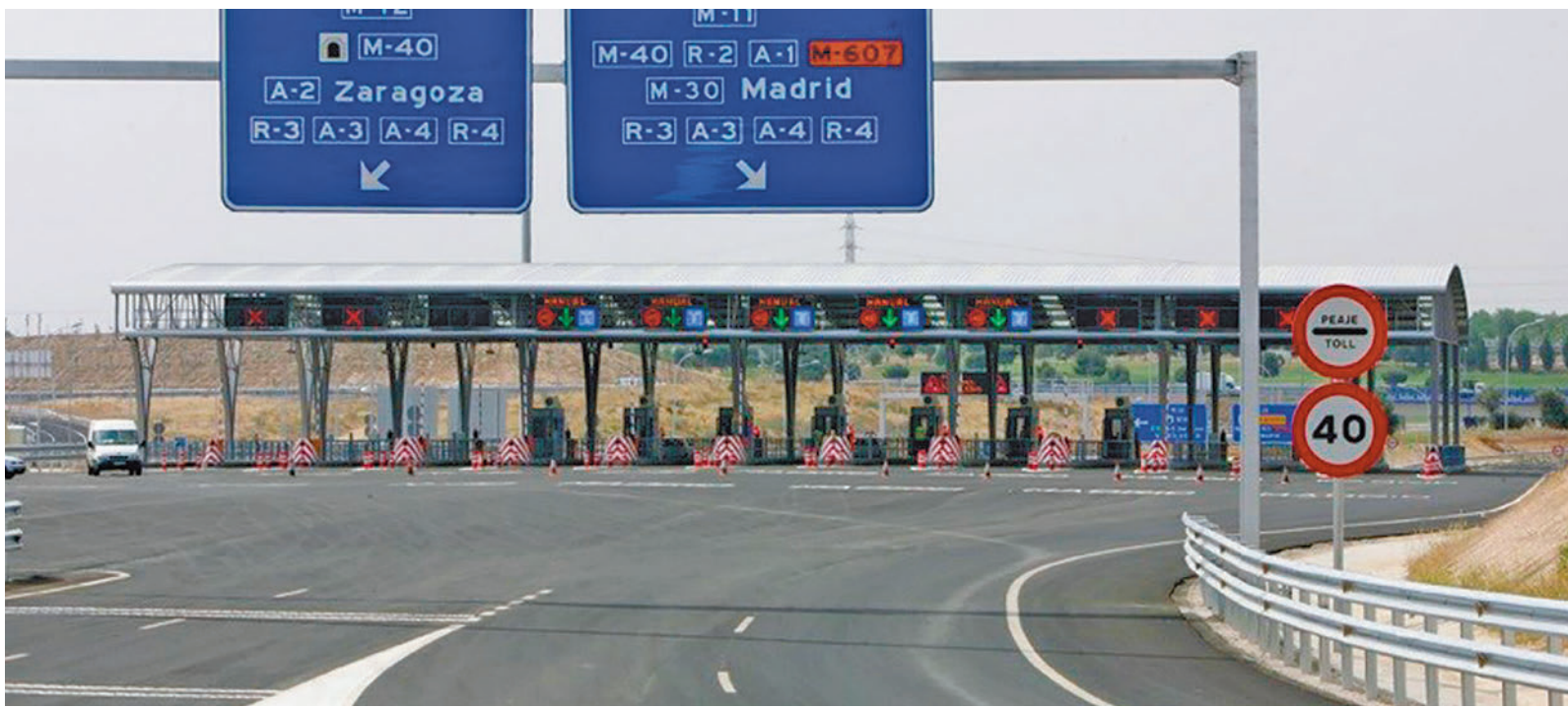
Las autopistas españolas no tendrán peajes obligatorios a partir del año que viene