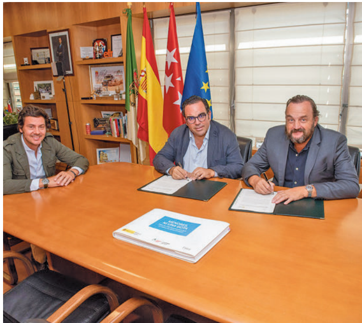
La firma del acuerdo de colaboración que durará cuatro años

El mismo contempla un plan de acción con diferentes