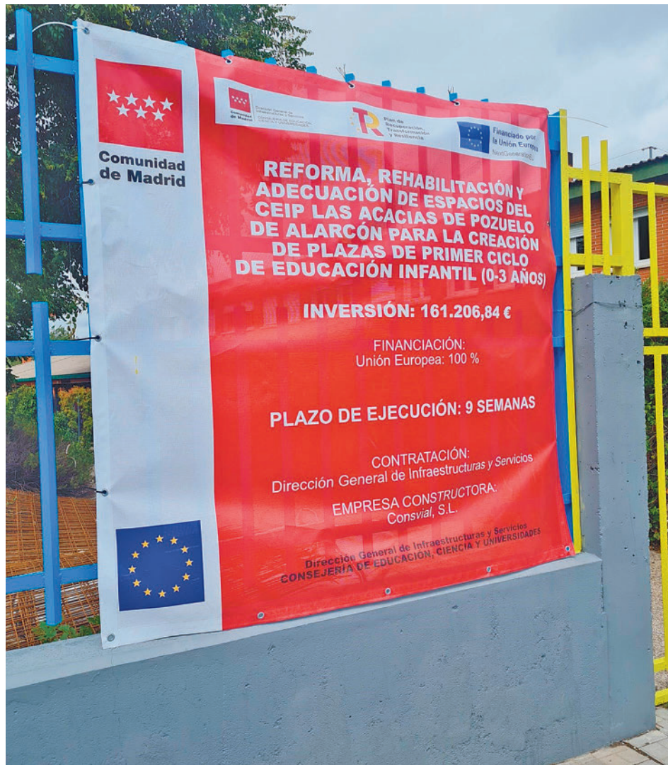
Cartel que anuncia las obras en el colegio Las Acacias EUROPA PRESS

En cuanto al desarrollo de los trabajos, los responsables regionales reconocen que han sufrido un retraso “debido a un problema sobrevenido y puntual con los suministros de la construcción”.