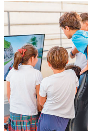
La edición del curso pasado

Las sesiones llevarán como tema 'El uso responsable de las tecnologías en la familia: prevenir la sobreexposición a las pantallas y las redes sociales', y se desarrollarán los martes 7, 14, 21 y 28 de noviembre, en horario de mañana o tarde. Desde el Ayuntamiento explican que la nueva programación recoge la preocupación por el mundo digital, pantallas, redes, Inter-