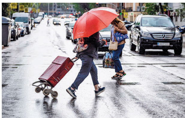
La lluvia podría hacer acto de presencia en Madrid