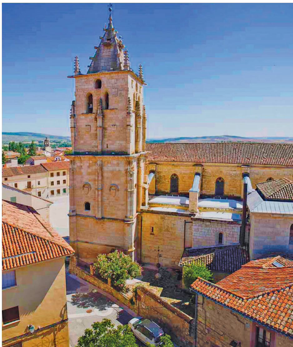
Los pueblos son un reclamo para muchos madrileños