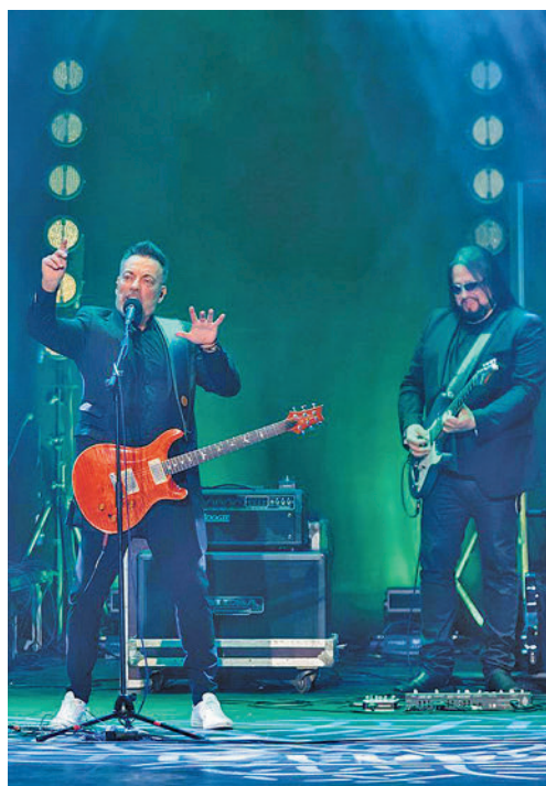
Café Quijano, en concierto

Al día siguiente, los más pequeños de la casa serán también protagonistas de estos festejos, gracias al Día de la Infancia en La Vaguada, donde habrá juegos, rocódromo, futbolines o karts, de 11:30 a 14:30 y de 16:30 a 19 horas.