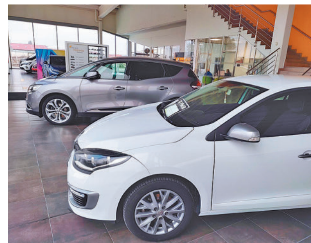
Vehículos a la venta en Madrid

También ha comentado que si se comparan los actuales precios de los vehículos de ocasión con los anteriores a la pandemia de covid-19, los de 2019, el incremento a nivel nacional es de un 3,7%, "muy moderado si se considera que en este periodo el IPC se ha disparado un 15,4%".