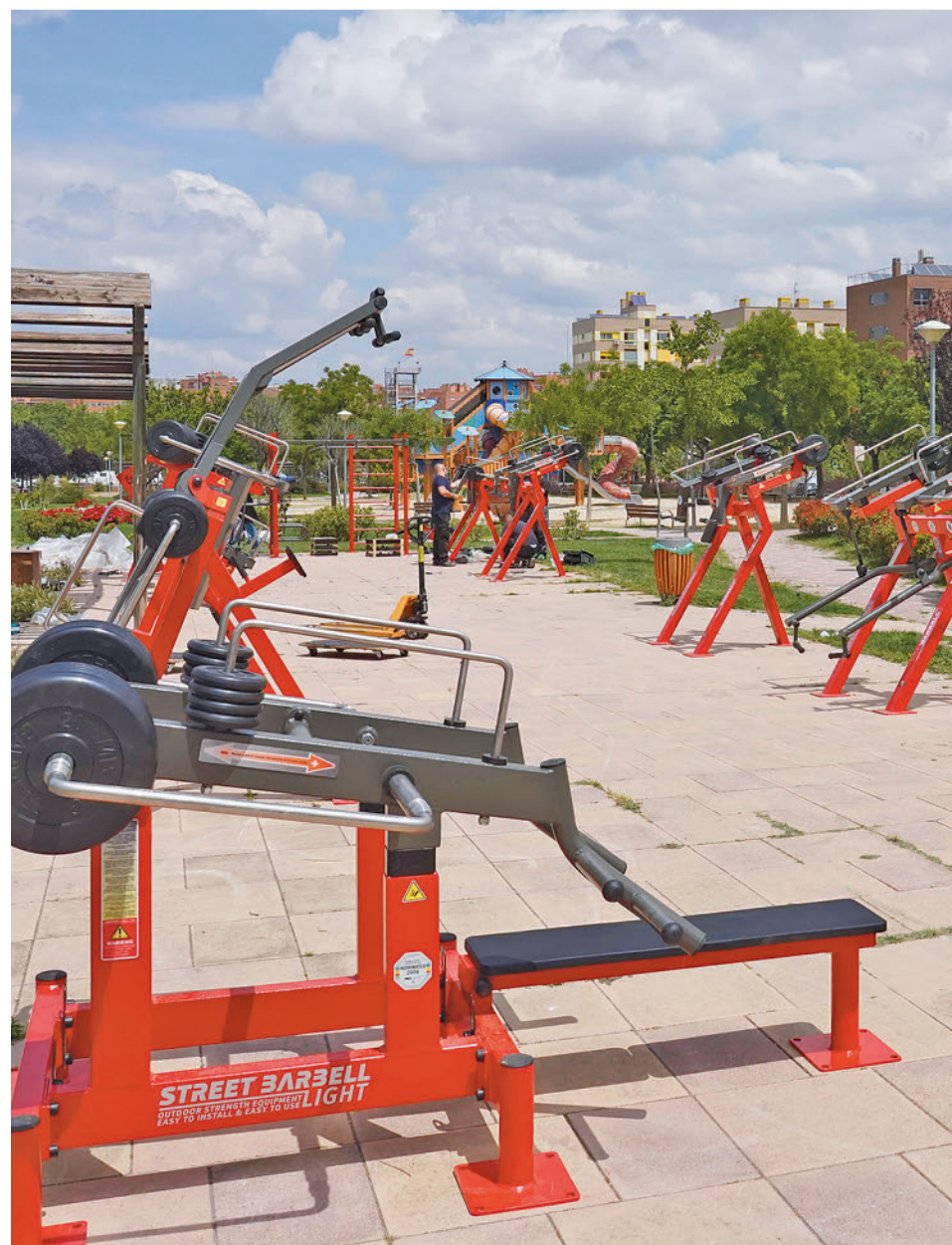
Uno de los gimnasios de musculación al aire libre que hay en la región AYUNTAMIENTO ALCORCÓN

Algo especialmente importante para combatir la apatía y el estrés es, sin duda, la práctica regular de ejercicio. Por eso, aunque el clima en ocasiones sea menos favorable, no hay que descuidar este hábito y realizarlo en gimna-