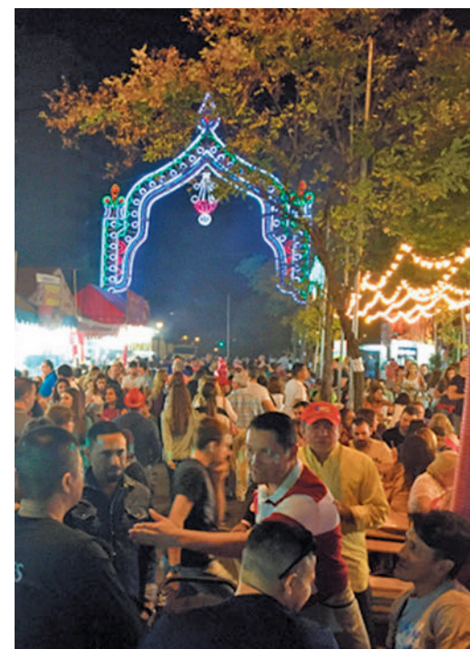
El recinto ferial del parque de La Vaguada

Además, el mismo día (de 8 a 14 h.) se desarrollará la XVIII edición del Certamen de Pintura Rápida en la plaza de Salvador Dalí.