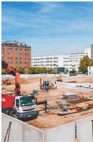
Imagen archivo de una de las parcelas

Desde este jueves 19 de octubre, aquellos interesados en las viviendas del Plan Vive pueden formalizar su solicitud a través de la página web Convivemadridalquila.com para poder optar así a una de ellas. La primera adjudicación está prevista que sea el 4 de diciembre y la entrada de inquilinos para marzo de 2024, según se avisa en la información previa a la inscripción. Se trata de dos promo-