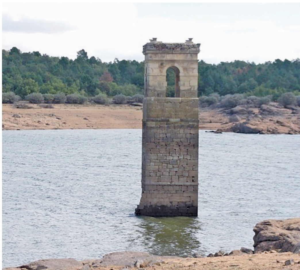
España atraviesa un episodio de sequía intenso