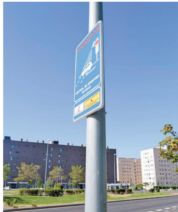
Aviso de la ubicación de una de las cámaras AYTO ALCORCÓN

PRONTO SE AÑADIRÁ OTRO SISTEMA DE GESTIÓN DEL TRÁFICO