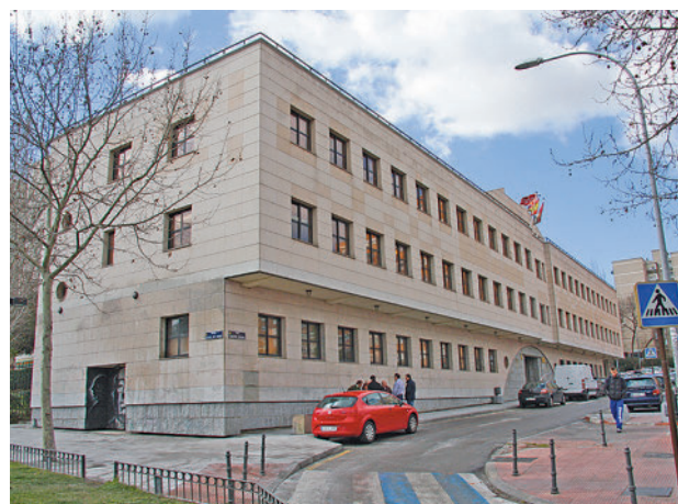
Uno de los centros donde se han llevado a cabo las reuniones

Además, el 4% de estas promociones están adaptadas para personas con movilidad reducida.