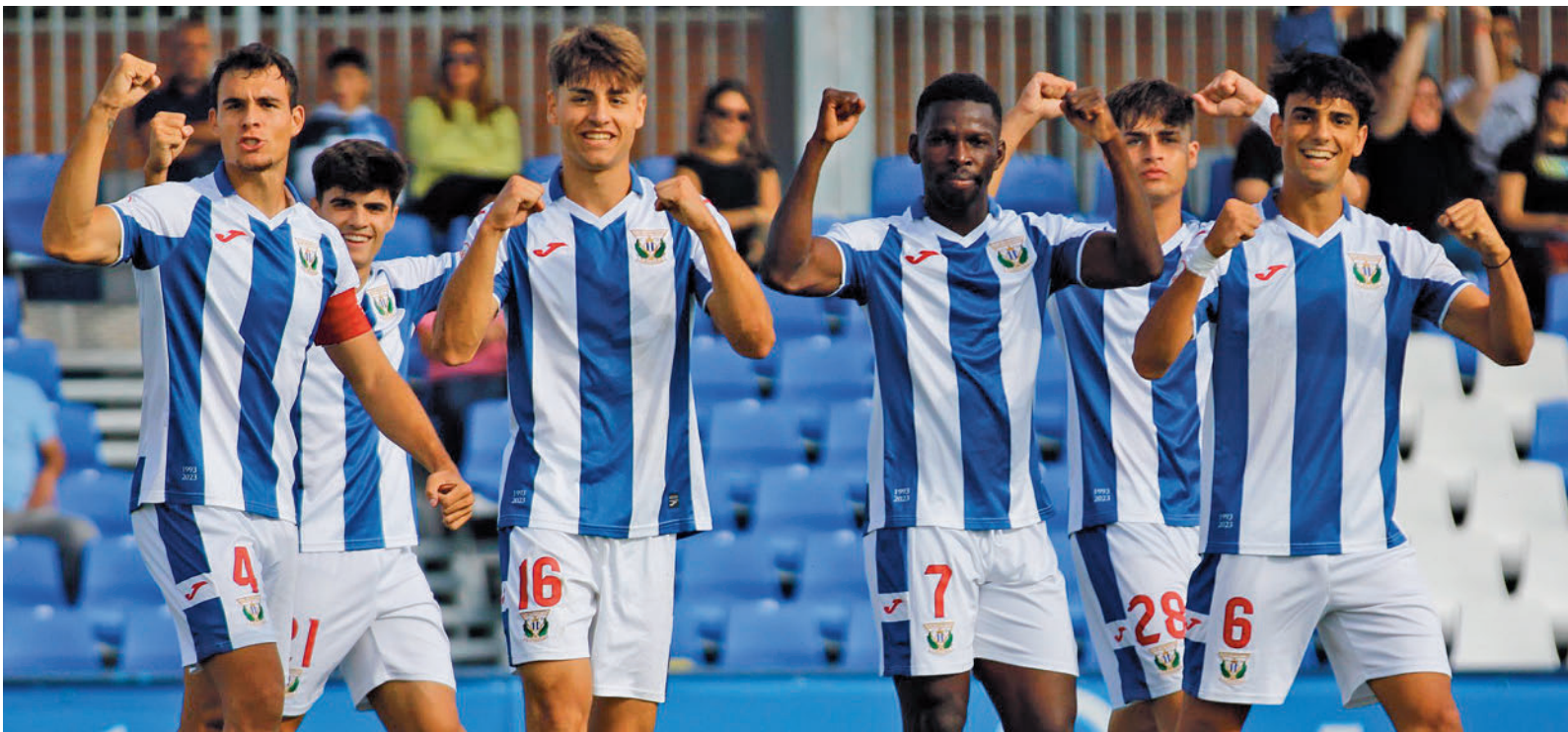
El CD Leganés B no dio opción en la Ciudad Deportiva a Las Rozas