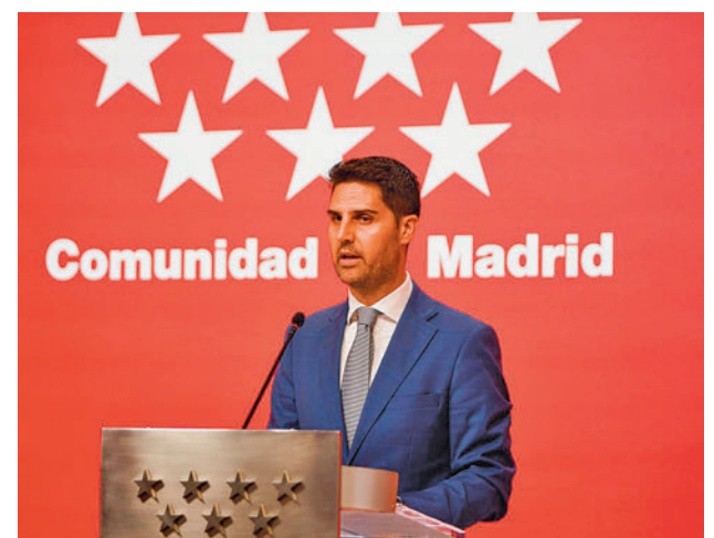
El consejero de Educación, Emilio Viciano

Asociaciones y sindicatos criticaron al Gobierno regional por las situaciones que vivieron muchas familias por "la improvisación, la ineptitud y el abandono". "La normativa salió mal redactada y los parches posteriores no lo han solucionado", apuntaron.