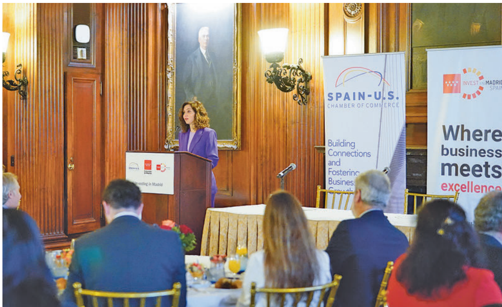
Isabel Díaz Ayuso, durante un encuentro con inversores