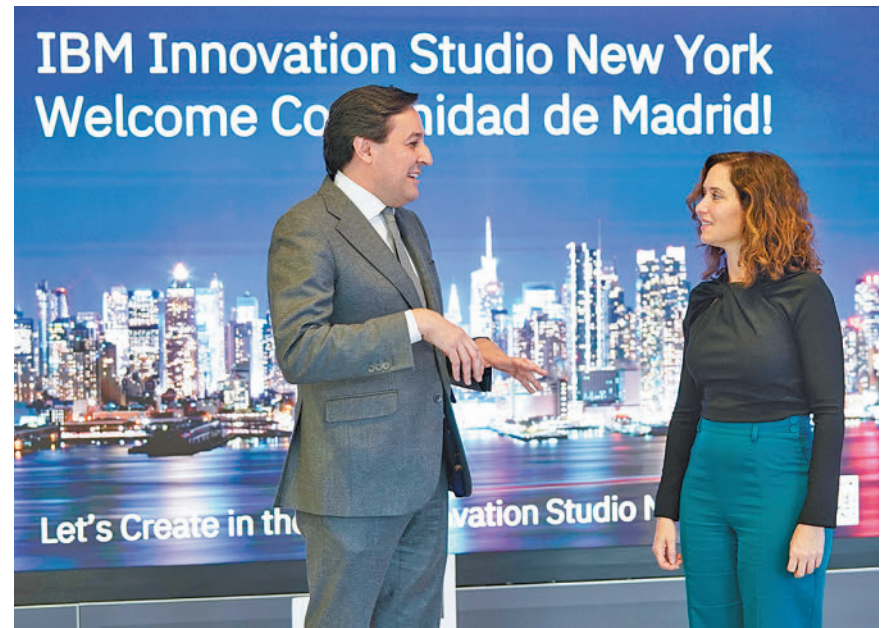
La presidenta se reunió con uno de los responsables de IBM