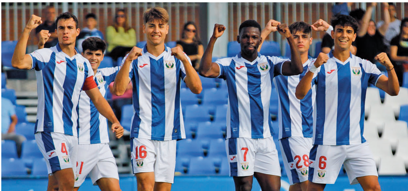
El CD Leganés B no dio opción en la Ciudad Deportiva a Las Rozas