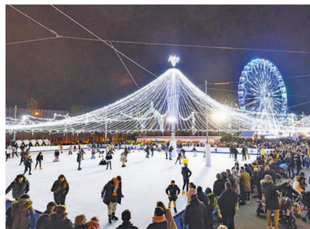
Imagen de archivo de la pista de hielo AYUNTAMIENTO DE GETAFE

gentedigital.es Toda la actualidad de Getafe, en nuestra página web