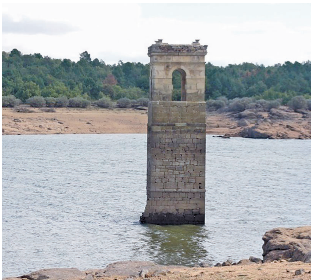
España atraviesa un episodio de sequía intenso