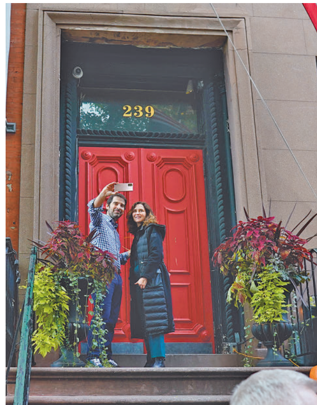
Capital del flamenco: Una de las declaraciones de Ayuso en Nueva York que más impacto ha tenido es en la que afirmaba que pretende que Madrid sea "la capital del flamenco en el mundo", unas palabras no muy bien recibidas en Andalucía.

Las palabras de Ayuso llegaron después de que a lo largo de la semana representantes de partidos de la oposición criticaran el viaje. Una de las más duras fue la portavoz de Más Madrid, Mónica García, que le reprochó que haya cruzado