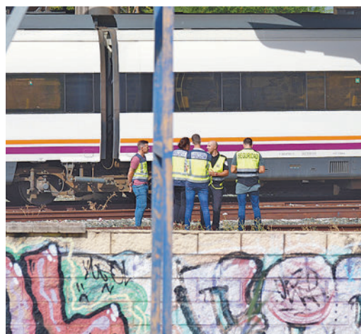
Agentes en la estación de Santa Justa

EL PERIÓDICO GENTE NO SE RESPONSABILIZA NI SE IDENTIFICA CON LAS OPINIONES QUE SUS LECTORES Y COLABORADORES EXPONGAN EN SUS CARTAS Y ARTÍCULOS