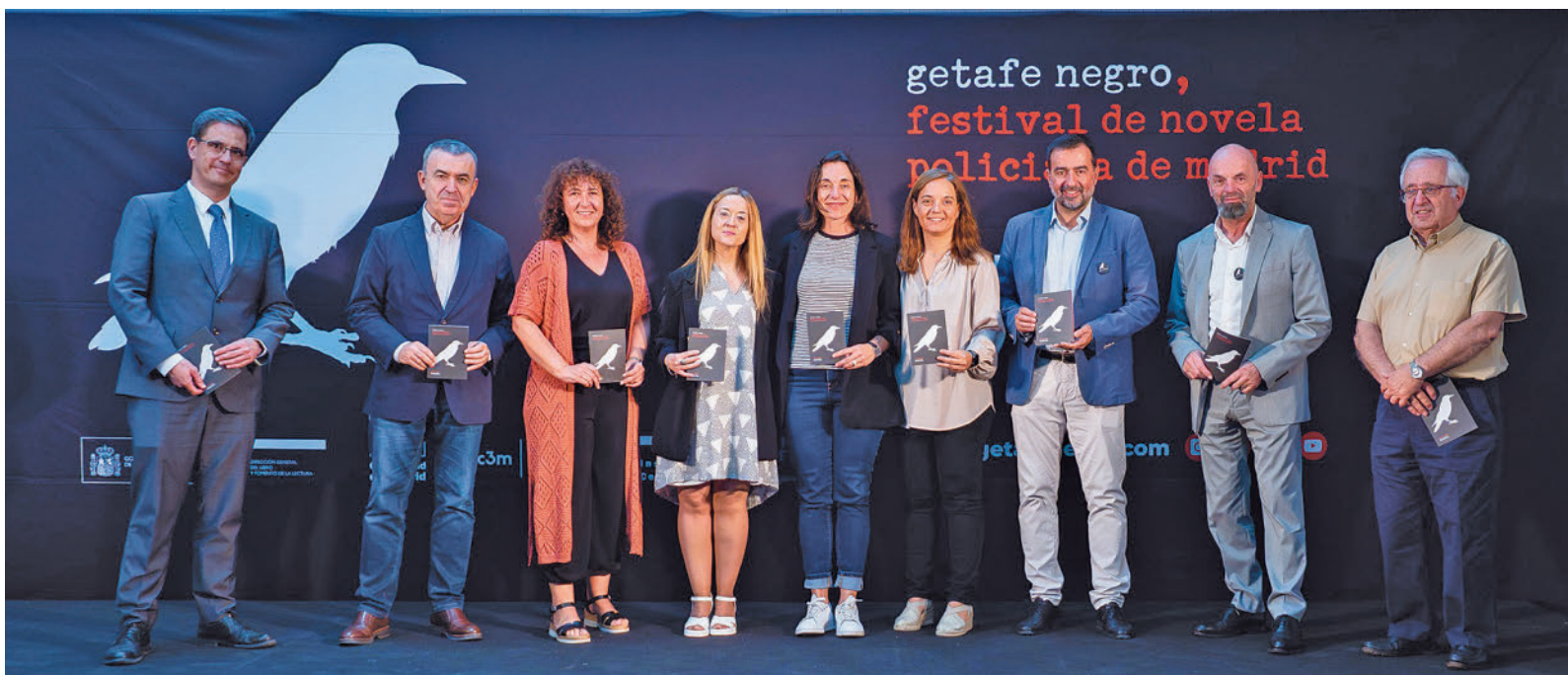
Un momento de la presentación del programa de Getafe Negro ORGANIZACIÓN GETAFE NEGRO