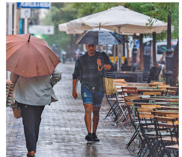
Las lluvias no alivian a los embalses

Se espera que las lluvias de los próximos días ayuden a aumentar las mermadas reservas de agua.