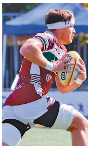
Partido del Alcobendas

de la tercera jornada, una fecha que, en lo que a los intereses madrileños se refiere, depara un partido grande: un derbi. El Estadio Nacional