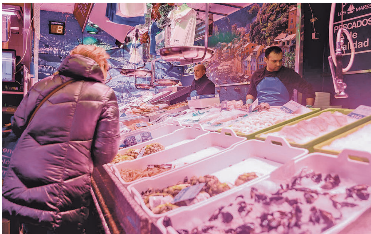
El pescado es uno de los grandes perjudicados por el aumento de los precios

Por grupos de alimentos, el pescado es el gran damnificado por la inflación, ya que el 60% de los encuestados asegura que compra menos cantidad y un 19% opta por productos de una calidad inferior. Le sigue la carne, con el 54% de los compradores, mien-