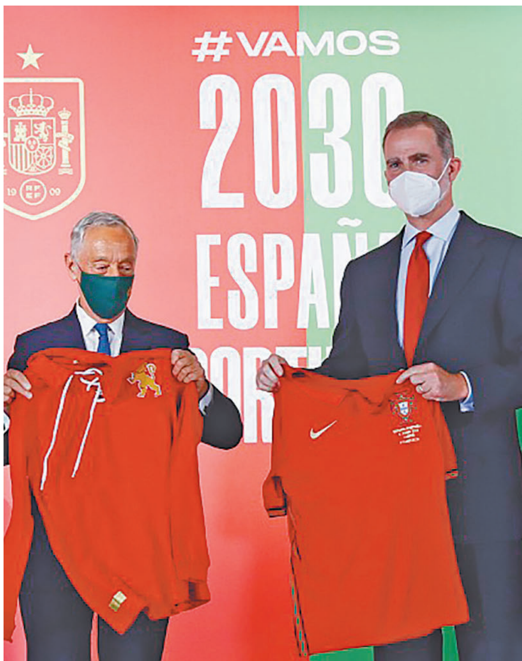
Presentación oficial de la candidatura inicial de España y Portugal

domina), Vigo (Balaídos), A Coruña (Riazor), Gijón (El Molinón), Bilbao (Nuevo San Mamés), San Sebastián (Reale Arena), Málaga (La Rosaleda), Zaragoza (La Romareda), Valencia (Mestalla) y Las Palmas (Gran Canaria).