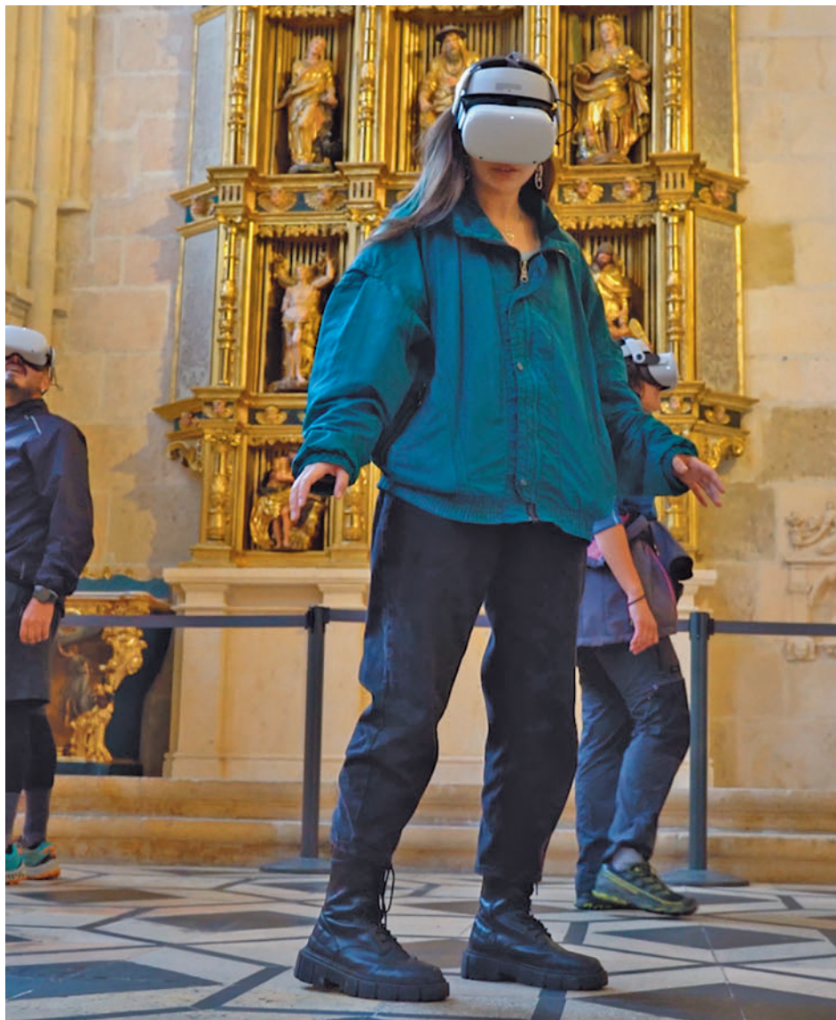
Varios visitantes probando la experiencia 3DUBU TWITTER

Las nuevas tecnologías serán clave para disfrutar de esta "experiencia única" en la que los visitantes "podrán sumergirse en un entorno digital de una forma asombrosamente realista" para contemplar las vistas aéreas de la catedral como el Cimborrio, la Capilla de los Condestables, la Torre norte o la Aguja sur. Desarrollada por un equipo multidisciplinar de docentes de la Universidad de Burgos, la innovación de este proyecto radica en la aplicación de la fotogrametría, una técnica avanzada que supera las limitaciones de las antiguas imágenes 360°, que solo permitían una vista panorámica estática. Esta permite escanear digitalmente los espacios y objetos, gene-