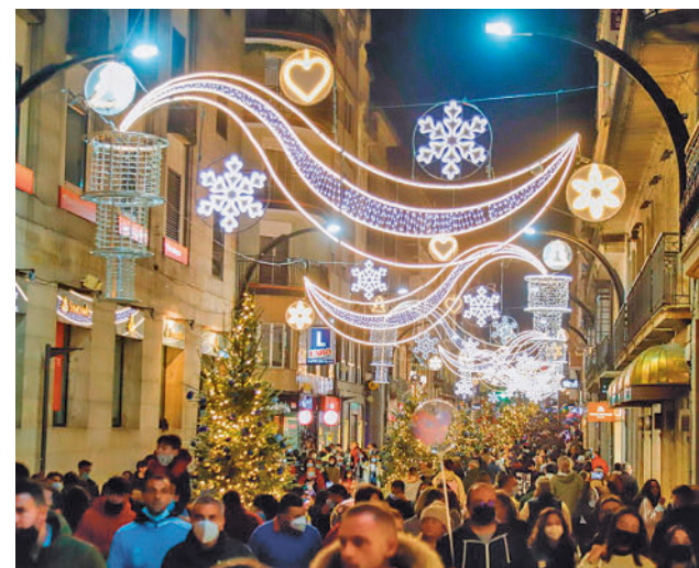
Madrid es el destino preferido en diciembre