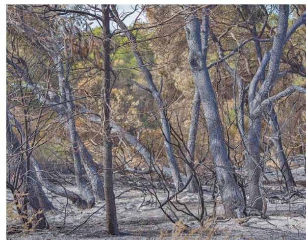
Superficie quemada en España este año

En cuanto al tipo de siniestro, en el periodo analizado se han registrado 7.141 fuegos, de los que su mayoría,