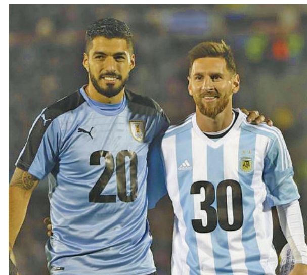
Suárez y Messi promocionaron la candidatura

Esta decisión salomónica ha dejado un gran damnificado por el camino. Chile formaba parte de la candidatura conjunta que presentaron cuatro países sudamericanos, pero es la única que finalmente se quedará sin albergar un solo encuentro de esta edición.