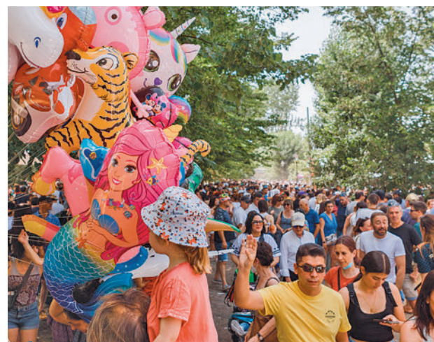
Imagen de archivo de la jira de la Fiesta de El Curpilllos

ello, se analizaron varias opciones, aunque al final se han decidido por esta ubicación "al reunir las mejores condiciones para realizar la tradicional jira, teniendo además todas las garantías de seguridad necesarias para un evento multitudinario como éste", han precisado desde el Ayuntamiento de Burgos. En este sentido, se han puesto en valor las zonas de sombra, así