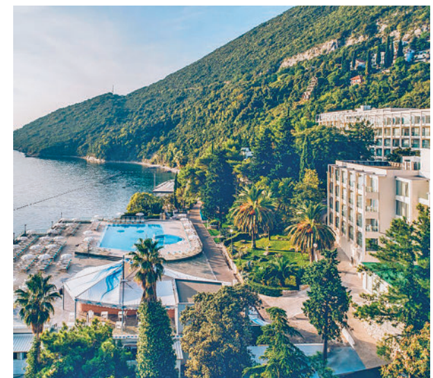
El turismo ha crecido este año