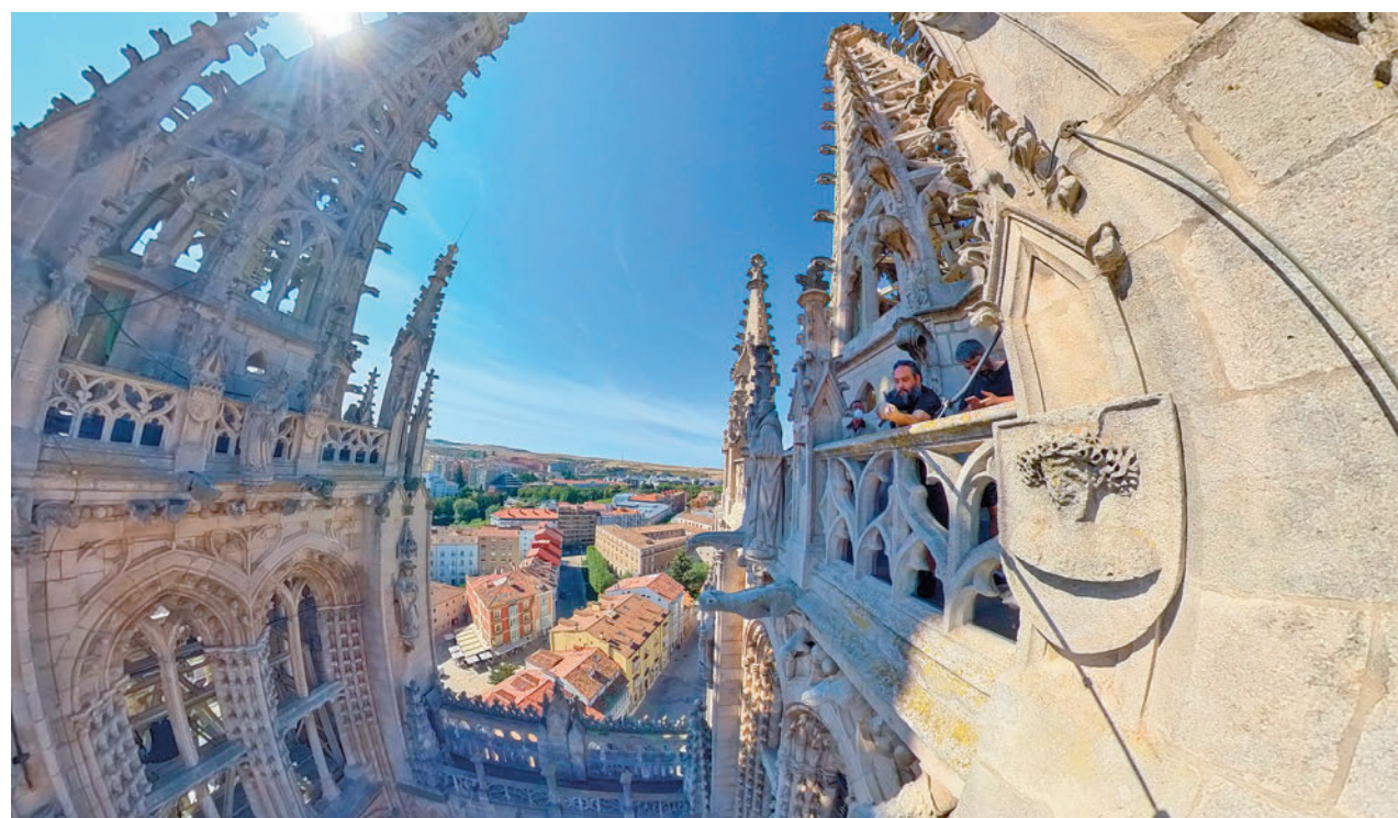
UNIVERSIDAD DE BURGOS