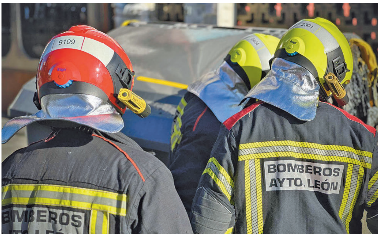
Bomberos de León durante una de sus intervenciones

En concreto, las entidades seleccionadas han sido la Asociación Amigos Síndrome de Down por su proyecto 'Pilates Down'; la Asociación Leonesa con las Enfermedades en la Sangre, por 'ALCLES te lleva al huerto'; la Asociación Salud Mental León por 'Un cenador para la salud'; la Confederación Española de Asociaciones de Atención a las Personas con Parálisis Cerebral por su proyecto 'El jardín de los cuentos'; Autismo León, por 'Proyecto SaludTEA'; y la Asociación Española contra el Cáncer por 'Voluntariado en acompañamiento en cuidados paliativos'. Asimismo, han sido seleccionadas la Asociación Valponasca y la Fundación de Familias Monoparentales Isadora Duncan, que continúan con varios proyectos de gran relevancia.