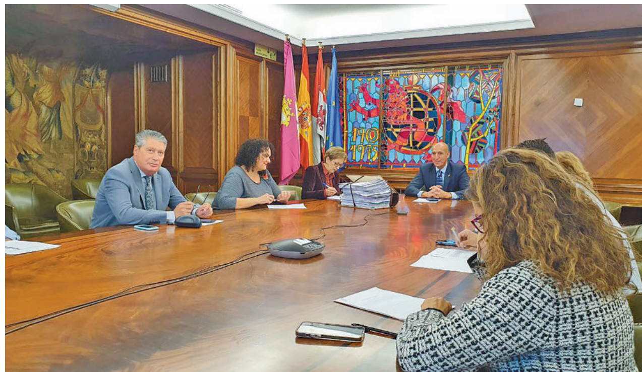
AYUNTAMIENTO DE LEÓN