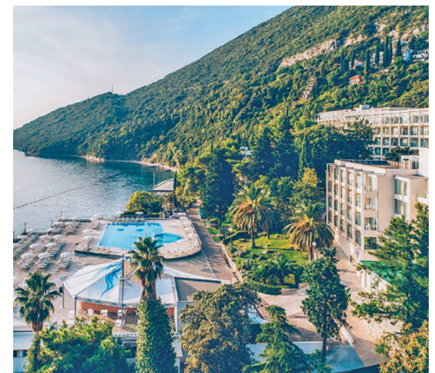
El turismo ha crecido este año

Respecto al incremento de la turismofobia, Morillo considera que cada territorio debe conseguir encontrar el equilibrio que mejor se ajuste en función de sus características entre los turistas y los residentes.