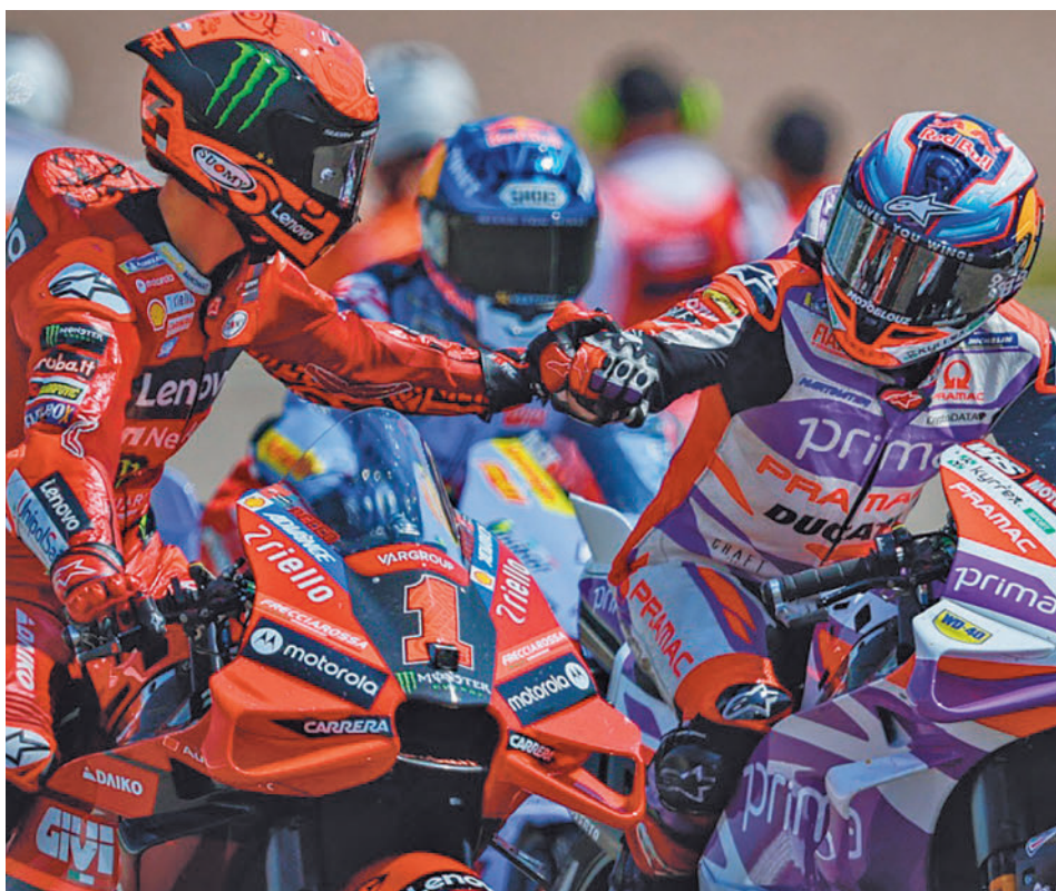
El piloto madrileño se la juega en las dos últimas pruebas del Mundial