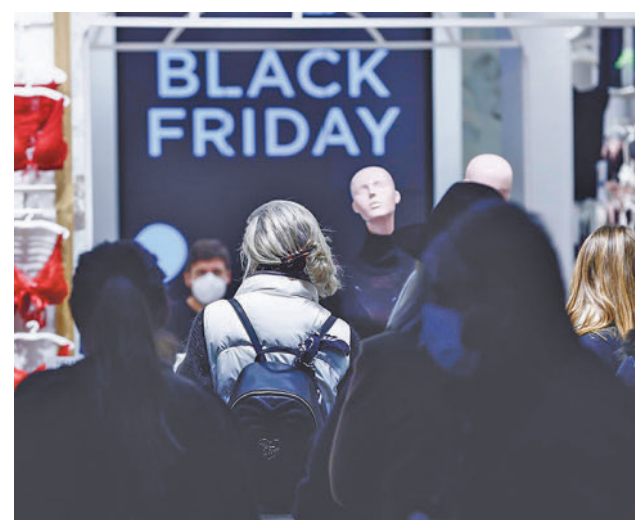
Compras en el Black Friday