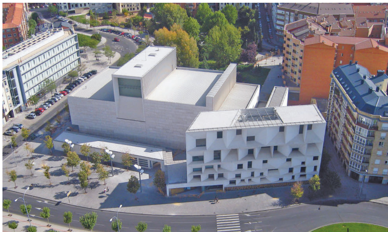
Imagen aérea del Auditorio Ciudad de León

Toda la información de León, en nuestra página web