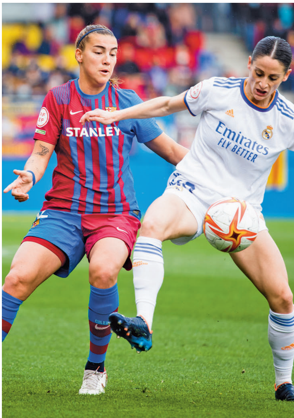
Patri Guijarro y Esther González, en un partido de la temporada 2021-2022

Paralluelo (6) y la danesa Signe Bruun (5) son sus máximas goleadoras.