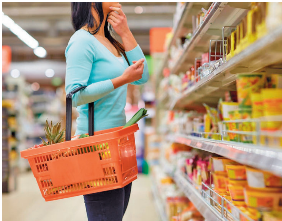
La inflación afecta a los hábitos de consumo

La reducción del gasto en la restauración ya lo perciben