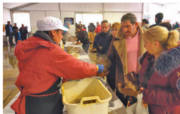
Feria de León DIPUTACIÓN DE LEÓN

La primera de ellas ha sido la Feria de la Cecina de Chivo de Vegacervera, también la Pasquilla de Quintana del Marco, la romería de la Virgen del Valle de Llamas de Cabrera y la festividad del Voto