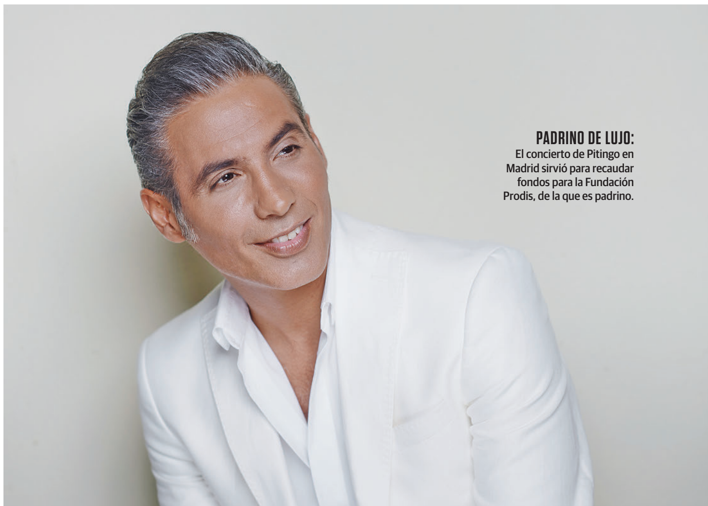
PADRINO DE LUJO: El concierto de Pitingo en Madrid sirvió para recaudar fondos para la Fundación Prodis, de la que es padrino.