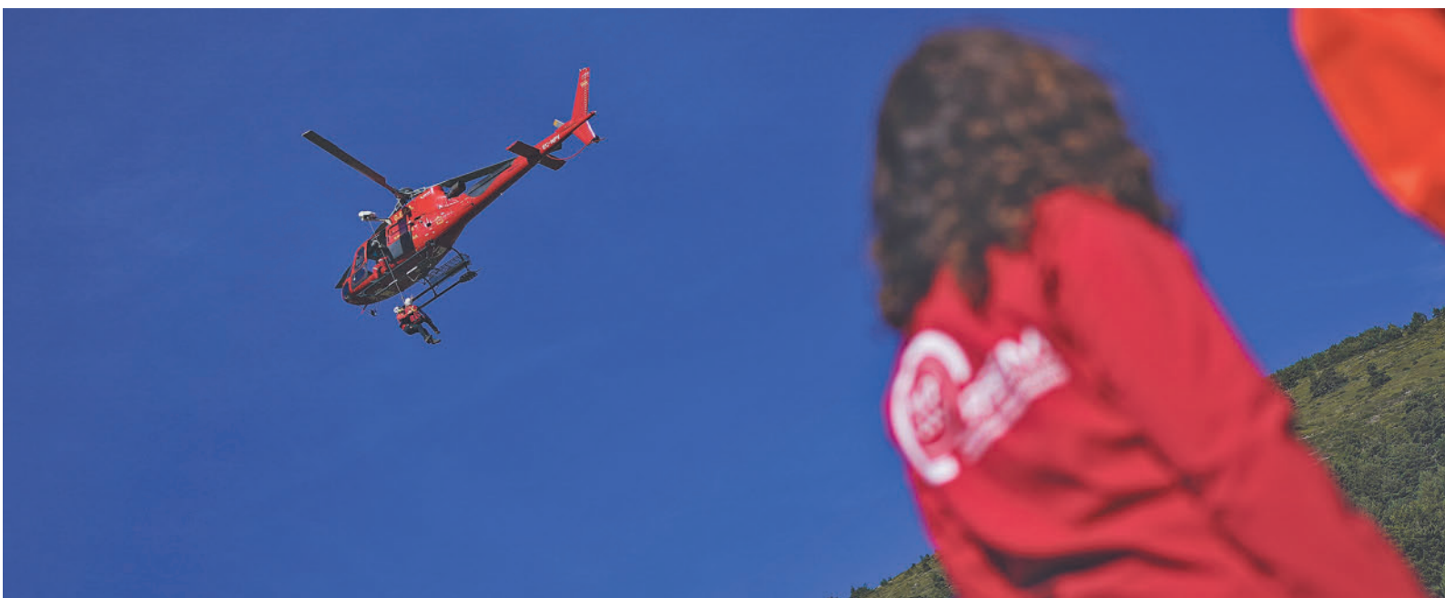
Isabel Díaz Ayuso observa uno de los helicópteros del dispositivo