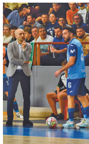
Triunfo vital en Córdoba