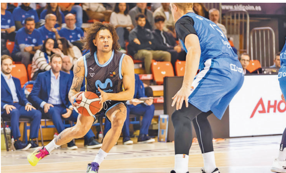
Triunfo cómodo de Estudiantes en el derbi