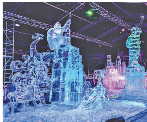
Una de las esculturas de la pasada edición

Toda la información de la zona Este, en nuestra página web.