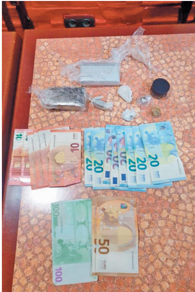
Las drogas y el dinero incautados en el bar POLICÍA LOCAL

TANTO FUERA COMO DENTRO DEL BAR SE CONSUMÍAN DROGAS