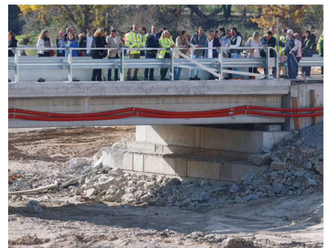
Uno de los nuevos puentes sobre el Alberche

“Se trata de unas obras que se han ejecutado en un tiempo récord, en dos meses, y se han invertido 35 millones de euros”, señaló el representante del Gobierno autonómico madrileño.