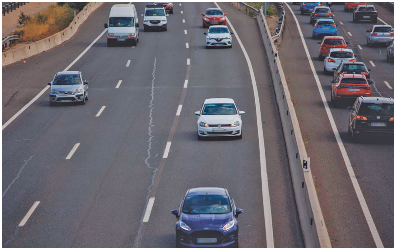
El mismo accidente es más dañino para las mujeres que para los hombres EUROPA PRESS

Garre también se refiere al conocido como 'efecto submarino', que es que "el cinturón de seguridad no sujeta bien, no recoge bien a la mujer y se produce un deslizamiento hacia abajo en el asiento, con lo cual el cinturón presiona la zona abdominal y puede producir lesiones graves". "Esto ocurre más en las mujeres que en los hombres porque es una cuestión de tamaño", señaló la portavoz.