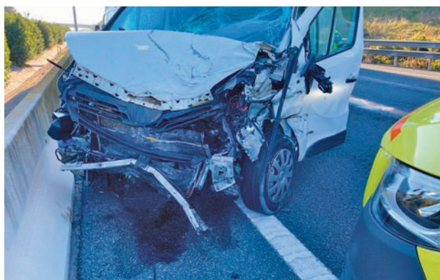
Accidente de tráfico

En cuanto a los accidentes en el trabajo que han resultado mortales registrados hasta junio, el 30% corresponde a accidentes de tráfico. El director territorial Centro de