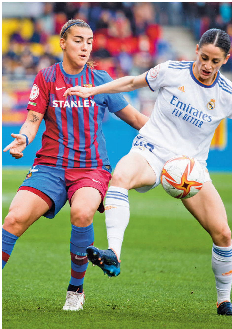
Patri Guijarro y Esther González, en un partido de la temporada 2021-2022

Las locales, que en la jornada previa se impusieron por 1-2 al Athletic, defienden la tercera posición, de la que se han hecho acreedoras gracias a los 18 puntos conquistados hasta la fecha, dos más que las colchoneras, que la semana pasada daban buena cuenta del Eibar: 3-0.