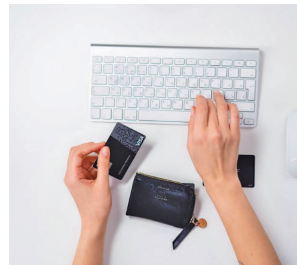
Mucho cuidado con el pago online

“No debemos olvidar que lo que está en juego es nuestro dinero y que, al igual que lo haríamos en una tienda física, hay que analizar la legitimidad de la venta, ya que los ciberdelincuentes son astutos en sus métodos. Antes de darle al botón de comprar, no olvides comprobar la URL del sitio y verificar que estás donde crees estar”, señala Avast.