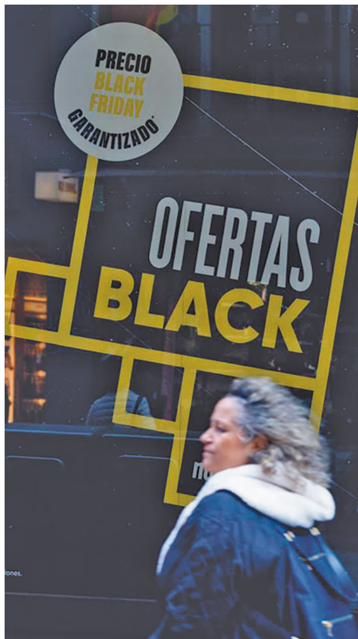
Compras durante el Black Friday

Una vez que llega el momento de adquirir lo que estábamos buscando, de nuevo va a ser un Black Friday muy digital, ya que el 44% de los entrevistados afirma que hará sus compras solo de forma online, por tan solo un 5% que lo hará únicamente en tiendas físicas, mientras que la mayoría (51%) optará