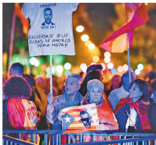
Una de las jornadas de protestas en Madrid

EL PERIÓDICO GENTE NO SE RESPONSABILIZA NI SE IDENTIFICA CON LAS OPINIONES QUE SUS LECTORES Y COLABORADORES EXPONGAN EN SUS CARTAS Y ARTÍCULOS