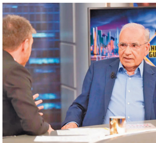
Alfonso Guerra, en 'El Hormiguero'

EL PERIÓDICO GENTE NO SE RESPONSABILIZA NI SE IDENTIFICA CON LAS OPINIONES QUE SUS LECTORES Y COLABORADORES EXPONGAN EN SUS CARTAS Y ARTÍCULOS