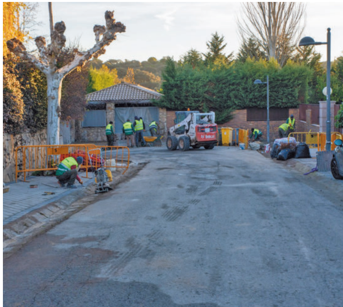
Los trabajos en la calle de Isla de la Toja

El Ayuntamiento de Boadilla del Monte sigue adelante con las obras de renovación del acerado en las urbanizaciones históricas del municipio. En este momento se están realizando en la calle de Isla de la Toja. Los trabajos incluyen la demolición de las aceras existentes o levantado de zona terriza, la renovación de aceras con subbase de hormigón y acabado de loseta hi-