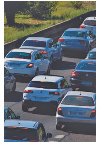
El límite es de 30 km/hora