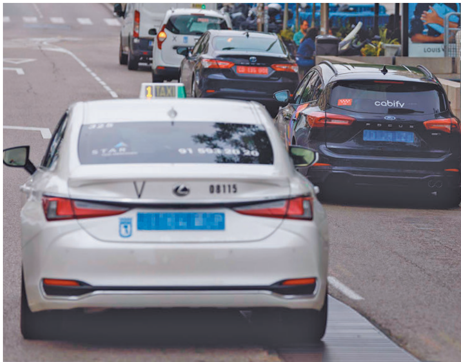
Taxi en el centro de Madrid junto a otros VTC

Otro de los nuevos aspectos es la incorporación del servicio de taxi compartido con precio cerrado. Con esta modalidad, un cliente tendrá la opción de contratar un trayecto de forma telemática y, durante el mismo, el vehículo podrá realizar paradas para