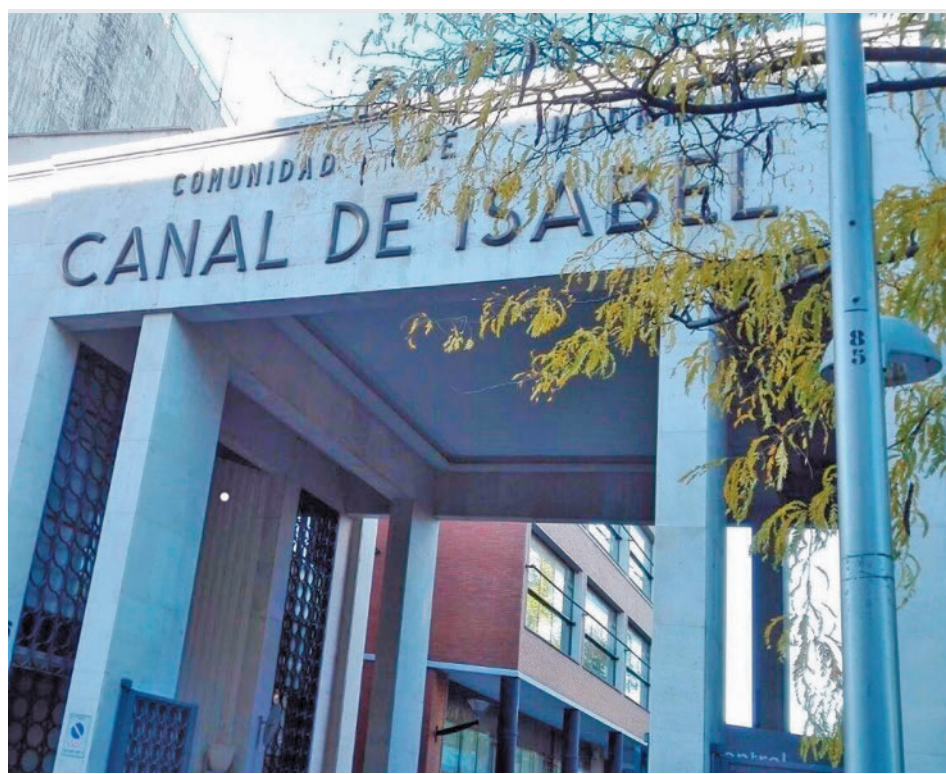
Instalaciones del Canal de Isabel II en Madrid

Así lo anunció la consejera de Economía, Hacienda y Empleo, Rocío Albert, que subrayó que “la mejor política social es el empleo, ya que permite que los ciudadanos puedan tomar sus propias decisiones, ser más libres y contribuir a la mejora de toda la sociedad”. Se implantará un sistema para impulsar la conexión de los demandantes de empleo con las ofertas y cursos disponibles, junto a un Portal de Formación para acceder de forma centralizada y única a toda la información y herramientas.