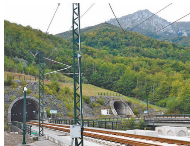
Uno de los túneles del tren Madrid-Asturias

La infraestructura que permitirá este nuevo hito es la nueva Variante de Pajares, un tramo de 50 kilómetros de longitud, de los que el 80% transcurren en túneles. Las obras han tardado 19 años.