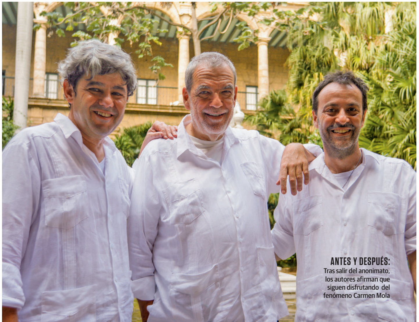
ANTES Y DESPUÉS: Tras salir del anonimato, los autores afirman que siguen disfrutando del fenómeno Carmen Mola