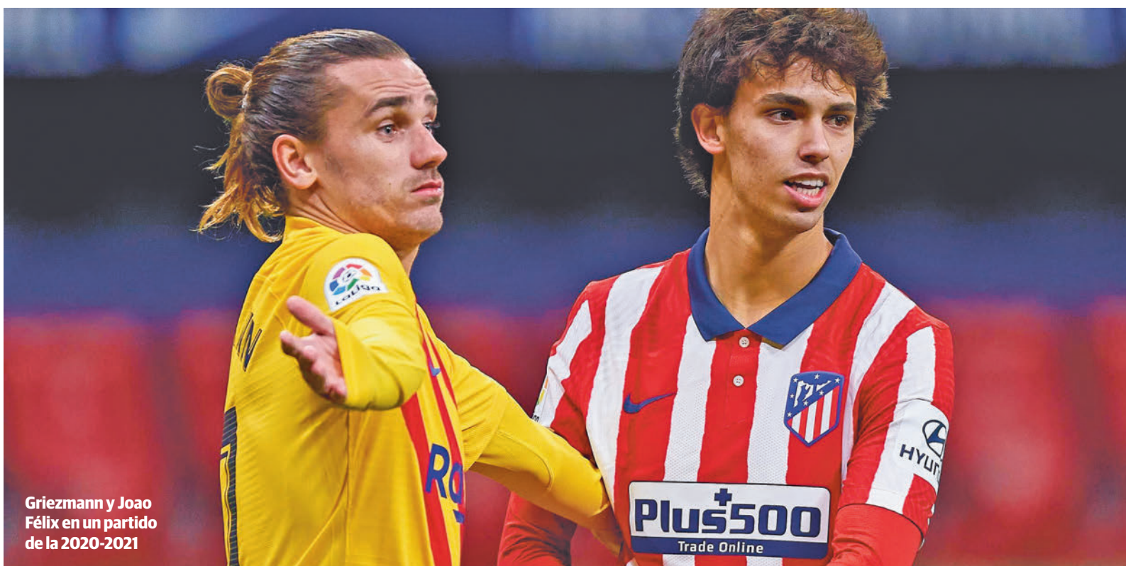
Griezmann y Joao Félix en un partido de la 2020-2021

re estará en el propio terreno de juego de Montjuic, con Joao Félix y Antoine Griezmann frente a frente. El jugador portugués se vistió de rojiblanco en el verano de 2019 para llenar el hueco dejado por Griezmann, que se convertía en la tercera pata del tridente que completaban Luis Suárez y Messi. La