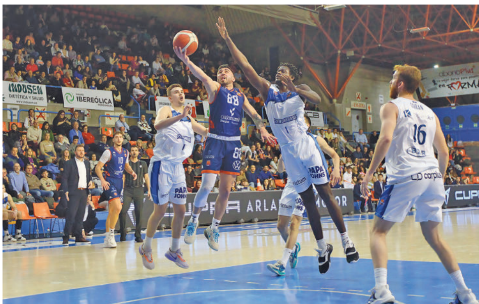
Dura derrota fuenlabreña en la cancha del Tizona