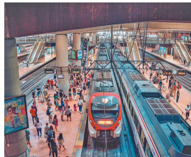
El túnel de Sol ya no sufrirá cortes

Adif ha anunciado que estará disponible a partir del día 23 ● Así, las líneas C3 y C4 y sus variantes recuperan la normalidad