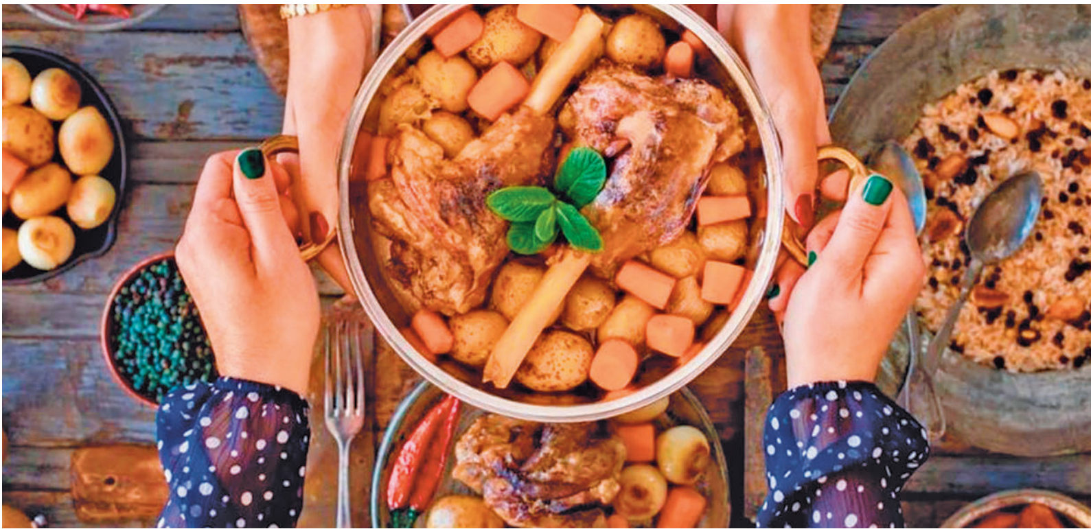
Las comidas y las cenas son una constante en las próximas semanas