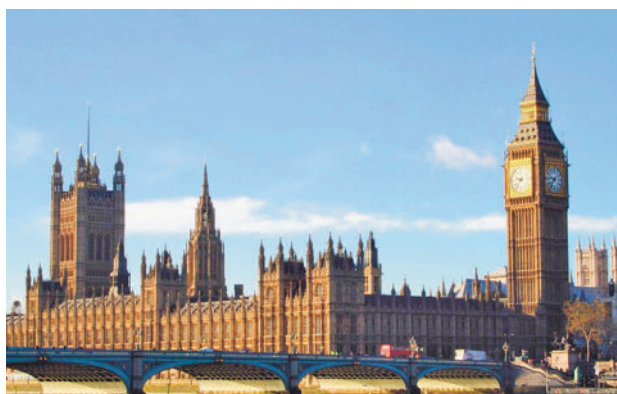
Londres es la ciudad con más reservas

bargo, este año se incrementa el interés por otros destinos no tan habituales: si en 2022 el tercer y cuarto país con más reservas entre los españoles fueron Reino Unido y Alemania, respectivamente, en 2023 Alemania desplaza a Reino Unido como tercer destino más popular, que pasa este