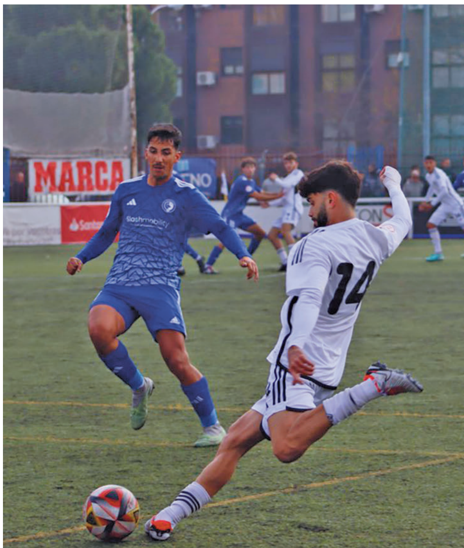
Canillas y Las Rozas firmaron uno de los resultados más repetidos

El corte respecto a la zona de promoción lo marca actualmente el Galapagar, que cerrará la jornada (16:30 horas) recibiendo al Pozuelo, decimotercero tras su reciente