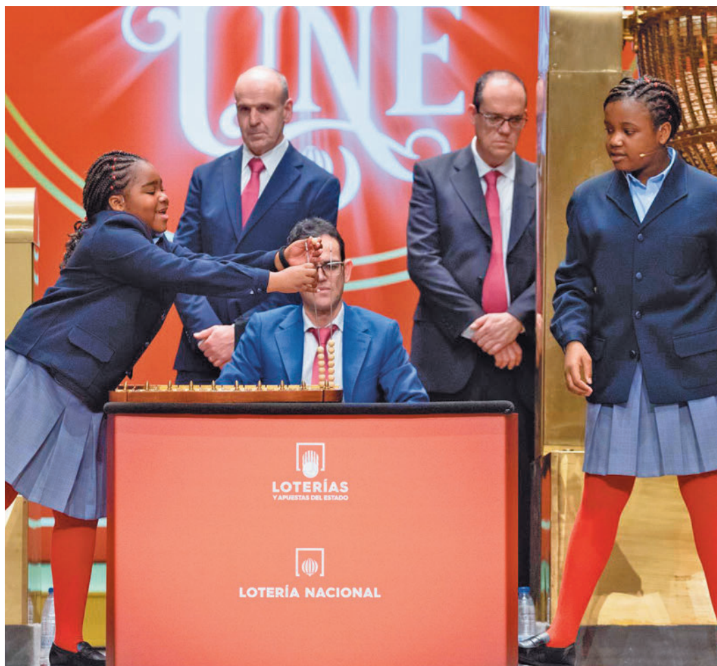
Dos niñas de San Ildefonso cantan premios el pasado año