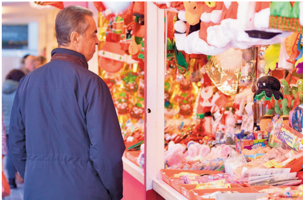
Mercadillo de Navidad en Madrid

En concreto, el estudio asegura que este año aumenta especialmente el presupuesto destinado para las cenas y las comidas con familiares, amigos y compañeros de trabajo, pasando de los 138 euros de 2022 a los 150 euros para este 2023. Algo parecido sucede con el gasto realizado en viajes y vacaciones (112