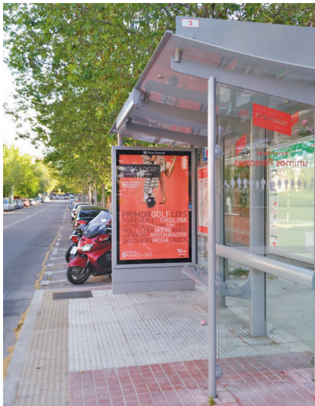
Imagen de archivo de una marquesina del Ensanche Sur

El objetivo de esta iniciativa es que los vecinos disfruten con seguridad, tranquilidad y comodidad de las fiestas navide as, seg n explic  la concejala de Transici n Ecol gica, Movilidad, Educaci n y