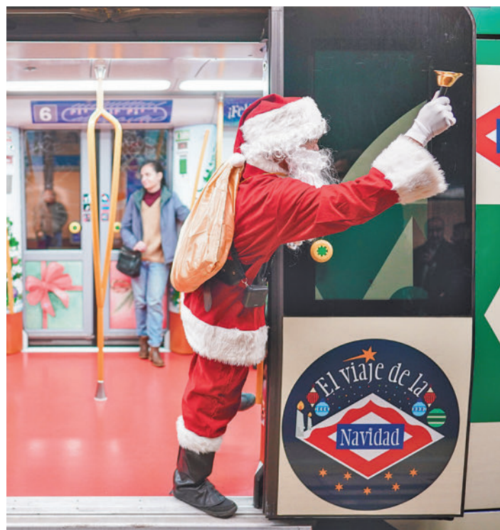
Papá Noel animando a los usuarios en el Tren de la Navidad CAM

Para saber horarios concretos, según la parada, la compañía de Metro informará a través de su perfil en X -antes Twitter-, del recorrido aproximado de los trenes para que los pasajeros que quieran su-