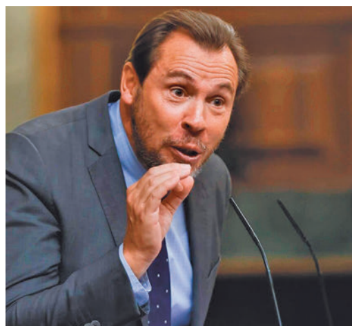
Puente, durante una intervención en el Congreso

EL PERIÓDICO GENTE NO SE RESPONSABILIZA NI SE IDENTIFICA CON LAS OPINIONES QUE SUS LECTORES Y COLABORADORES EXPONGAN EN SUS CARTAS Y ARTÍCULOS