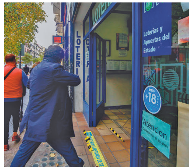
Administración de lotería E. P.

Si se comparte un décimo, hay que identificar a todos los participantes a la hora de cobrar los premios iguales o superiores a 2.000 euros en las entidades financieras.