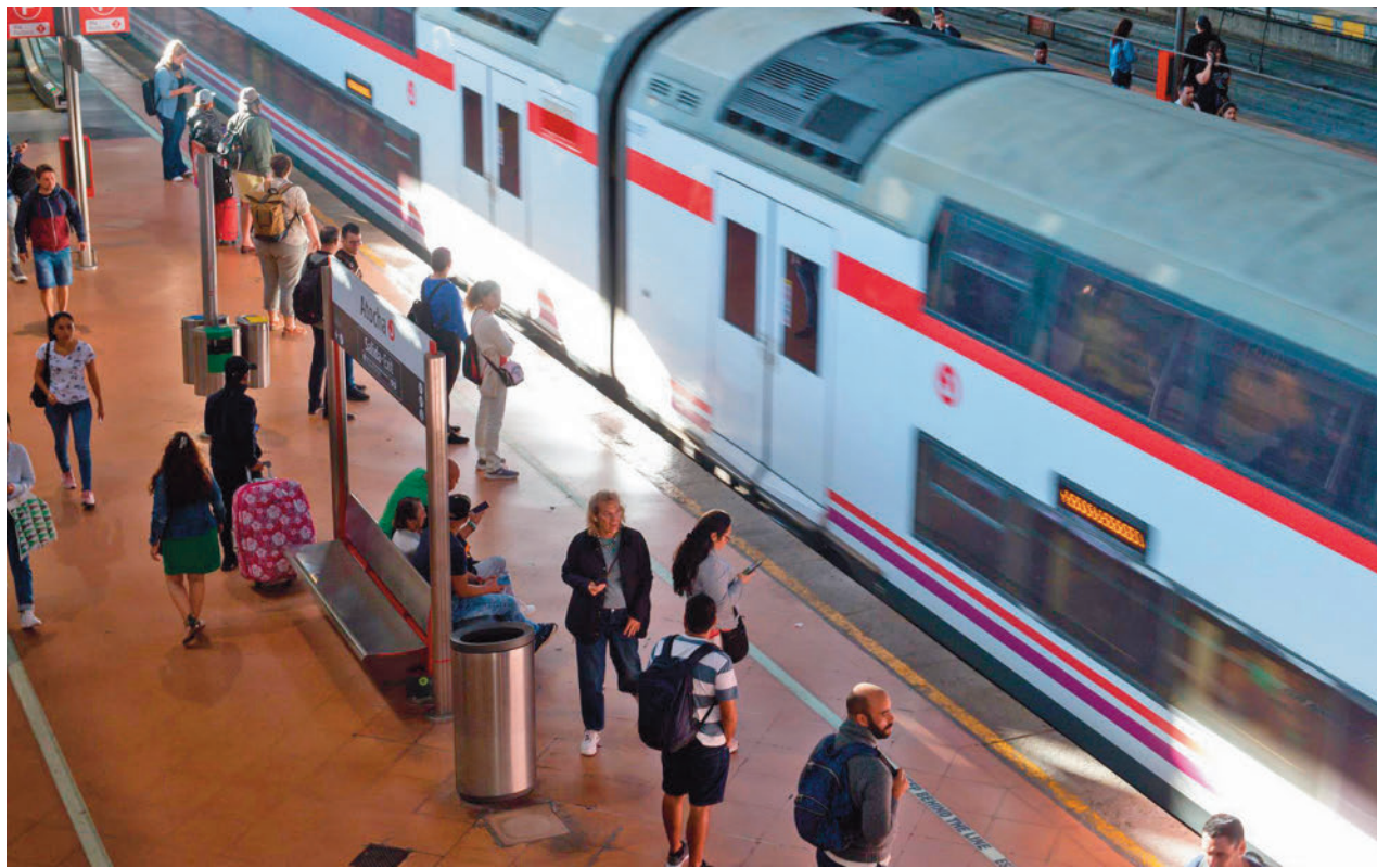
Tren de Cercanías en la estación de Atocha

Una vez finalizada la transformación de Chamartín, la estación podría gestionar entre un 25% y un 30% más de viajeros, hasta 900 trenes diarios. Con una inversión de