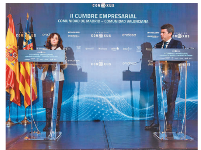
Isabel Díaz Ayuso y Carlos Mazón

Mazón, por su parte, se refirió a la ampliación del puerto de Valencia, que definió una estrategia "de país" y "urgentísima" tanto para la Comunitat Valenciana y para Madrid como para toda Europa, por lo que ha agradecido el apoyo del empresariado valenciano y madrileño en esta cumbre. Señaló que "no van contra nadie".