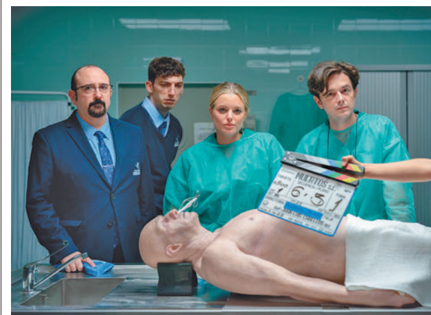
Primera imagen del rodaje de 'Muertos SL' MOVISTAR PLUS

Toda la actualidad de Alcorc n, en nuestra p gina web