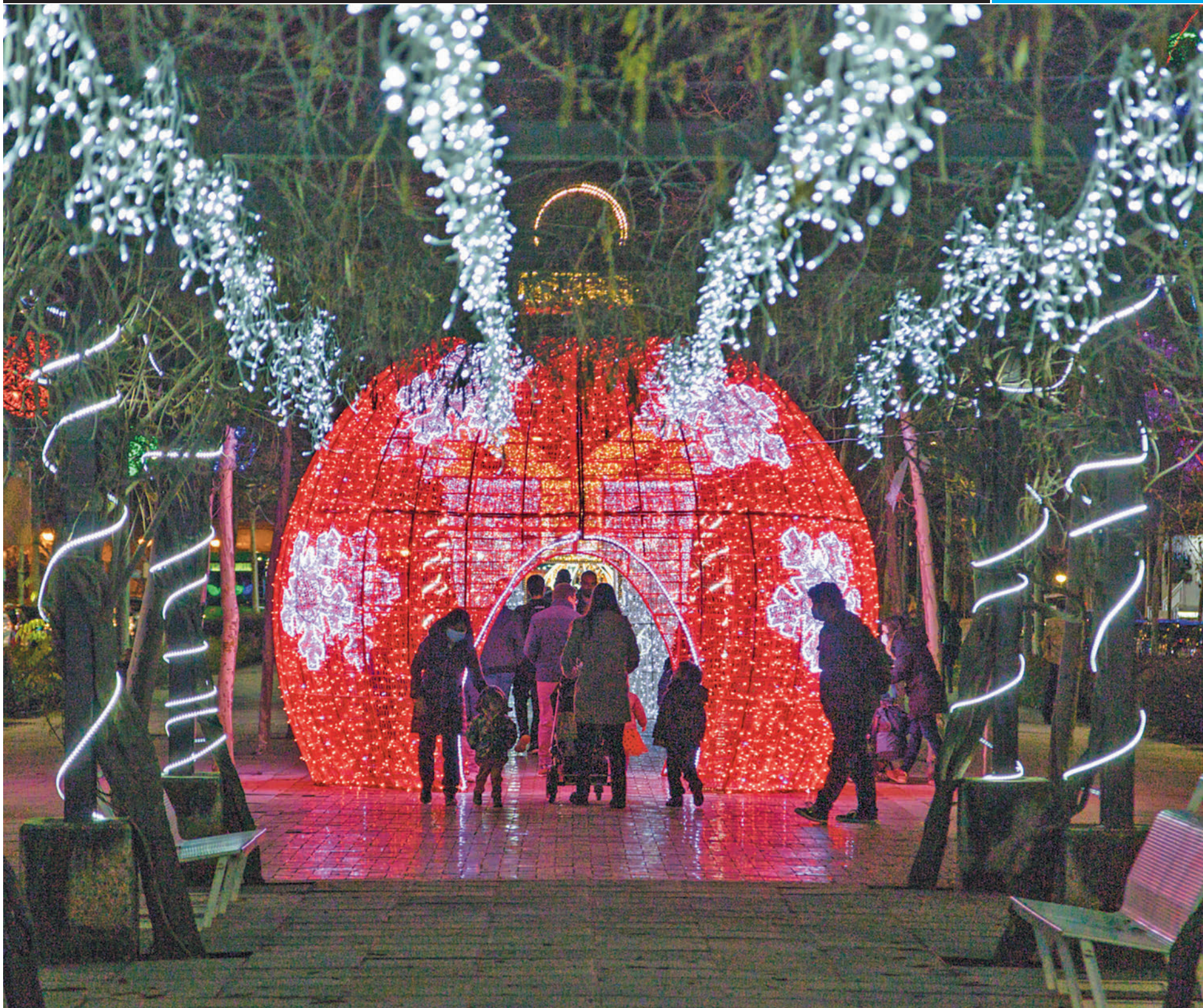
La iluminación navideña dota de un colorido especial a las calles de la localidad