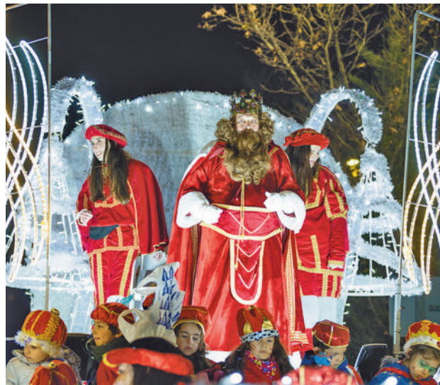
Desfile de la Comitiva Real el pasado mes de enero

tensidad estas fechas es, sin duda, la infantil. Para ella el Ayuntamiento ha reservado una parte destacada de la programación, con la actuación de 'Yo soy ratón' como uno de los platos fuertes el día 28 en el Auditorio del Centro Cultural, un espacio que también acogerá varias representaciones de títeres. Fuera de allí, en el nuevo parque del King Kong y en el del Caballo en Soto de Viñuelas, se sucederán espectáculos de magia, animación y globoflexia.