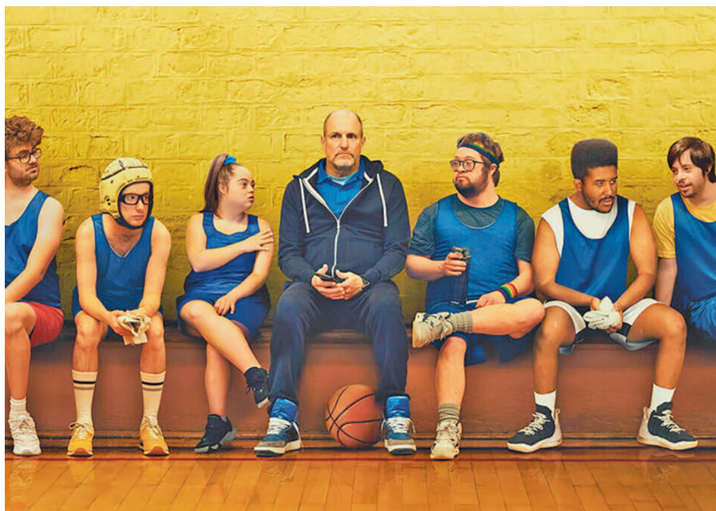
Woody Harrelson protagoniza la adaptación norteamericana de 'Campeones'

También este 15 de diciembre llega a las salas españolas 'Champions', la adaptación estadounidense de 'Campeones' dirigida por Bobby Farrelly y en la que Woody Harrelson encarna al mismo entrenador que Javier Gutiérrez. En esa línea de títulos para disfrutar en familia se pue-