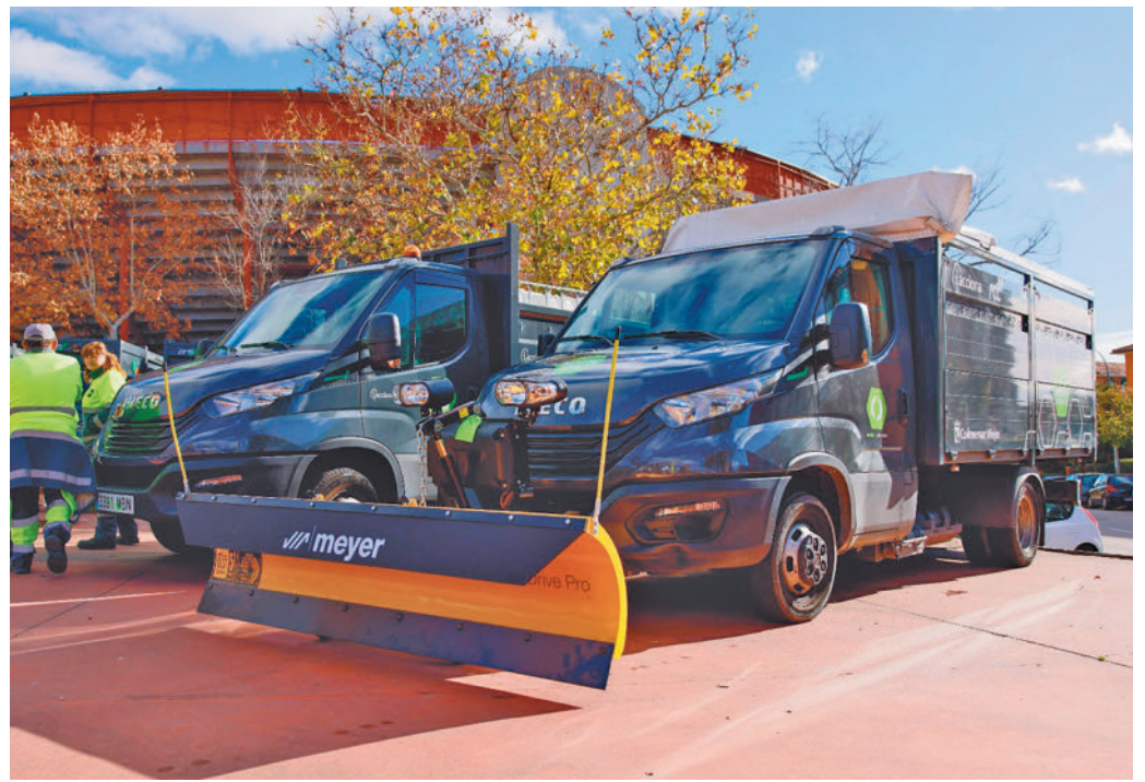
Presentación de los vehículos en los aledaños de la Plaza de Toros AYUNTAMIENTO DE COLMENAR

De este modo, se han incorporado tres baldeadoras de última generación, destinadas a la limpieza de la calzada con agua a presión; seis barredoras encargadas de retirar y agrupar los restos para