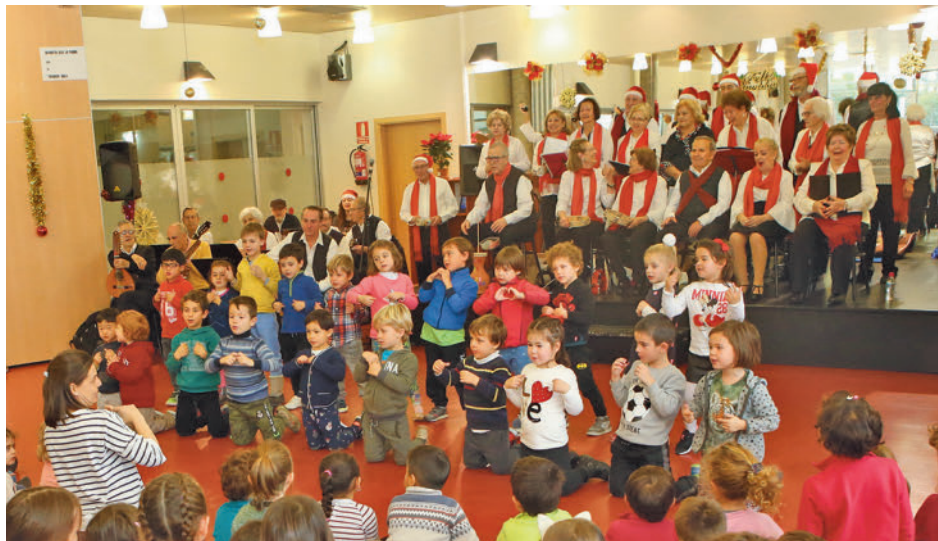
El Encuentro Intergeneracional siempre brinda momentos especiales

propuesta para chicos y chicas de entre 11 y 17 años para disfrutar en la Casa de la Juventud de diferentes actividades. Precisamente ese viernes 29 tendrá lugar las Preuebas, una forma diferente de despedir el 2023 y dar la bienvenida al 2024. El Espacio Ferial se suma las celebraciones con