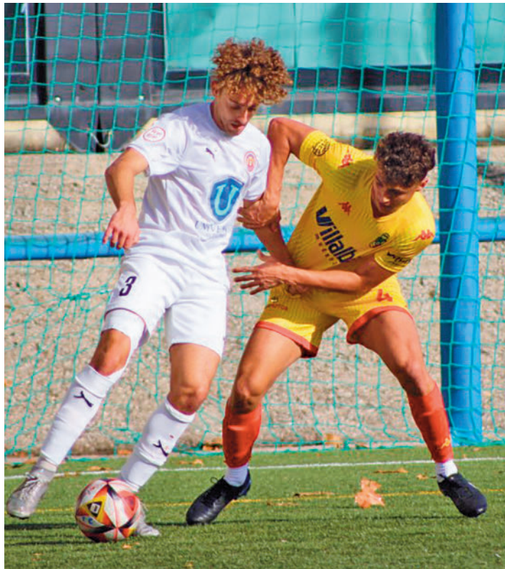
El Tres Cantos cayó en casa con el CUC Villalba

La última jornada del 2023 depara una visita tricantina a Navalcarbón, el feudo de uno de los equipos que están en ese nutrido pelotón a medio camino entre la ambición de soñar con el 'play-off' de ascenso y la preocupación de la cercanía con el descenso a Preferente. Buena ocasión por tanto para que el Tres