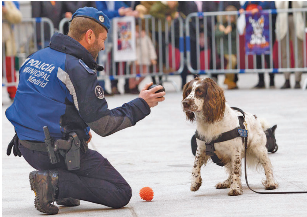
La exhibición de la Sección Canina de la Policía Municipal del pasado año

Este sábado 13, a las 10 de la mañana, se abrirán las puertas de la Galería de Cristal para acoger las propuestas que se van a realizar durante el fin de semana. La primera de ellas será la exhibición de la Unidad Canina de la Policía Nacional (11 horas). Tras el pregón, llegará la demostración de la Sección Canina de