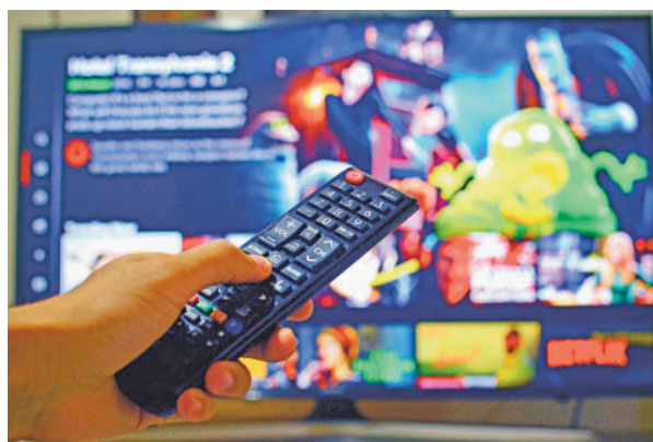
Netflix, HBO o Movistar Plus, algunos nuevos gastos

día a día. Así lo refleja el Informe Europeo de Pagos de Consumidores de Intrum, que tiene como objetivo analizar la situación financiera de los ciudadanos en 20 países europeos. En este sentido, el documento recoge que el 52% de los encuestados