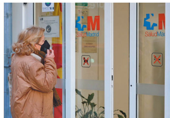
Una mujer entra en un centro de salud.

población sino con rigor". Matute explicó que en esta temporada se han dado 37.860 casos de gripe y durante la primera semana de este año la tasa se ha situado en 177 casos por cada 100.000 habitantes. La consejera apuntó que,