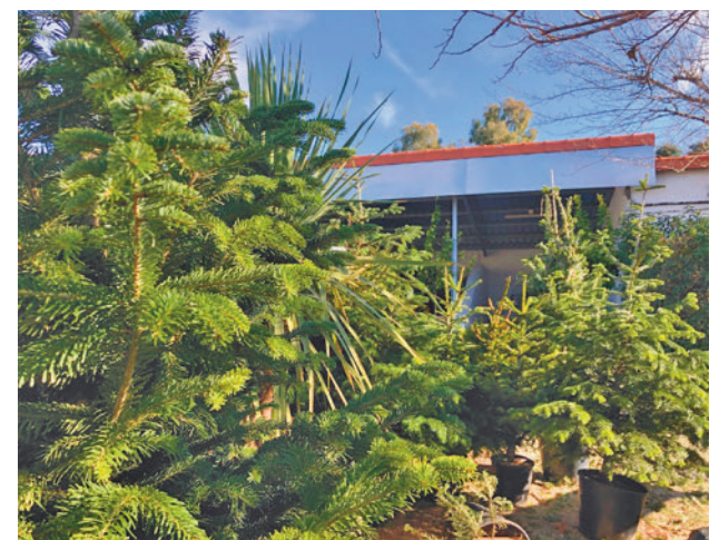
El vivero de la Casa de Campo

Cada abeto no recuperable, 411 unidades el año pasado, se tradujo en unos cinco kilos de compost, llegando a un total de 2 toneladas para usar en zonas verdes.