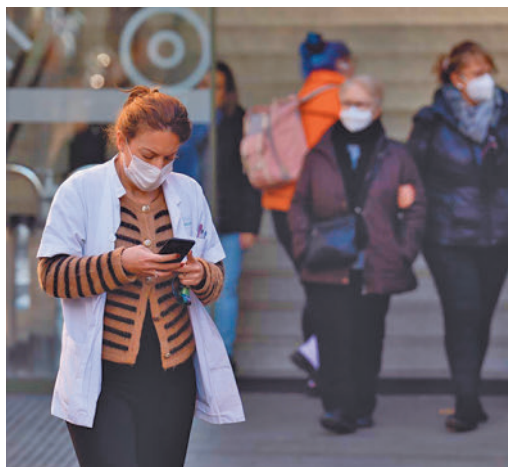
Las mascarillas, de nuevo protagonistas

EL PERIÓDICO GENTE NO SE RESPONSABILIZA NI SE IDENTIFICA CON LAS OPINIONES QUE SUS LECTORES Y COLABORADORES EXPONGAN EN SUS CARTAS Y ARTÍCULOS