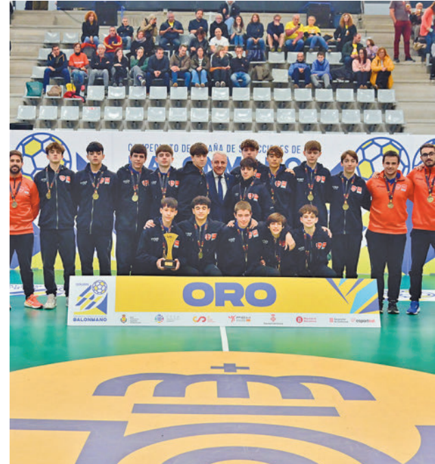
El combinado infantil masculino posa con la Copa

En categoría cadete, el combinado femenino firmó una notable actuación con la quinta plaza, mientras que el masculino se llevaba la medalla de bronce tras quedarse a las puertas de la gran final. En juvenil, el equipo femenino terminaba en décima posición, pero sumando una plata en la Copa, mientras los chicos acababan séptimos.