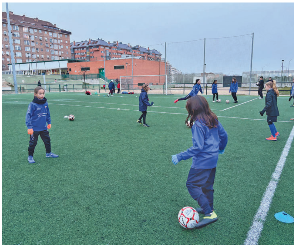
Las jugadoras del Oroquieta, en un entrenamiento

Toda la actualidad de los distritos de Madrid, en nuestra web