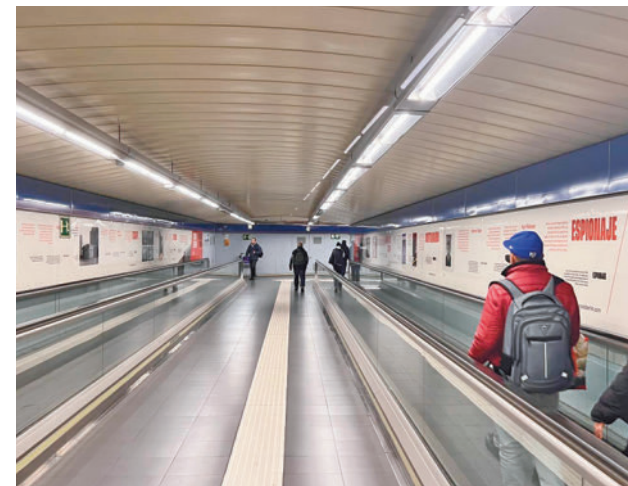
Estación de Metro de Madrid

La actuación en el suburbano está financiada por los fondos Next Generation de la Unión Europea.