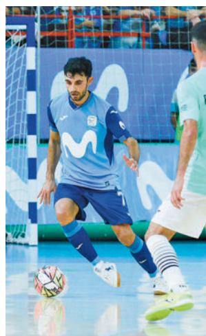
Doble cita en el Garbajosa

ta este sábado 13 (21 horas). Será en el Jorge Garbajosa de Torrejón de Ardoz, un pabellón en el que se vivirá uno de los partidos con más historia