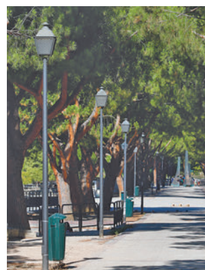
El parque de Pradolongo

En el primero de ellos, con un presupuesto de 2,1 millones de euros, se han plantado 268 árboles y casi 24.000 arbustos. Por su parte, en el segundo se han invertido 1,1 millones de euros para crear