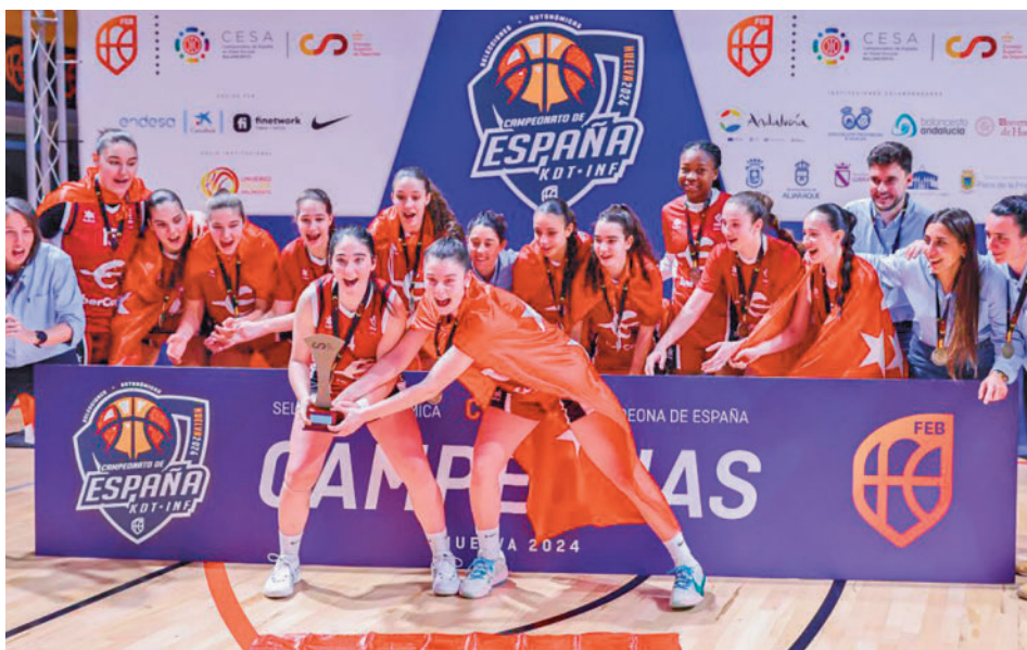
Las jugadoras del equipo cadete se hicieron con el título de campeonas