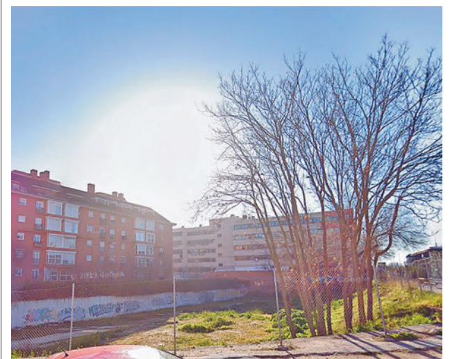
El terreno cedido a la Comunidad del Cordero GOOGLE MAPS