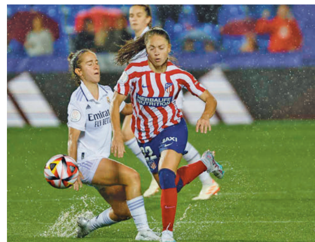
Butarque ya albergó la última final de la Copa de la Reina

preparar la Supercopa de España, un torneo que se celebrará en el estadio de Butarque. La primera entrega llegará el martes 16 (19 horas) con la semifinal entre el Atlético y el Levante. Justo 24 horas después habrá un 'Clásico' entre Barcelona y Real Madrid. La gran final está programada para el sábado 20, también en el estadio pepinero.