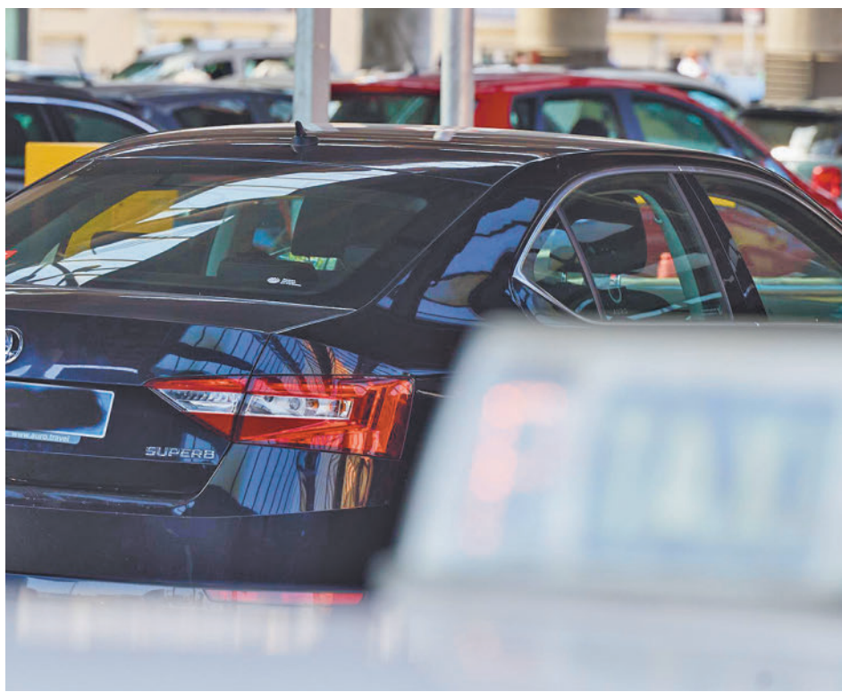
Vehículo VTC en la Comunidad de Madrid

En total, en España se generarán más de 113.000 nuevos contratos, lo que supone 8,5% menos que en 2023, cuando se registraron cerca de 124.000 firmas. El comercio agrupará el 65% de la oferta total, con más de 73.000 vacantes en 2024, lo que supone un 2,5% respecto al año anterior cuando se registraron cerca de 71.250 puestos de trabajo.