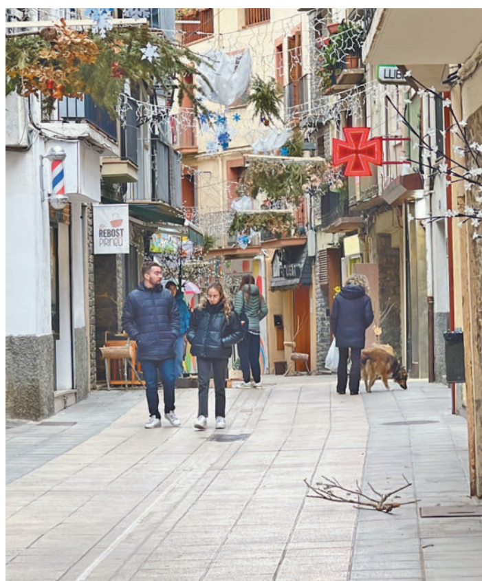
L'esforç per pagar el pis està en màxims històrics.

L'estudi no fa cap referència la regulació de preus impulsada per la Generalitat, que va acabar suspesa pel Tribunal Constitucional, i tampoc a la llei d'habitatge estatal aprovada abans de les últimes eleccions al Congrés dels Diputats. En tot cas, Ro-