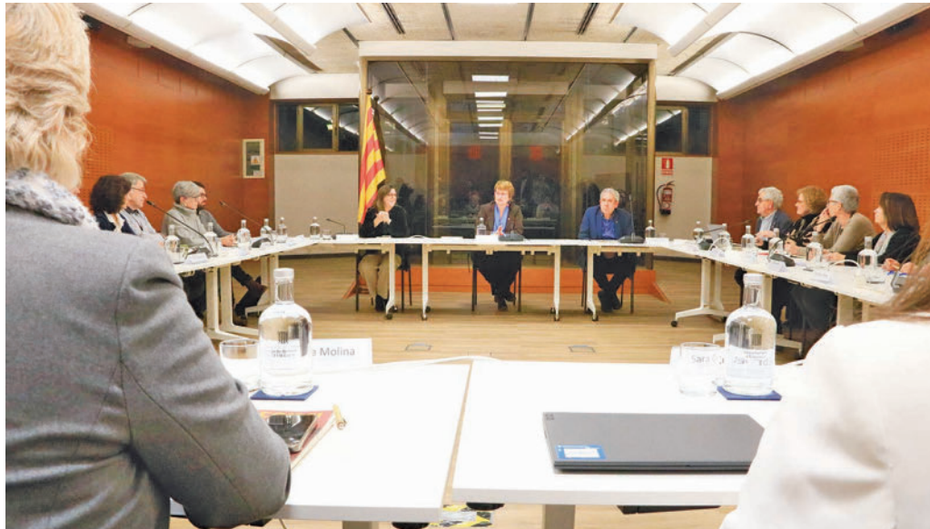
La segregació escolar s'ha reduït un 20% a Catalunya.

L'increment per a aquest capítol es negocia en el marc de l'alarma social que han creat els resultats de l'últim