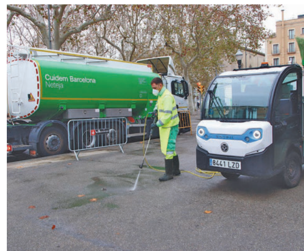
La prioritat de reg serà l'arbrat viari i les palmeres.