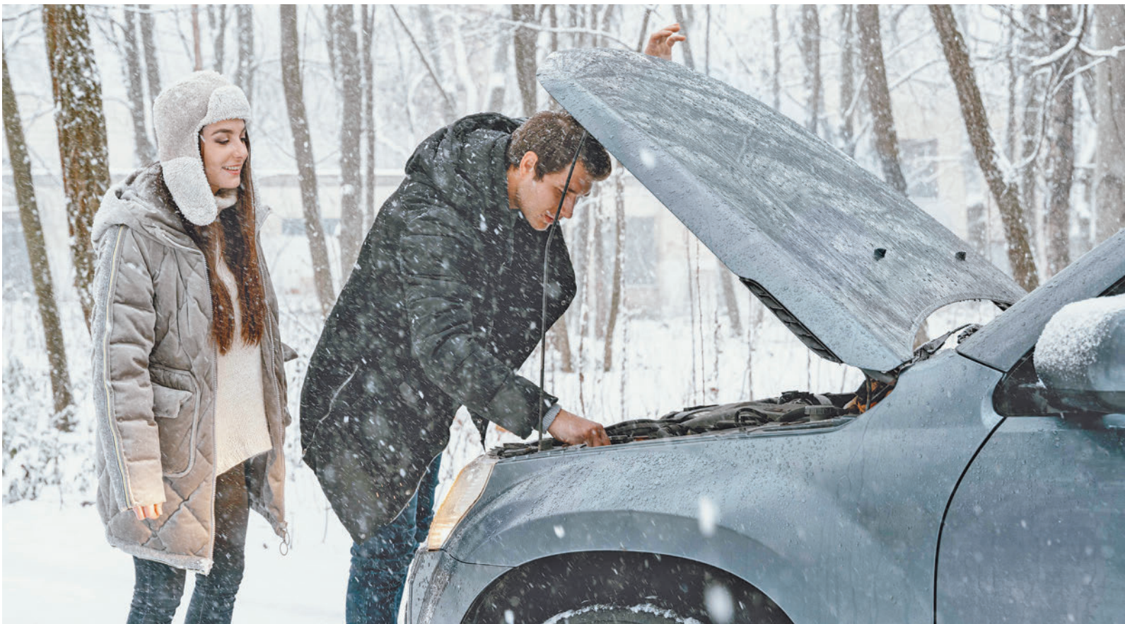
La batería y el motor son dos de las partes que más sufren en invierno