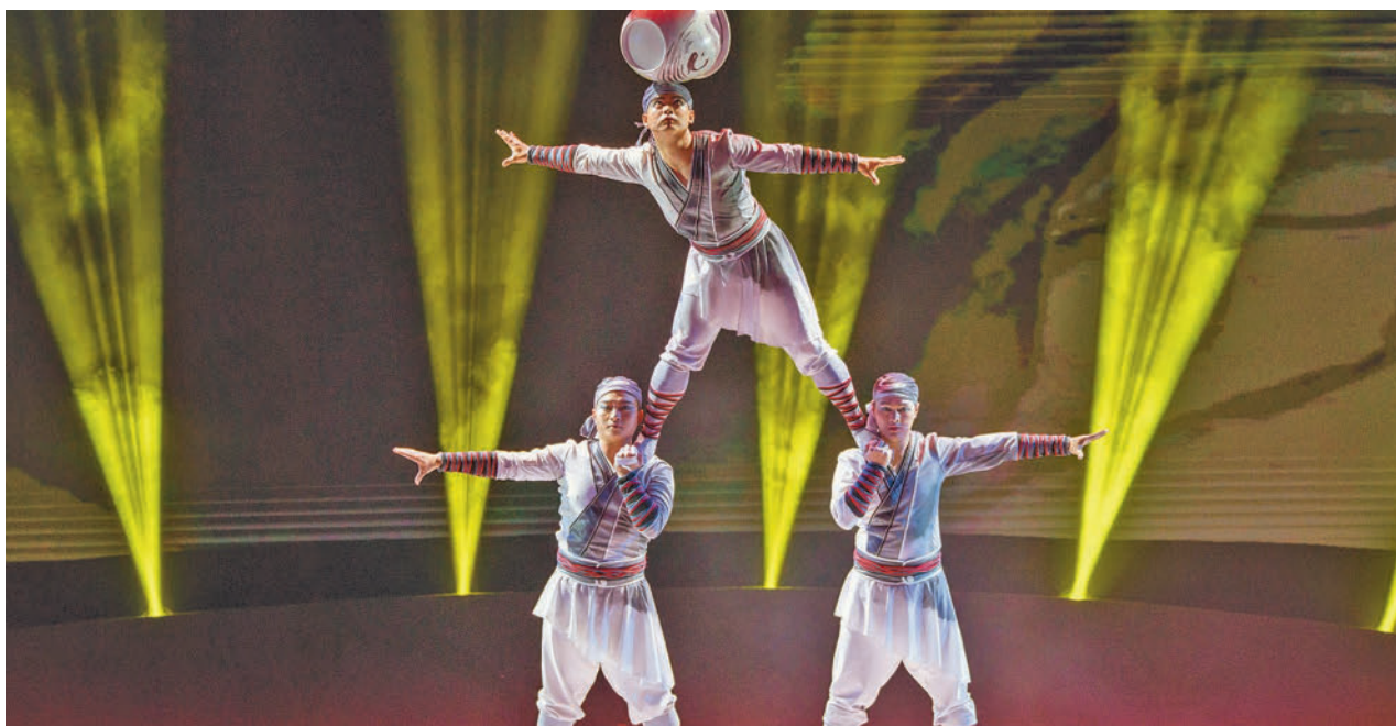
Un any més el certamen pretén acostar el circ de primera divisió internacional a tots els segments de públic. ACN