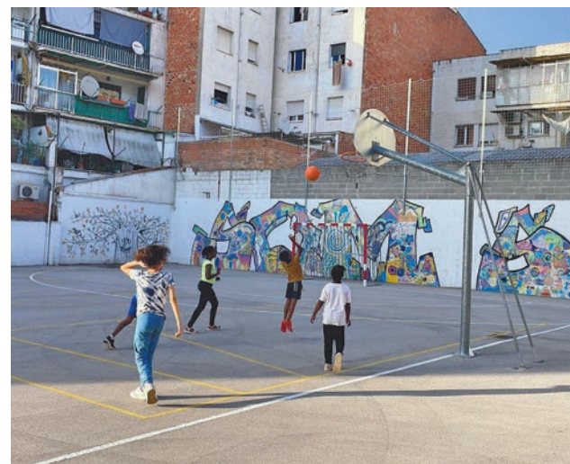
Es vol millorar la comprensió lectora dels alumnes.

La banda madrileña Tu Otra Bonita cuenta a GENTE detalles de su próximo disco, 'Quieres rollo?'