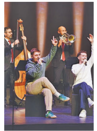
The Tyets. ACN

La segona posició és per 'Mussegu' (Halley Records) de Figa Flawas, mentre que completa el podi el mateix duet mataroní amb un segon hit que també ha gaudit d'un gran èxit: 'Olivia'. Aquestes dues no són les úniques cançons que el grup ha acon-