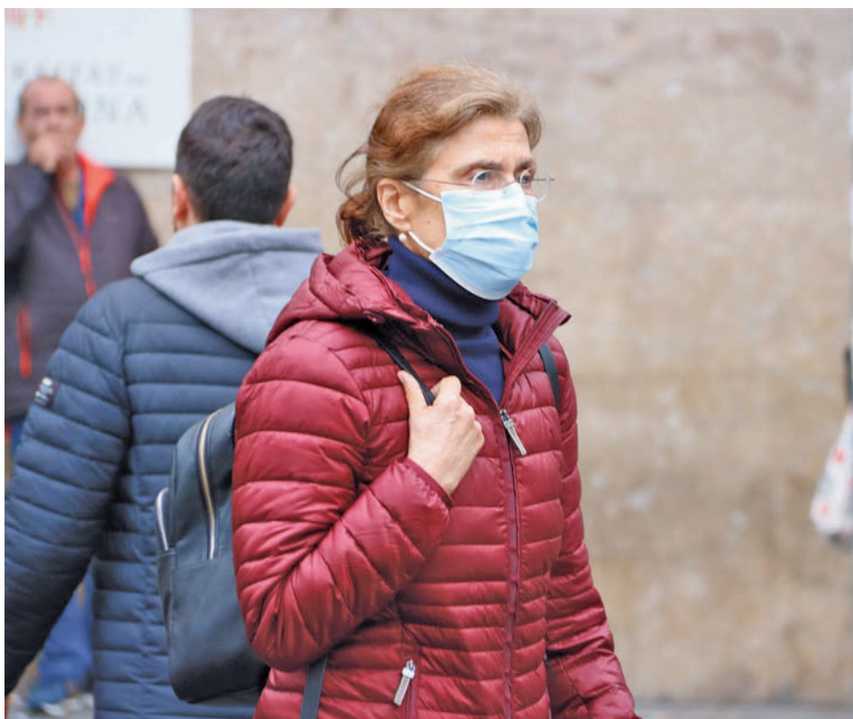
Es tracta d'una mesura que ja es va implementar durant l'estat d'alarma.