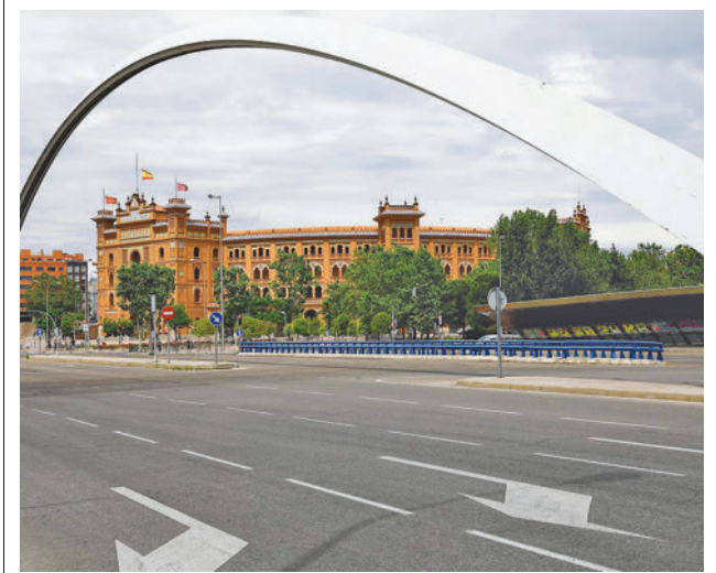
El entorno de la plaza de toros de las Ventas