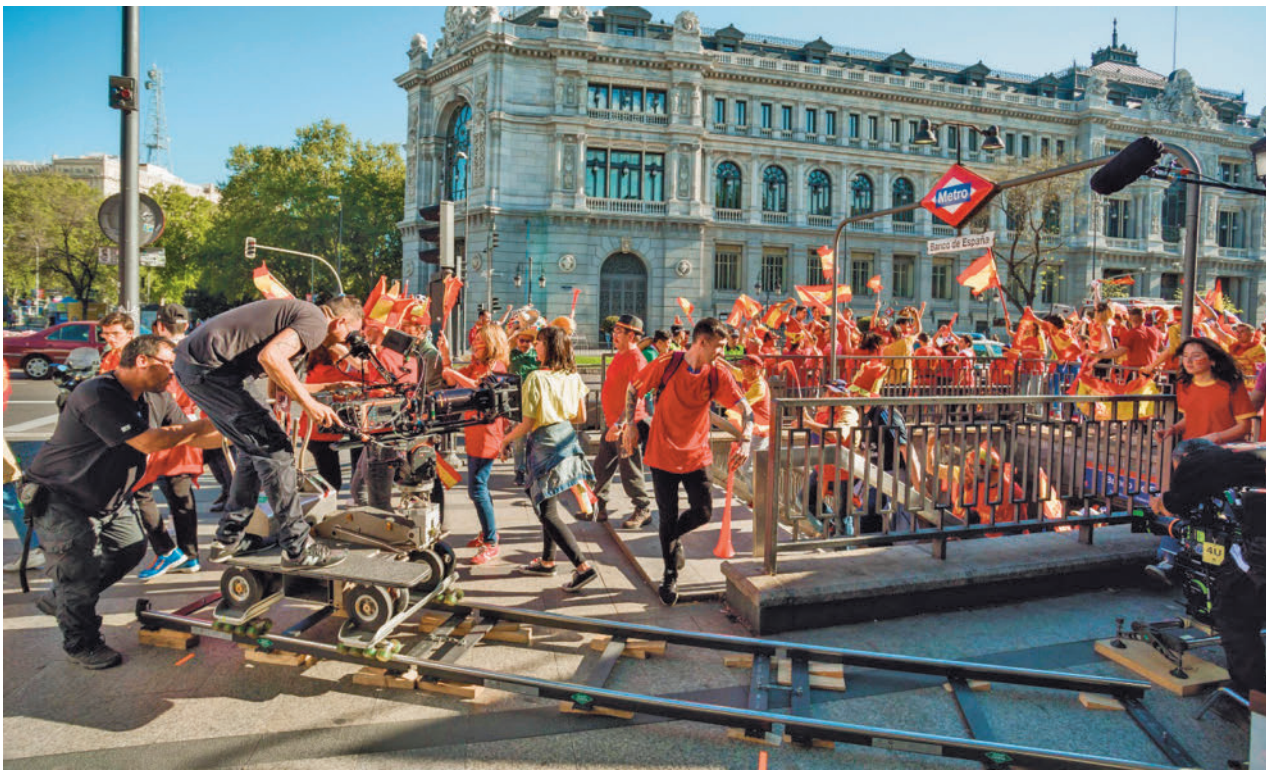
El rodaje de 'Todos los nombres de Dios' en la Gran Vía