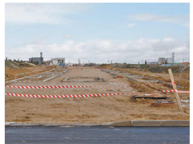
Las obras de urbanización, con el Ensanche al fondo

La construcción de Valdecarros está dividida en 8 fases en las que está previsto levantar 51.000 pisos, de los que el 55% tendrán algún tipo de protección. Los trabajos de urbanización de la primera etapa acabarán en el primer trimestre de este año.