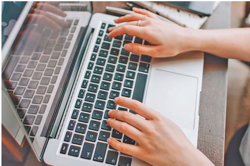
Muchos españoles se plantean sus hábitos digitales con el nuevo año

En concreto, un estudio realizado por la empresa especializada en seguridad digital Kaspersky señala que un 42% de los encuestados se han planteado esta cuestión de cara al Año Nuevo. Entre los principales propósitos digitales, destaca hacer una desintoxicación digital reduciendo el tiempo de pantalla como parte de su rutina (25%). Le sigue utilizar con-