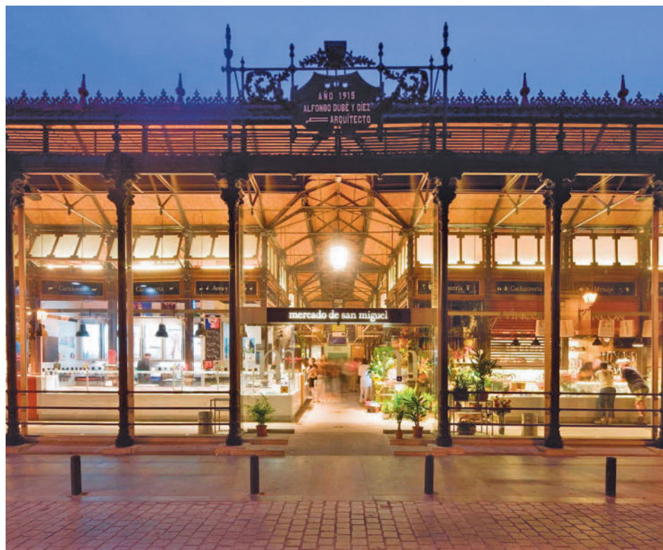
Una de las fachadas del Mercado de San Miguel

Toda la actualidad de los distritos de Madrid, en nuestra web