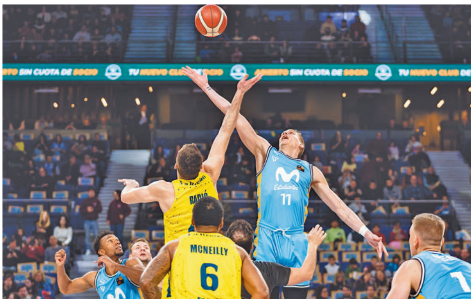
Dos citas consecutivas para el Estudiantes en el WiZink Center MOVISTAR ESTUDIANTES