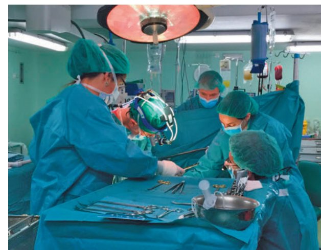
Trasplante en la Comunidad de Madrid

En total, la Comunidad ya suma 21.045 trasplantes realizados desde que se dispone de datos en 1990, gracias a la labor de los equipos profesionales de la sanidad pública madrileña, coordinados por la Oficina Regional de Trasplantes (ORCT) y la Organización Nacional (ONT).