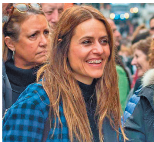
La actriz Itziar Ituño

EL PERIÓDICO GENTE NO SE RESPONSABILIZA NI SE IDENTIFICA CON LAS OPINIONES QUE SUS LECTORES Y COLABORADORES EXPONGAN EN SUS CARTAS Y ARTÍCULOS