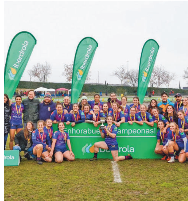
La plantilla majariega posa con el título

Después de esa alegría, este sábado regresa la Liga Iberdrola con visita a la Ciudad Deportiva del Valle de las Cañas, feudo de un Olímpico de Pozuelo que es penúltimo con 5 puntos. Por su parte, el Silicius Ruby Majadahonda es segundo. La cita tendrá lugar este sábado 20, a partir de las 16 horas.