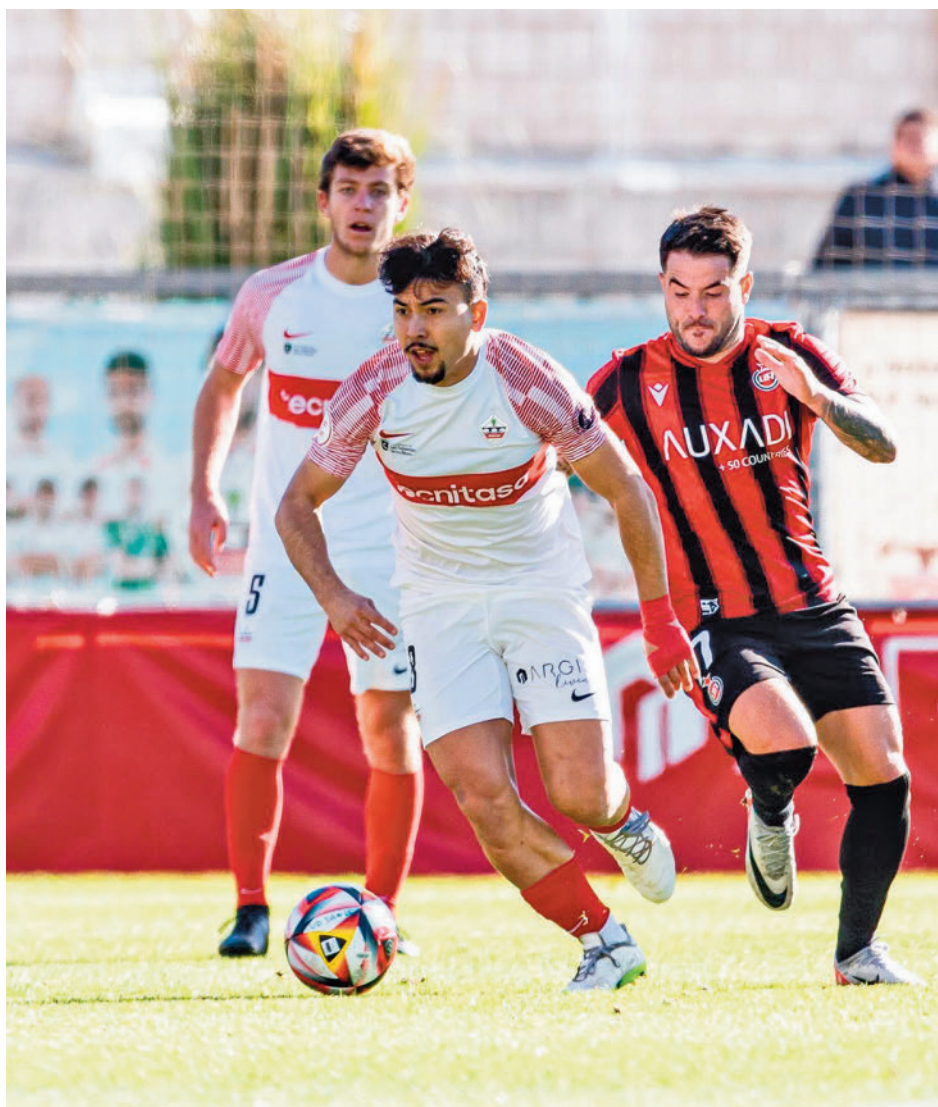
El Sanse se está mostrando muy sólido, especialmente en Matapiñonera

Mejor le van las cosas al Getafe B, que con 29 puntos está igualado al Illescas, el equipo que delimita en estos momentos la zona de 'play-off' de ascenso. Desde la llegada al banquillo de Gabi, el filial azulón ha mejorado sensiblemente su juego y, sobre todo, sus resultados, como demuestran sus triunfos recientes ante San Fernando (2-0) y Ursaria (1-0). Este domingo visita a un rival directo, el Talavera, que es cuarto.