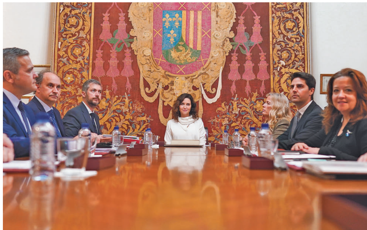
Isabel Díaz Ayuso y su equipo de Gobierno, en Alcalá de Henares

La presidenta critica que el Ejecutivo central los lleve “de tapadillo” a lugares como Alcalá, donde se ha producido una reyerta • También indicó que se habían denunciado agresiones sexuales, algo que el Gobierno niega