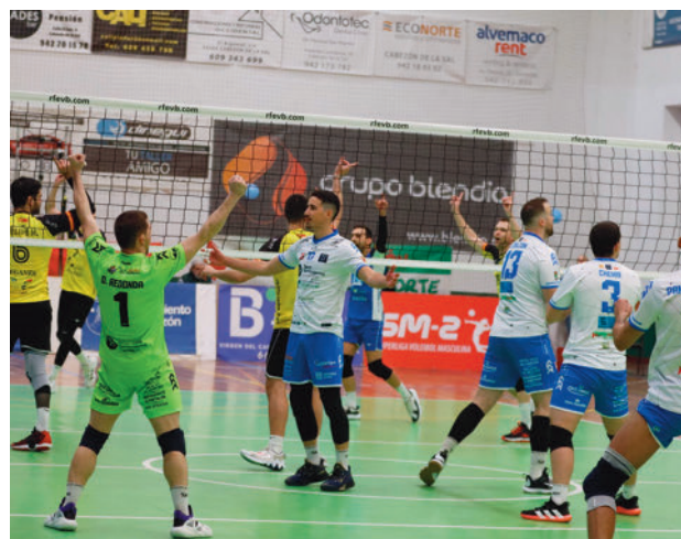
El Voley Textil Santanderina no dio opción en la final

que vivirá este fin de semana su primera jornada de este 2024. En ella, dentro del Grupo B de la Superliga Masculina 2, el cvleganes.com defiende su liderato en el Pabellón Europa este sábado 20 (16 horas) ante el segundo clasificado, el CV Utrera.