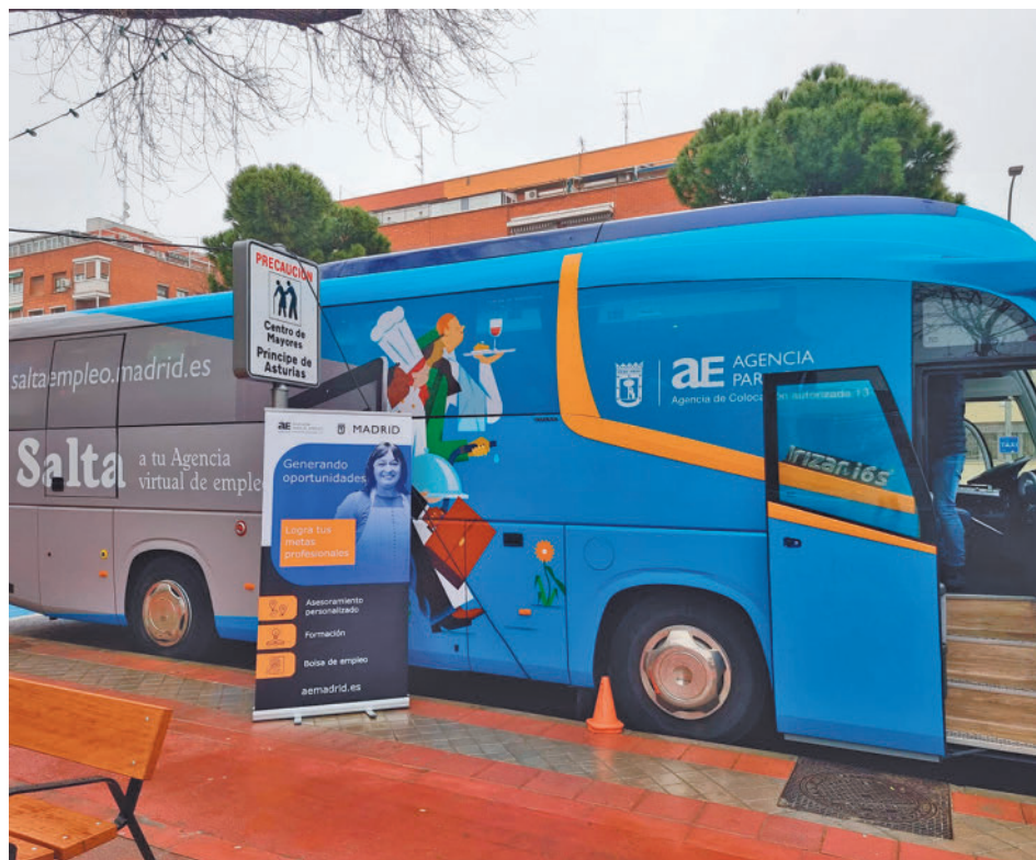
La unidad móvil de la Agencia para el Empleo de Madrid

gentedigital.es Toda la actualidad de los distritos de Madrid, en nuestra web