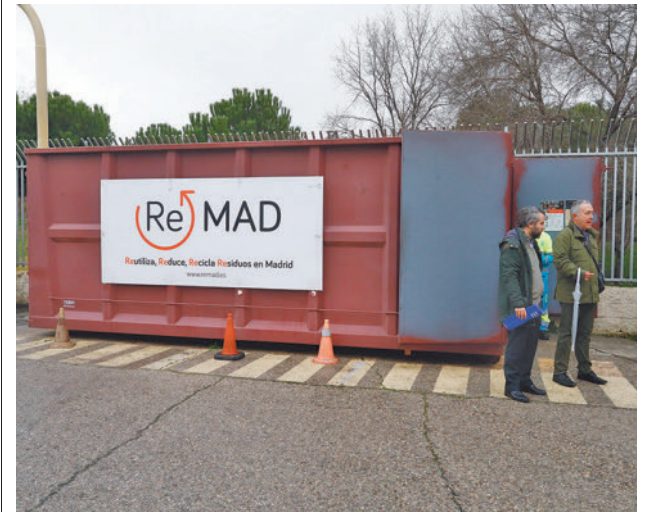
Uno de los contenedores municipales de reciclaje