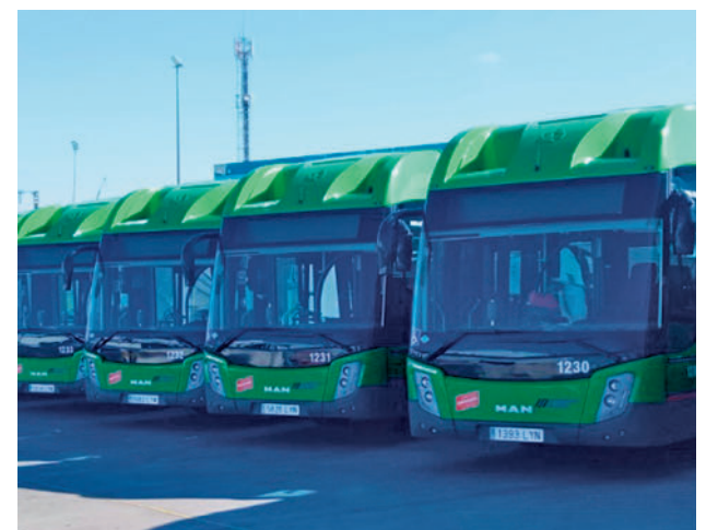
Autobuses del Grupo Ruiz GRUPO RUIZ

También desde CGT de la empresa de autobuses Avanza anunciaban que aplazaban los paros parciales previstos para dar un nuevo plazo a las negociaciones con la empresa, a la que reclaman cuestiones similares: nuevos horarios en las líneas acordes a descansos y velocidades máximas permitidas, plus de relevo con cuantía económica según zona o un sistema nuevo de libranza.