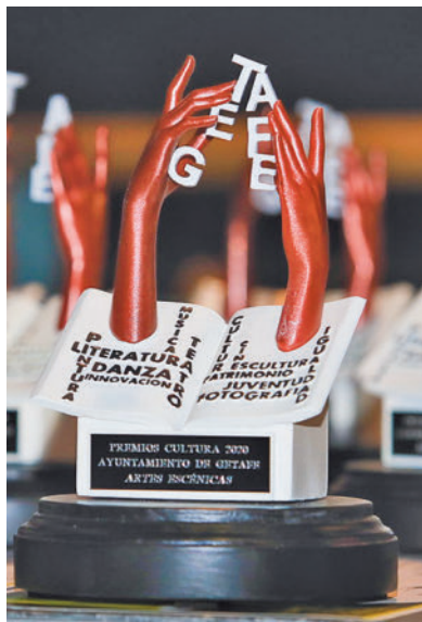
Premios de la Gala de la Cultura

Una trayectoria que el Partido Popular quiere que sea reconocida poniendo su nombre a un espacio público del municipio. También propone que se le otorgue un