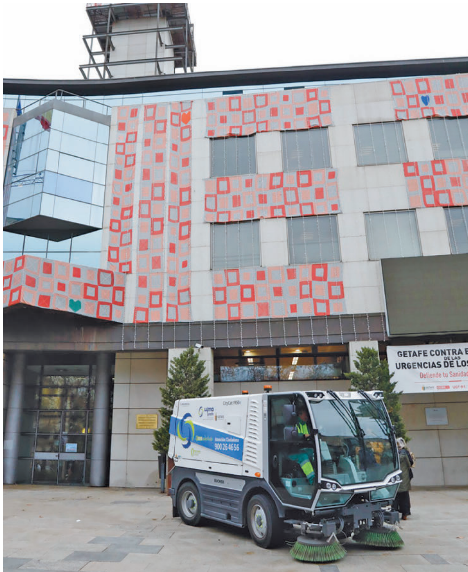
Una de las nuevas barredoras que se han sumado a la flota AYUNTAMIENTO DE GETAFE

Concretamente se han presentado tres furgonetas con trampilla elevadora, para la recogida de residuos de ropa y textiles, biorresiduos a grandes generadores y otros residuos en mercados. Una