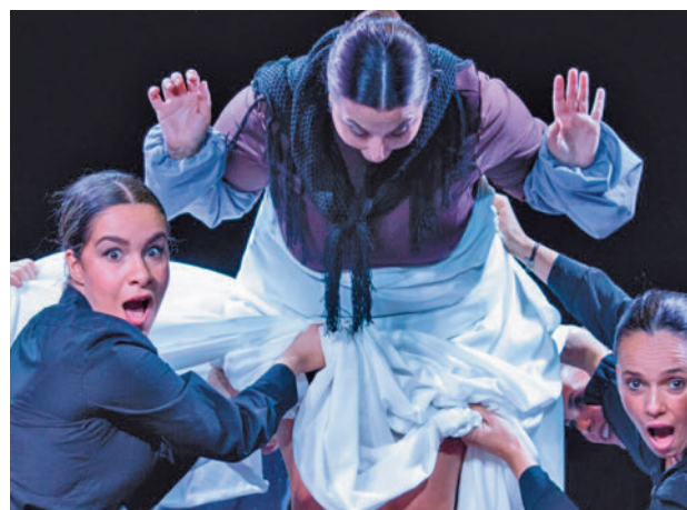
‘Bernarda Alba’ ASOCIACIÓN CULTURAL VIVIR POR LA DANZA

gentedigital.es Toda la actualidad de Getafe, en nuestra página web