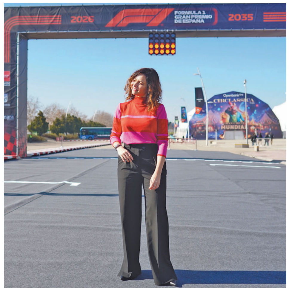
Isabel Díaz Ayuso, en las instalaciones de Ifema

Tanto Díaz Ayuso como Martínez-Almeida destacaron la importancia que tiene esta noticia para la región, mientras que Domenicali elogió que Madrid ha presentado "un proyecto innovador e imaginativo".