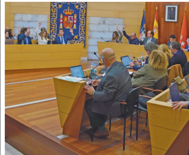
El momento de la votación en la sesión de presupuestos

Además, se destinarán 35 millones a inversiones. Entre los proyectos destacan el soterrado de líneas de alta tensión y cableado de telefónica, con 2 millones; las obras de rehabilitación de la calle Encinar, con una inversión de 1,5 millones, o más de 500.000 euros destinados a la urbanización de los barrios de La Suiza y Las Vírgenes.