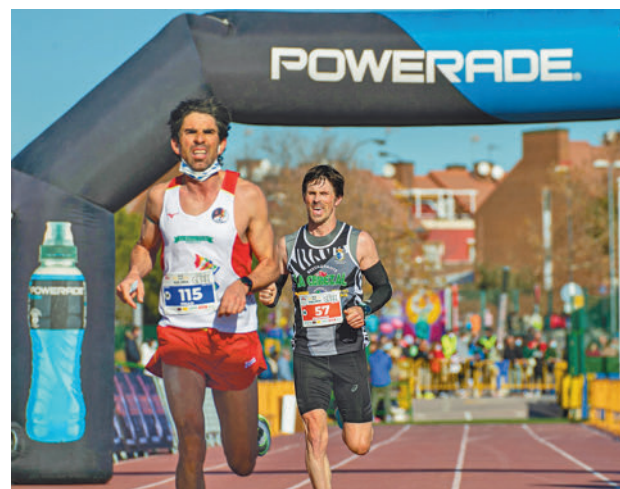
Edición anterior de la Media Maratón

Sin salir de Getafe, los amantes del atletismo tienen otra cita de categoría. Se trata de la Media Maratón Ciudad de Getafe, una prueba que alcanza su edición número 24 y que también se celebra este domingo 28 de enero por las