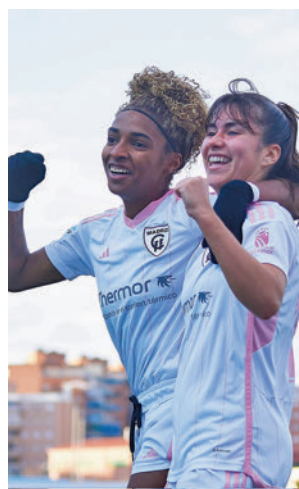
El Madrid CFF ya es cuarto

CFF aprovechaba el descanso liguero de sus dos equipos vecinos para sumar tres nuevos puntos y colocarse en cuarta posición con 30 pun-