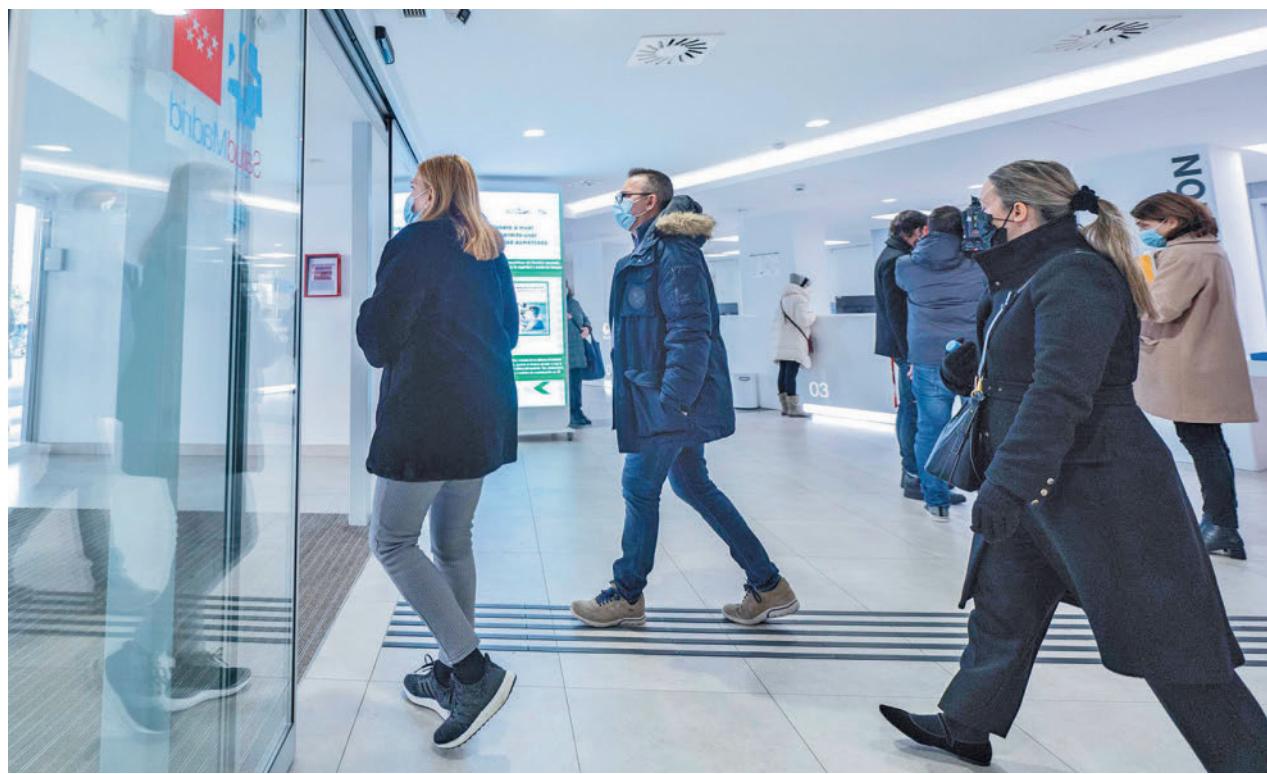
Personas con mascarilla en un centro sanitario madrileño.

Entre las cesiones parciales o completas que podrán visitarse está la Colección Paul Dahan, uno de los expertos más importantes de este tipo de arte en el mundo.