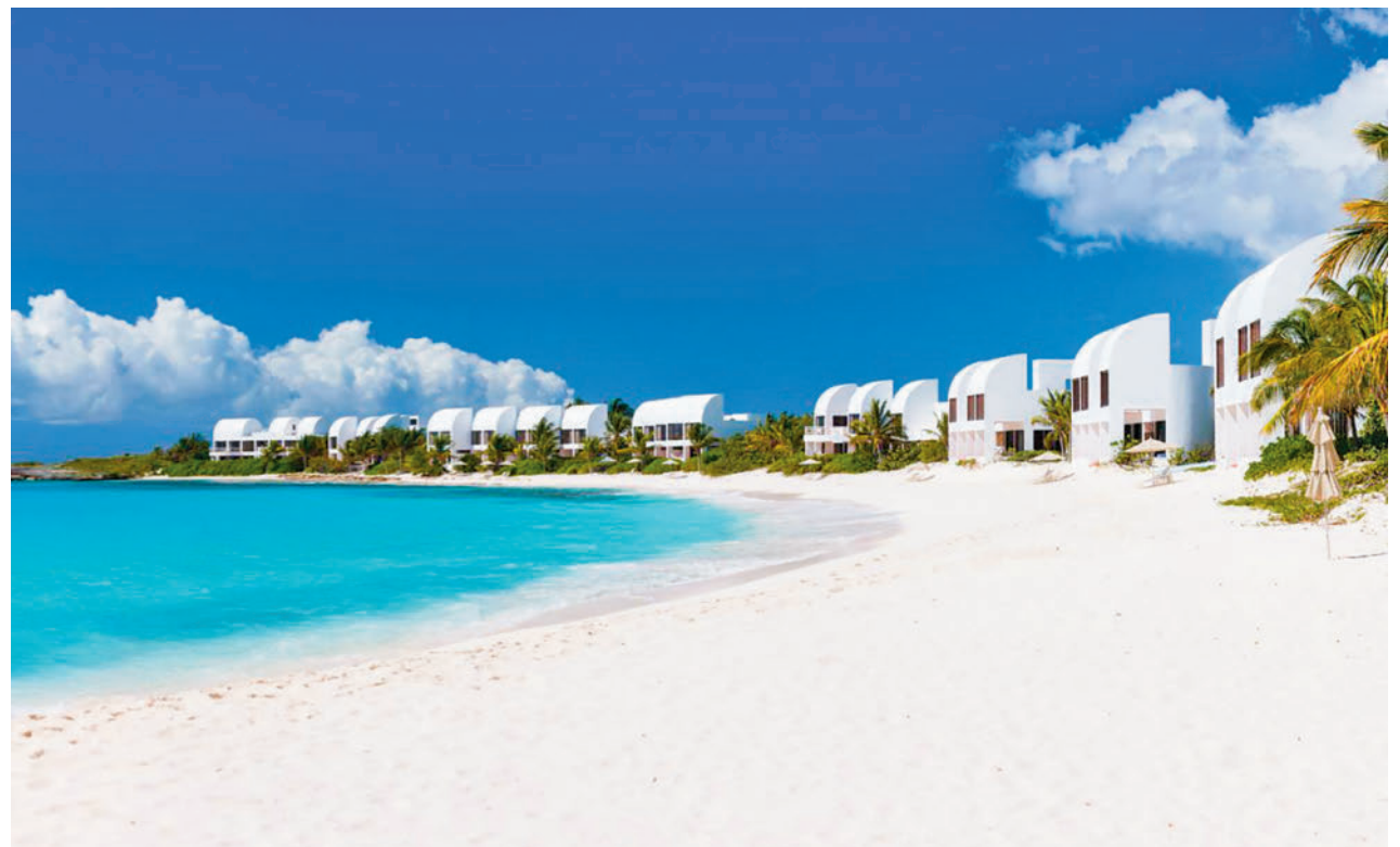
Las playas de Anguila dibujan un escenario paradisíaco

Si está pensando en visitar la zona o quiere conocer más detalles, no dude en acercarse a Fitur, donde podrá encontrar diversos stands con información de países como Cuba, de operadores turísticos y de empresas de 'Travel technology', así como de otras compañías relacionadas con el sector.