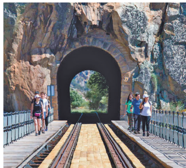
Camino de Hierro, en Salamanca

son lo novedoso e innovador del producto, su contribución al desarrollo turístico sostenible en sus eje económicos, medioambientales y sociales y la calidad de su imagen y de los elementos de marketing en torno al producto. El jurado ha