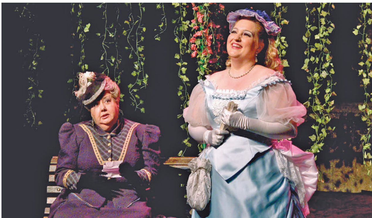
La zarzuela 'Agua, azucarillos y aguardiente' abre el menú cultural este sábado 27 de enero