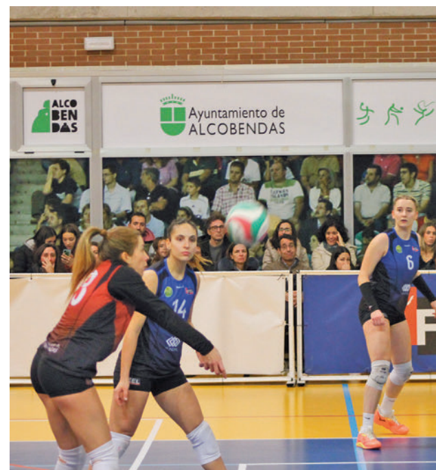
Nueva derrota del Feel Alcobendas

La fase regular de rugby toca a su fin este sábado con estas citas para los madrileños: Pozuelo-El Salvador (16 horas); Quesos Entrepinares-Complutense (16:30) y Belenos-Alcobendas (16:30).