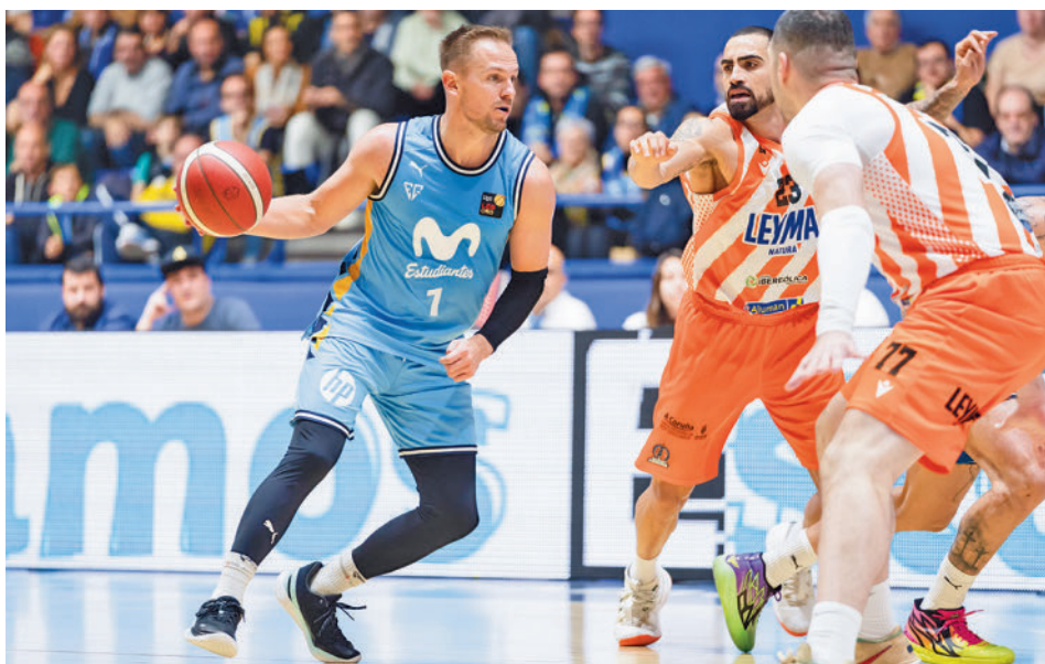
El último partido de Liga con Leyma Coruña acabó con polémica MOVISTAR ESTUDIANTES