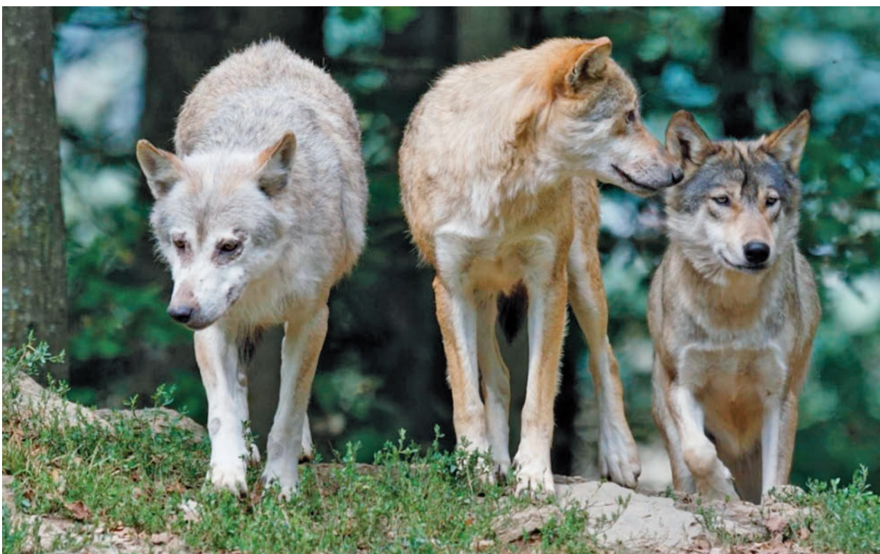
Los lobos, una amenaza directa para los ganaderos