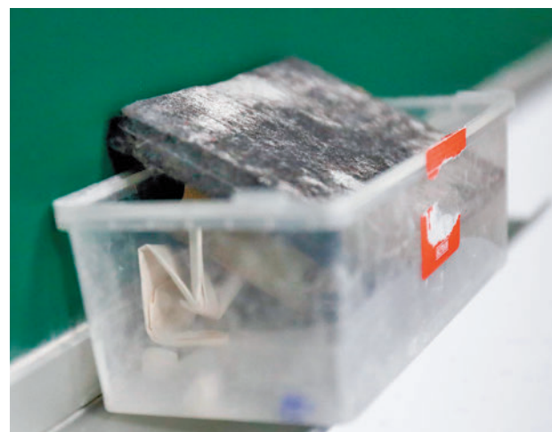
La LGTBIfobia está presente en las aulas E.P.

Hasta el 25% de los alumnos que contestaron la encuesta, según ha explicado el colectivo, no se considera heterosexual, y un 1,5% manifestó haber sufrido acoso LGTBIfóbico. Según la organización, estos datos reafirman la “imperiosa necesidad” de “garantizar entornos educativos seguros y respetuosos para todas las identidades”. También subraya “la importan-