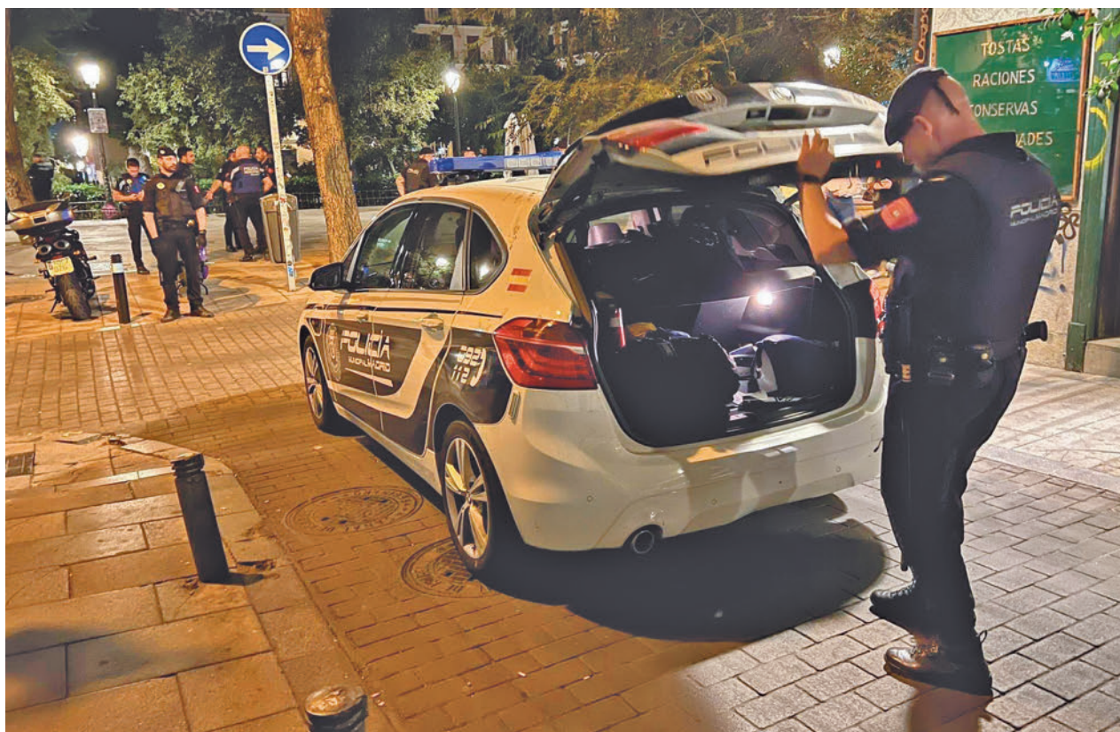
Actuación de la Policía Municipal de Madrid contra las bandas juveniles

El informe del Observatorio de Bandas asegura que la acción efectiva de los Cuerpos de Seguridad “no es suficiente” y recuerda que la propia memoria de la Fiscalía de Madrid de 2022 habla de que es “tremendamente alarmante” el fenómeno de reyertas entre bandas juveniles. Entre tanto “continúa el descontrol” en la venta de bolo machetes de unos 50 centímetros de hoja y navajas tipo mariposa,