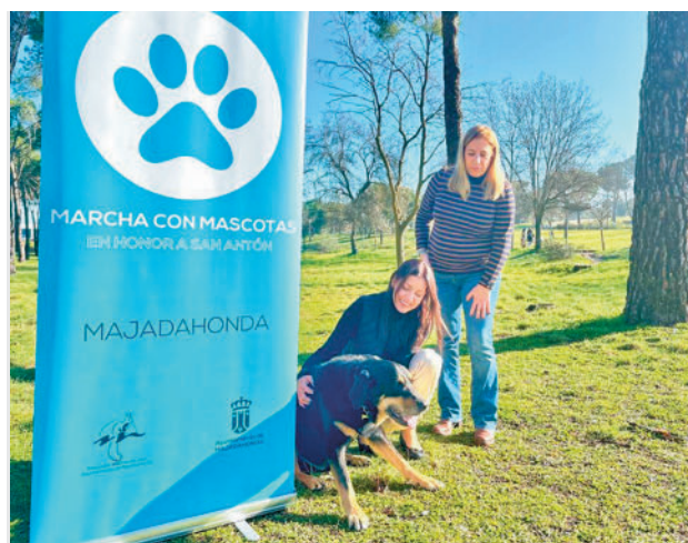
Dos de las participantes en la edición de 2023

El punto de encuentro será la fuente ornamental del Gran Parque Felipe VI del Monte del Pilar.