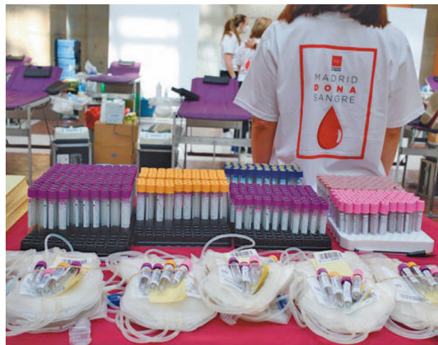
Dispositivo de donación de sangre E. P.

El dispositivo especial en la sede de la Presidencia del Gobierno regional en Sol contará con 12 puestos instalados en uno de sus patios y estará