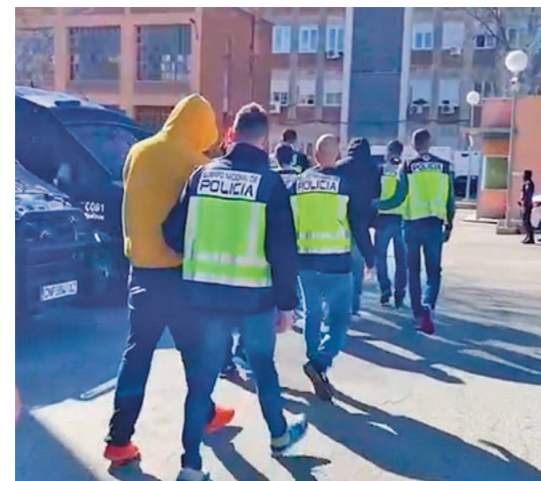
Pandilleros detenidos en Madrid

El Centro de Ayuda Cristiano ha continuado ofreciendo charlas de prevención en centros educativos y entidades aportando testimonios de expandilleros para concienciar a los jóvenes.