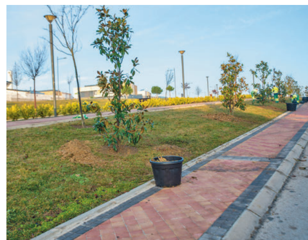
Plantación de árboles en Boadilla

Como actuación especial, se va a sustituir el arbolado en mal estado de la avenida Isabel de Farnesio. Se conservarán los cipreses con buen estado fitosanitario y se retira-