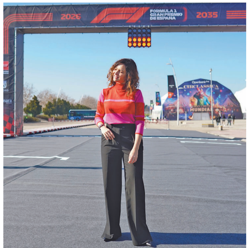
Isabel Díaz Ayuso, en las instalaciones de Ifema

Tanto Díaz Ayuso como Martínez-Almeida destacaron la importancia que tiene esta noticia para la región, mientras que Domenicali elogió que Madrid ha presentado "un proyecto innovador e imaginativo".