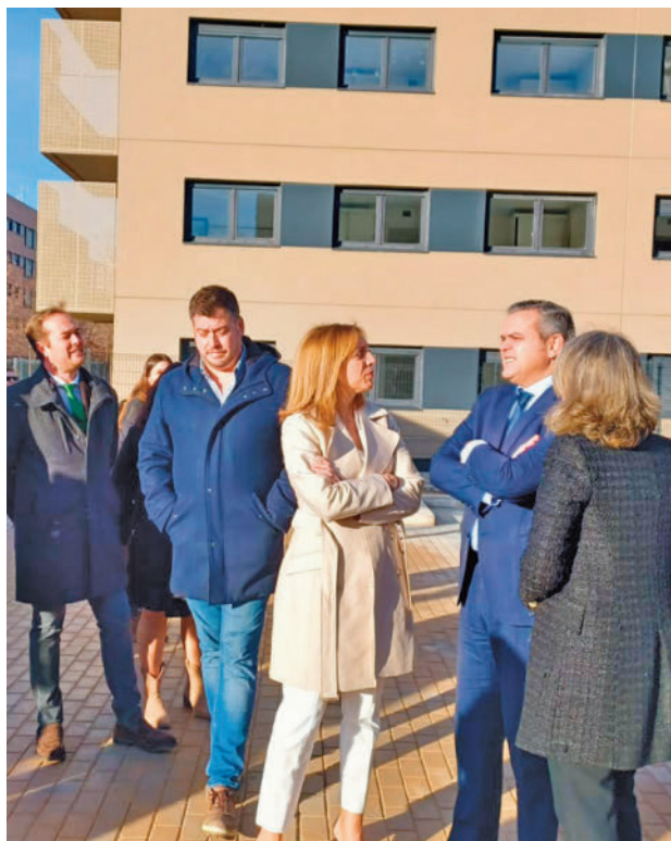
La alcaldesa y el consejero de Vivienda

En cuanto a los precios, las de 42 metros cuadrados útiles tendrán un coste de 429