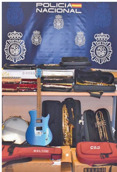
Parte de los artículos robados

Agentes de la Policía Nacional han detenido en Alcorcón a un hombre acusado de apropiarse de más de 300 instrumentos musicales valorados en una cifra superior a los 190.000 euros., algo que llevaría haciendo, presuntamente, desde finales de 2018, valiéndose de su condición de encargado-jefe del almacén de la tienda de música en la que trabajaba. "Abusando de la confianza que le otorgaba