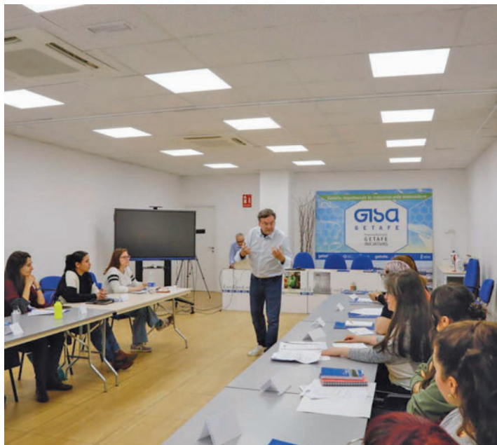
Formaciones anteriores AYUNTAMIENTO DE GETAFE

A las asistentes se les enseñará el proceso completo de creación del negocio, desde el desarrollo de la idea, hasta la constitución de cada uno de los proyectos empre-