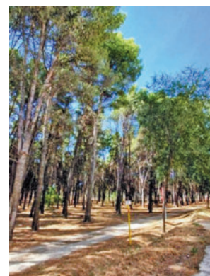
Masa arbórea de Getafe AYTO

El Ayuntamiento aprobó hace un año la reclasificación de 93.000 metros cuadrados de suelo para llevar a cabo una vía-bosque, con dos terceras partes de su sección ocupadas por una masa arbórea.