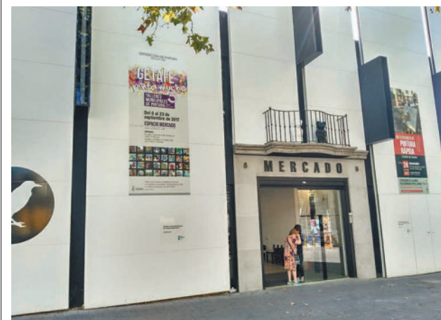
Fachada del Espacio Mercado GENTE

A las alumnas también se les da la información necesaria sobre los permisos y otras autorizaciones de las administraciones, las herramientas para conseguir e incrementar los ingresos, la realización de un Plan de Marketing, la comunicación para PYMES, los instrumentos financieros para el desarrollo del negocio; el emprendimiento en clave de género y la metodología de aprendizaje para el mundo de la empresa.