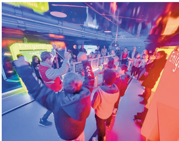
Una de las actividades de la Caravana Planeta ODS

Esta propuesta incluye diferentes iniciativas como un 'escape room', un circuito de movilidad y una actividad de hogar virtual para la prevención de lesiones y accidentes en el hogar.