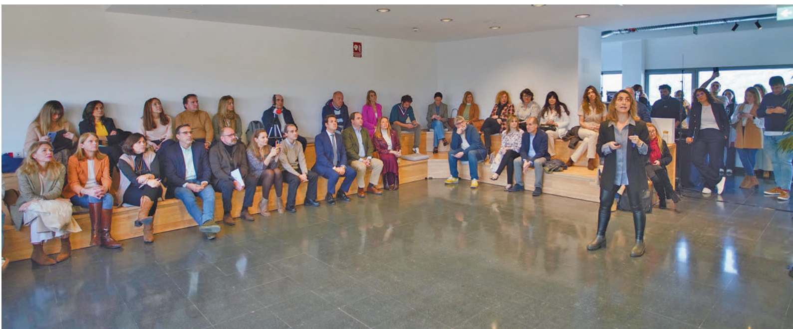
Presentación del nuevo asistente virtual del Ayuntamiento de Las Rozas