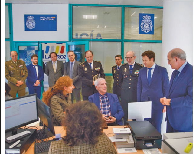
Las autoridades conversaron con varios usuarios

La actualidad de los municipios del Noroeste, en nuestra web