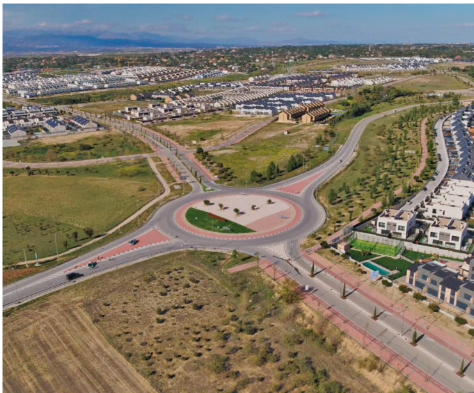
Una de las zonas donde se levantarán las nuevas viviendas

EL PLAZO DE PRESENTACIÓN DE OFERTAS FINALIZARÁ EL 5 DE MARZO