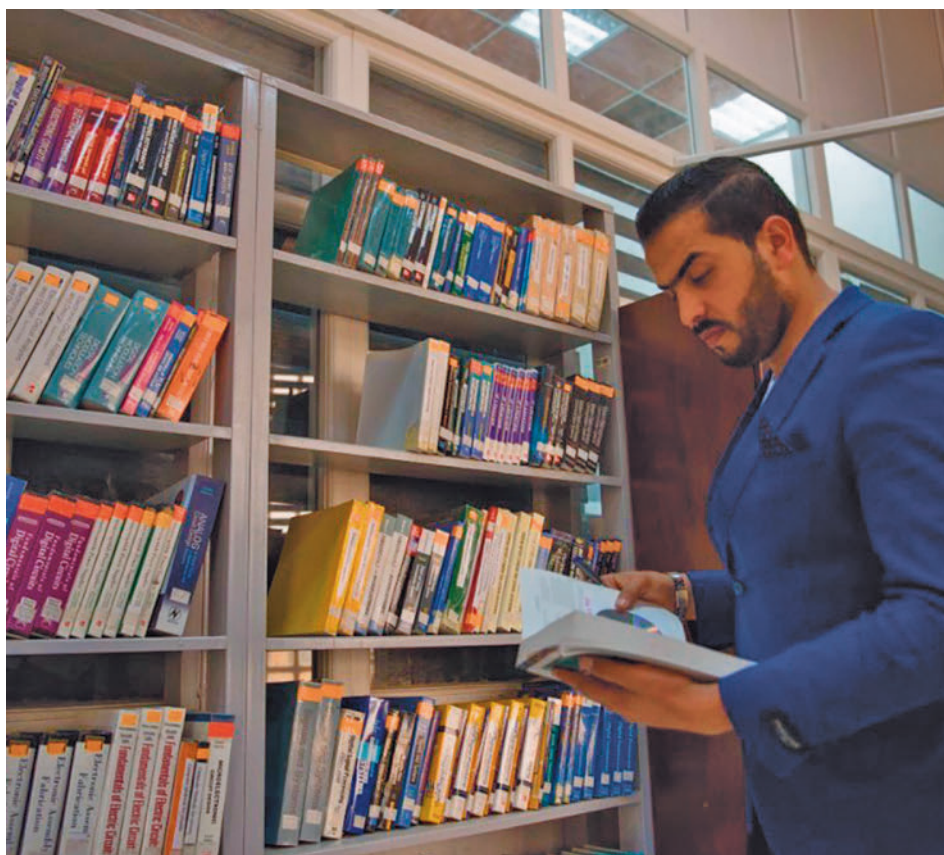
Los madrileños leen más que el resto de españoles

La UCI Pediátrica atiende cada año a más de 900 niños en estado crítico de todo el territorio nacional y con una gran complejidad médicoquirúrgica, como trasplantes, cardiopatías congénitas, politraumatismos, accidentes y oncología.