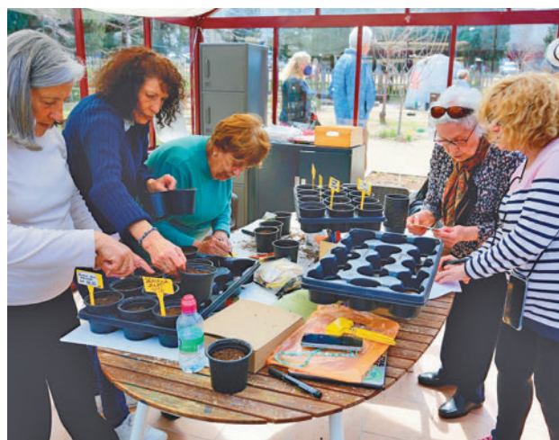
Uno de los talleres de ediciones anteriores

Uno de los objetivos del Gobierno municipal es combatir la soledad no deseada y por ello han creado una nueva actividad llamada Sabor Social, que favorece los encuentros entre mayores.