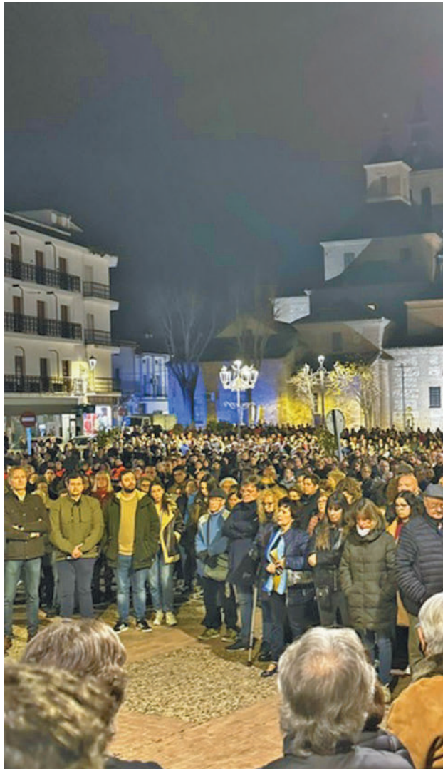
Concentración en Arganda del Rey

SE GUARDARON CINCO MINUTOS DE SILENCIO EN APOYO DE SUS FAMILIARES