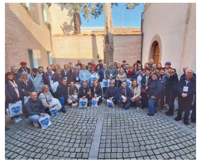
Visita de los turoperadores mexicanos

Toda la actualidad de la zona Este, en nuestra página web