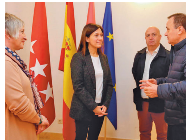
Participantes en la reunión sobre la Cañada

La reunión se enmarca en una ronda de encuentros que la Delegación del Gobierno en Madrid quiere mantener con los diferentes implicados en aportar soluciones para la Cañada Real. La subdelegada visitará próximamente la zona y mantendrá encuentros con asociaciones como la Asociación de Mujeres Tabadol y el Equipo de Mediación de la Cañada.