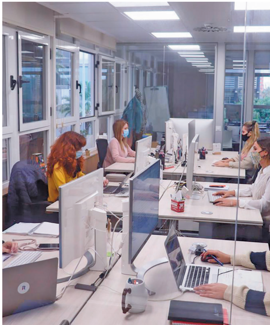
Las mujeres siguen cobrando menos que los hombres

CCOO recoge en su informe que la parte principal de la desigualdad salarial entre mujeres y hombres se explica por la diferente distribución laboral y composición del empleo. "Las mujeres soportan una inserción laboral en peores condiciones, lo que se traduce en un salario medio