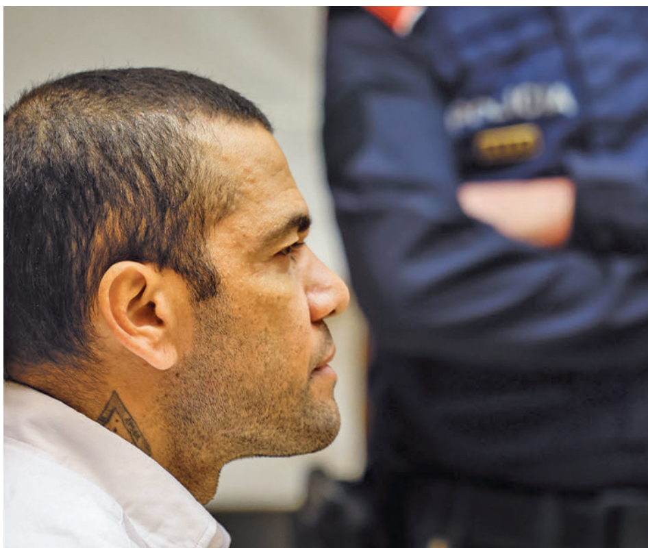
La psicòloga forense de l'IMLCFC i la psiquiatra s'han discutit amb certa vehemència.