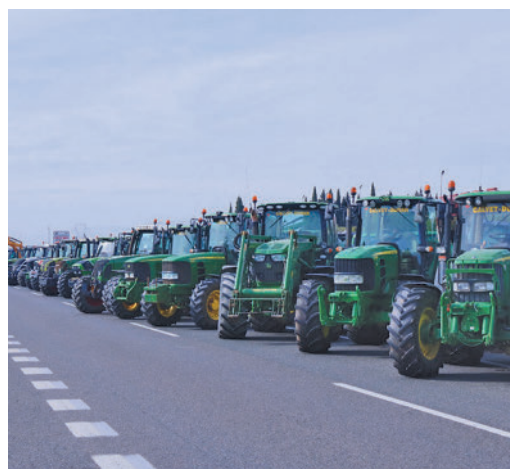
Demanan fer viable la petita agricultura.

EL PERIÓDICO GENTE NO SE RESPONSABILIZA NI SE IDENTIFICA CON LAS OPINIONES QUE SUS LECTORES Y COLABORADORES EXPONGAN EN SUS CARTAS Y ARTÍCULOS