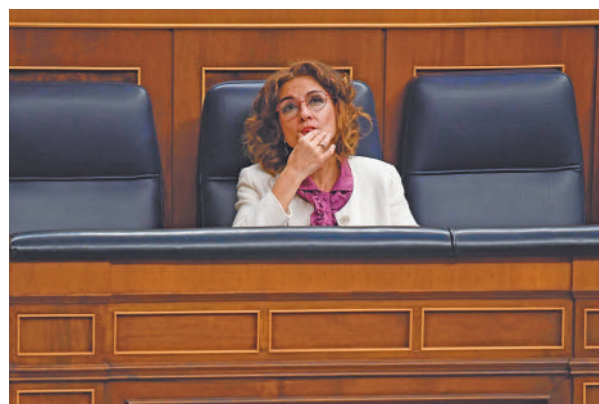
La ministra María Jesús Montero

modo, el salario mínimo interprofesional no queda sujeto a retención, dado que el mínimo exento se situará en la misma cuantía anual que el SMI. Así, se evita que los contribuyentes afectados soporten retención o ingreso a cuenta.