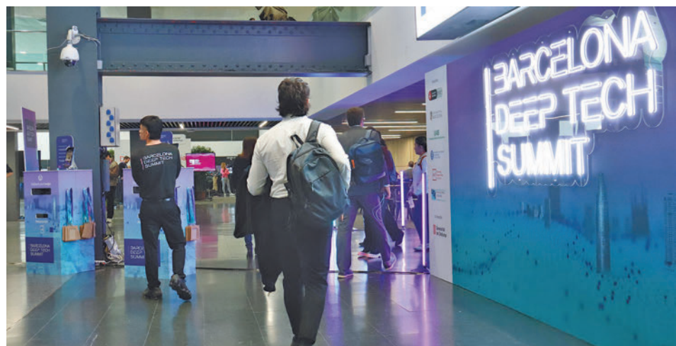
Dónen feina a uns 20.000 treballadors. ACN

L'informe conclou que les empreses emergents generen 20.600 llocs de treball i facturen de manera agregada 2.112 milions d'euros (un 14% més que l'any anterior), d'acord amb dades del 2022. El secretari d'Empresa i Competitivitat, Albert Castellanos, ha remarcat que la dinàmica actual denota la "maduresa".