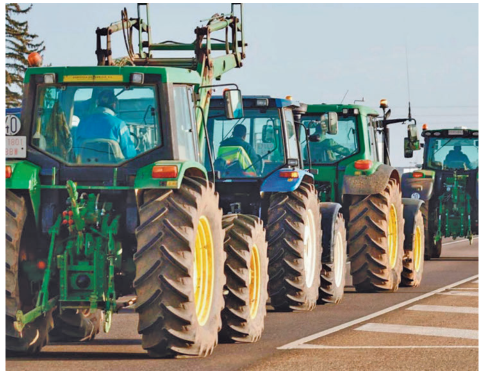
Centenars de tractors han col·lapsat la ciutat.

"Hem d'explicar que els ous surten de les gallines i que els pollastres no surten desossats com al súper", exclamava un dels productors muntat dalt d'un tractor mentre passava per davant de la Sagrada Família. La pagesia