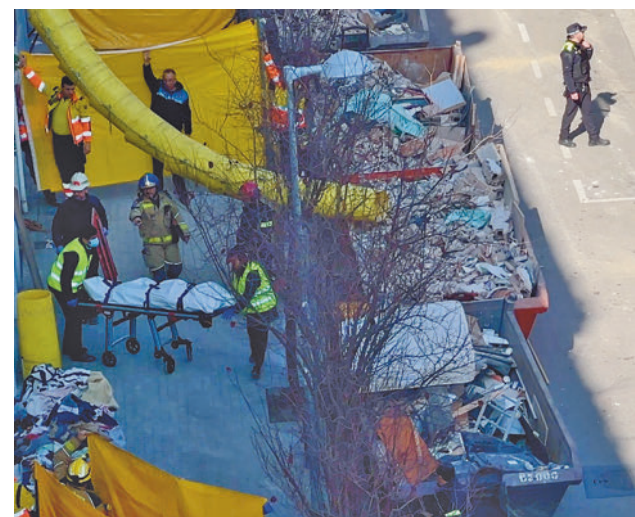
Dimecres va finalitzar l'aixecament dels cadàvers.

Així, per exemple, no recordava si li havia fet una fel·lació a Alves al final de l'agressió sexual. També deia que patia insomni i que havia deixat de fer moltes coses.