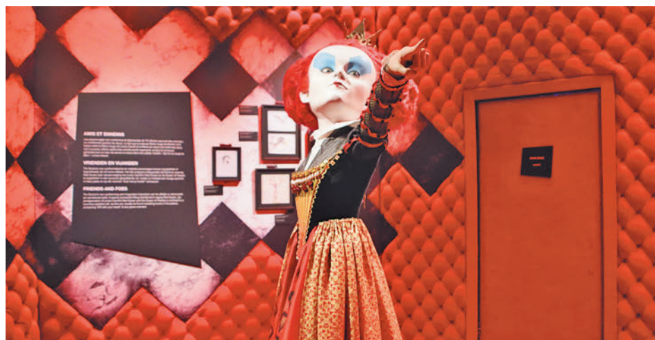
Després de passar per Madrid, París i Brussel·les, Barcelona serà la quarta parada.

ropees i que farà parada a la capital catalana el 8 de març. Es tracta d'un viatge per la ment del cineasta nord-americà a través del seu univers