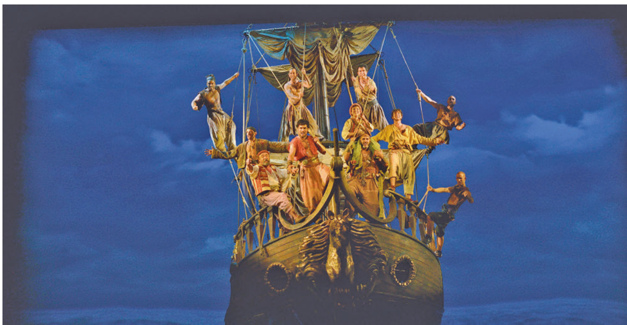
Entre les més de 1.000 candidatures rebudes, 109 aspirants faran el procés de selecció.

'MAR I CEL': 35 ANYS D'HISTÒRIA | TORNA ALS ESCENARIS