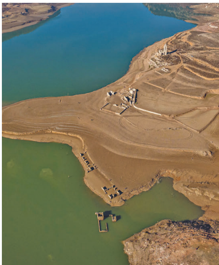
Barcelona es prepara per rebre els vaixells.

ció ha portat el govern espanyol a moure fitxa i dissabte passat es va fer públic que la ministra Ribera va traslladar, a través d'una trucada telefònica, al president de la Generalitat Valenciana, Carlos Mazón, la petició de portar vaixells carregats d'aigua des de la dessalinitzadora de Sa-