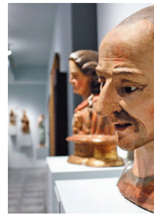
Part del museu.

Ubicat al bell mig del centre històric, a l'antic col·legi Sant Ignasi, el museu exposa 182 peces. S'hi troben els autors més representatius del barroc català com Antoni Viladomat, Joaquim Juncosa,